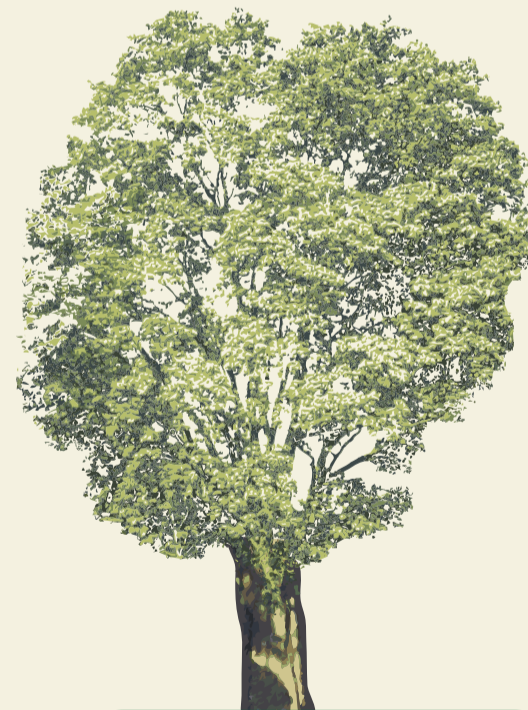
Pau Brasil ( Caesalpinia echinata )

É uma árvore pioneira - árvore de clareira e de rápido crescimento ao sol muito recomendada para paisagismo, na composição de reflorestamentos e recuperação da vegetação de áreas degradadas. Atinge seu porte adulto máximo em menos de 10 anos, com altura que varia de 8 a 16 metros. Suas folhas ásperas servem como lixa de madeira, sendo que as folhas novas são o principal alimento do bicho-preguiça. Seus frutos são comestíveis e muito procurado por animais.