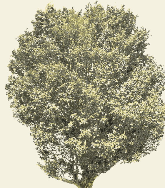
Pitanga ( Eugenia uniflora )

Seu nome de origem indígena significa árvore onde moram os urubus, mas é também conhecida como rei da floresta, por sua altura de 20 a 30 metros. As flores amarelas, desta árvore nativa, são muito vistosas, e a folhagem tipo samambaia oferece uma sombra leve e agradável, o que a torna particularmente apropriada para o uso em parques.