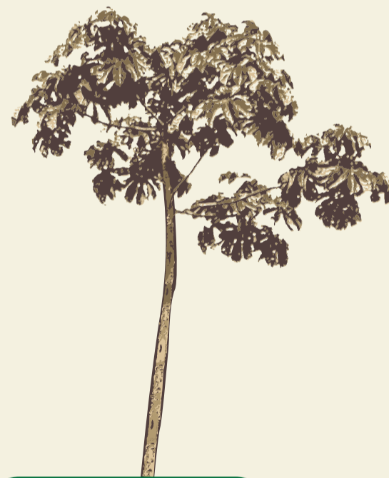
Embaúba ( Cecropia glazioui )

As trilhas interpretativas em Educação Ambiental desenvolvidas pela equipe do Programa visam estimular a capacidade de observação e reflexão, viabilizando, assim, a informação biológica, social, cultural, geográfica e histórica, a sensibilização e a conscientização socioambiental, propiciando ao cidadão, a partir de uma nova leitura da realidade, repensar e rever sua relação com o meio ambiente como um todo.