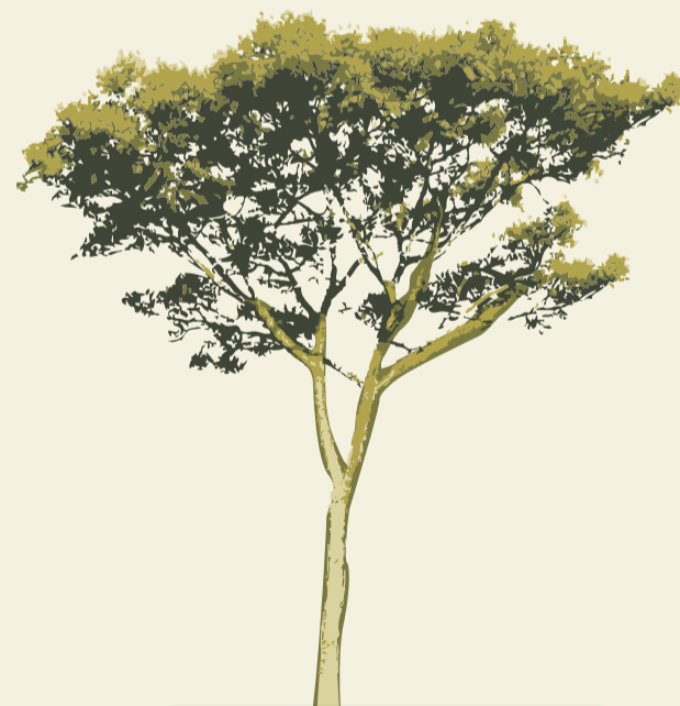
Guapuruvu ( Schizolobium parahyba )

Com seu tronco espinhoso e sua madeira avermelhada, o Pau Brasil é originário da Mata Atlântica. É uma espécie muito próxima da Sibipiruna ( C. peltophoroides ) e do Pau Ferro ( C. ferrea ), as três pertencendo ao mesmo gênero ( Caesalpinia ). No período colonial, foi responsável pelo batismo do nosso país devido à sua abundância. Nessa época, foi altamente explorado, devido ao então raro corante vermelho extraído de sua madeira.