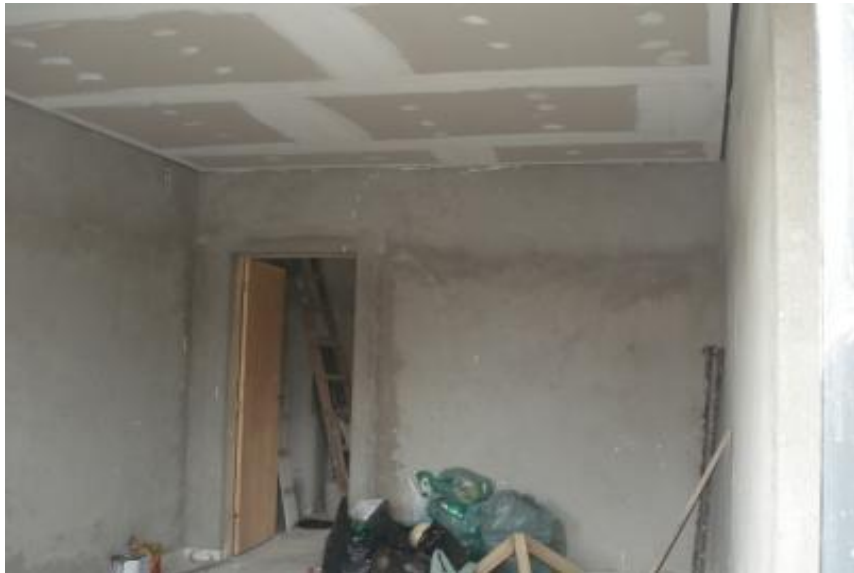
FORRO DE GESSO HALL DE ENTRADA - CONCLUÍDO