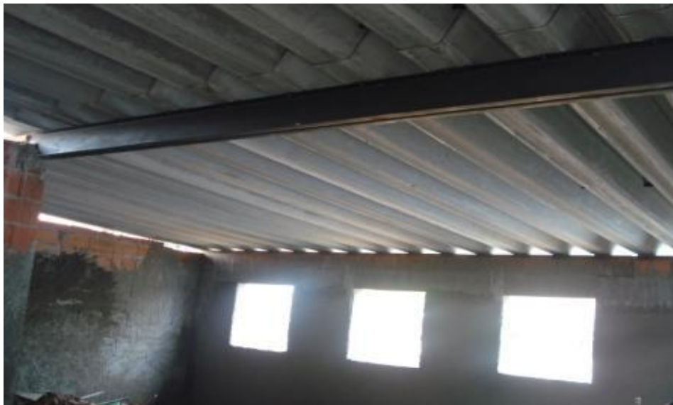
VISTA INTERNA (INSTALAÇÃO DA COBERTURA)