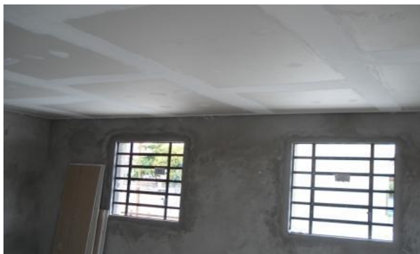
FORRO DE GESSO SALA 2 - CONCLUÍDO