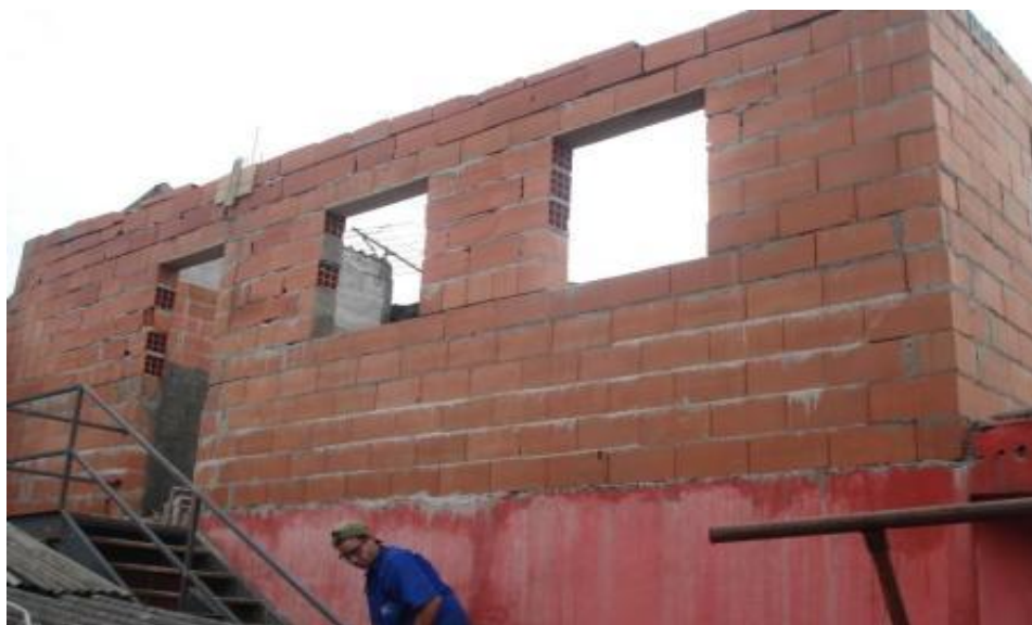
VISTA LATERAL DA OBRA