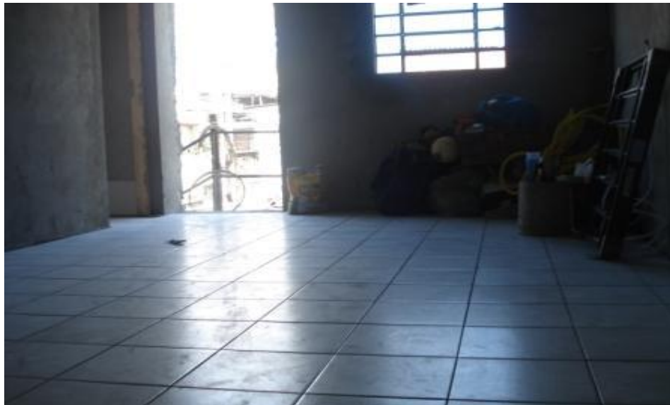
PISO DO HALL EM FASE FINAL