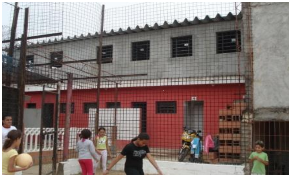
VISTA FRONTAL DA OBRA - REVESTIMENTO CONCLUÍDO