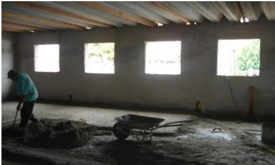
EXECUÇÃO DO CONTRAPISO - PREPARO PARA INSTALAÇÃO DO FORRO