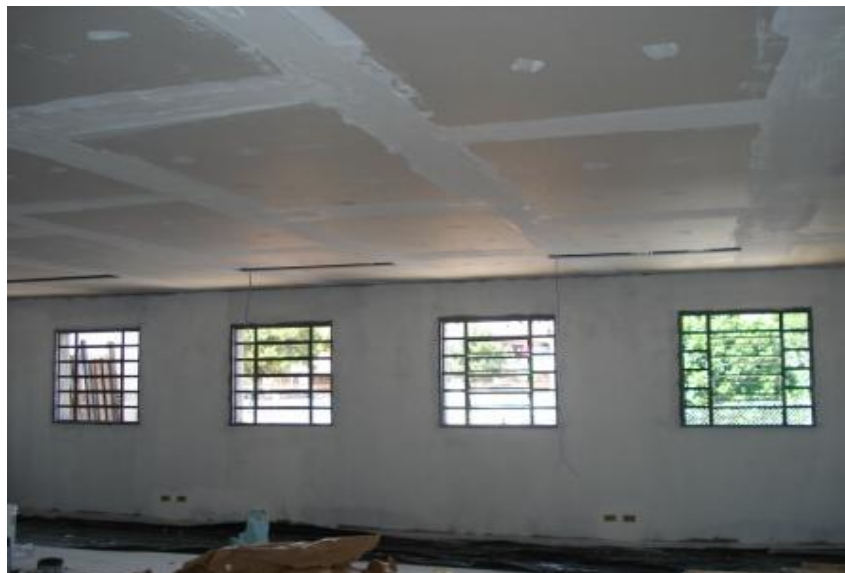
FORRO DE GESSO SALA 1 - CONCLUÍDO / INSTALAÇÃO DAS LUMINÁRIAS