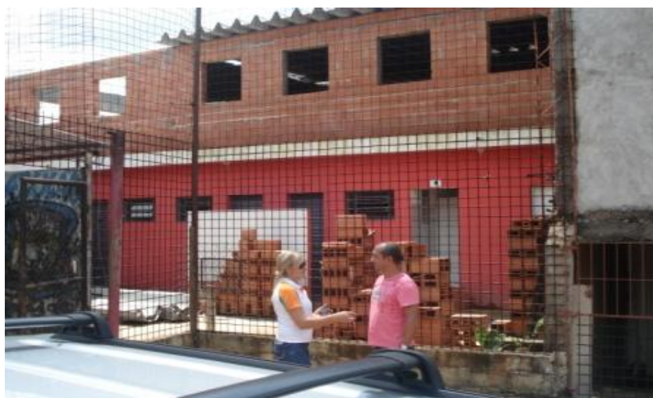
VISTA FRONTAL DA OBRA