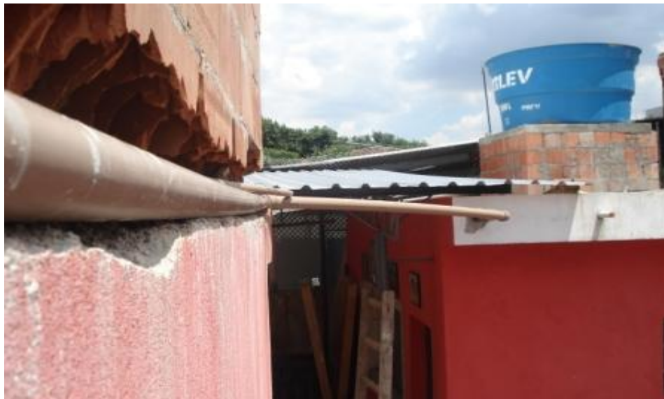
READEQUAÇÃO DA REDE DE DISTRIBUIÇÃO DE ÁGUA