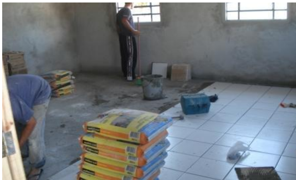
EXECUÇÃO PISO SALA 01