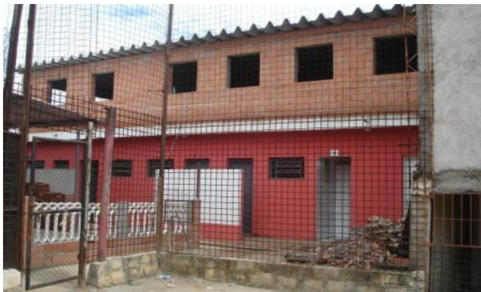
VISTA FRONTAL DA OBRA