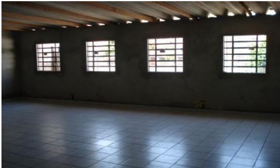
PISOS EM FASE FINAL(SALA-2) - ESQUADRIAS INSTALADAS