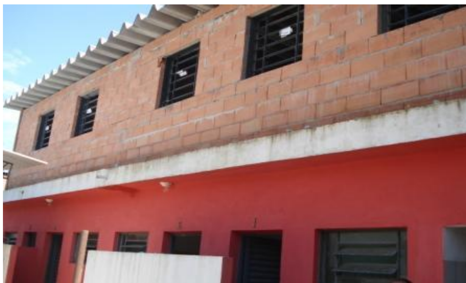
VISTA FRONTAL DA OBRA COM ESQUADRIAS INSTALADAS