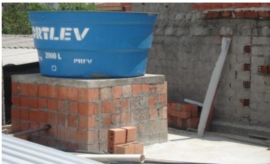
CAIXA D'ÁGUA REMOVIDA PARA A LAJE DA LANCHONETE