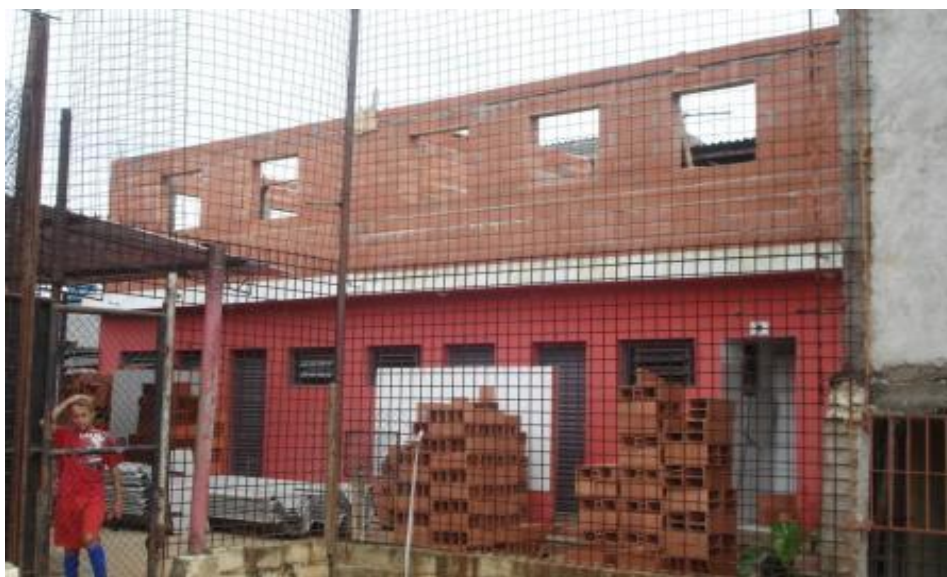
VISTA FRONTAL DA OBRA