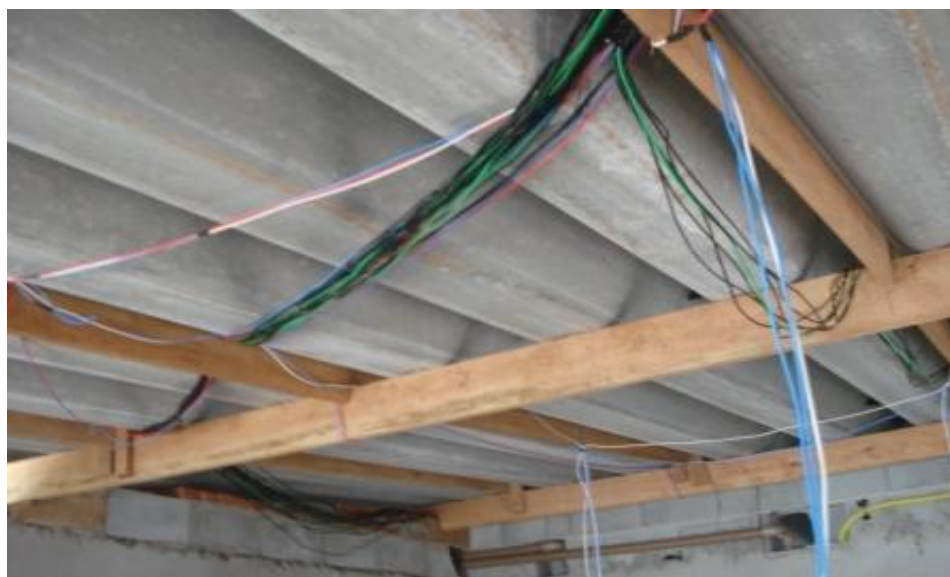
INSTALAÇÃO ELÉTRICA EM DESACORDO COM AS NORMAS TÉCNICAS SOLICITADO O REFAZIMENTO.