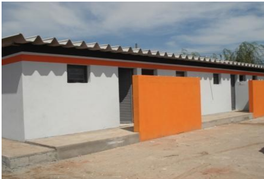
ENTRADA DOS VESTIÁRIOS