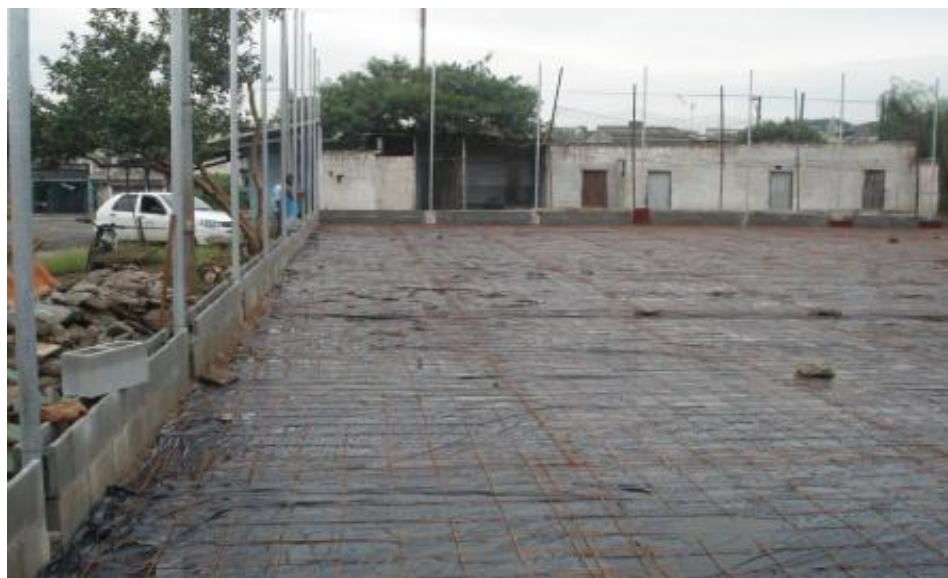
EXECUÇÃO DO ALAMBRADO