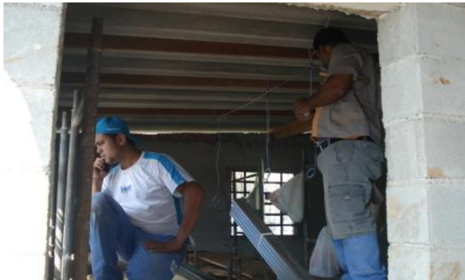
INICIO DA INSTALAÇÃO DO FORRO DE GESSO