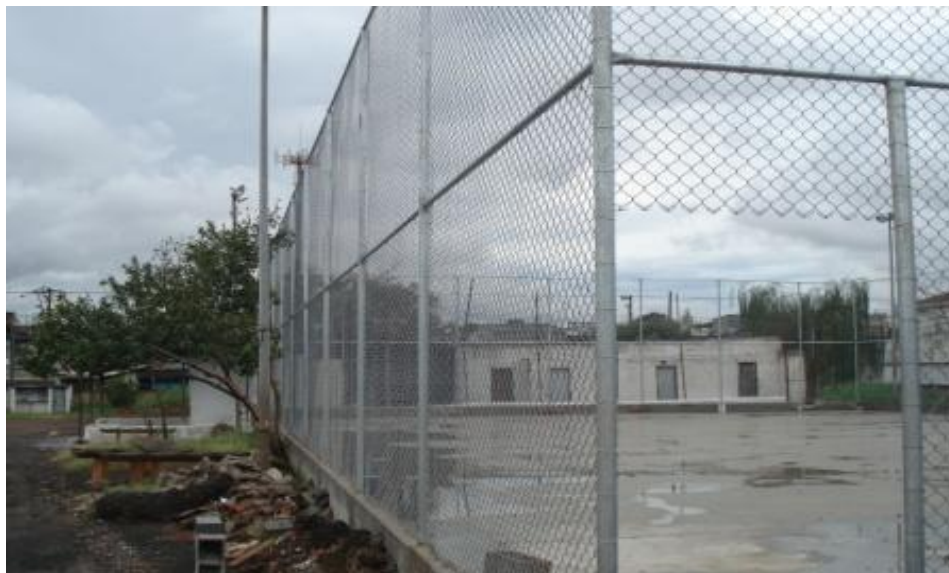
TELAS DO ALAMBRADO INSTALADAS