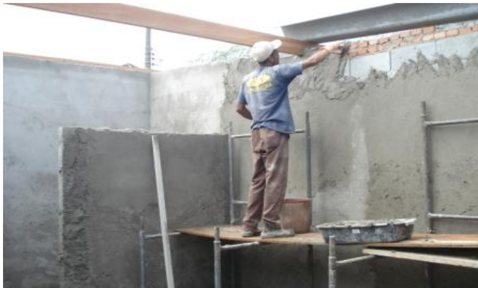
EXECUÇÃO DE REVESTIMENTO DE PAREDE