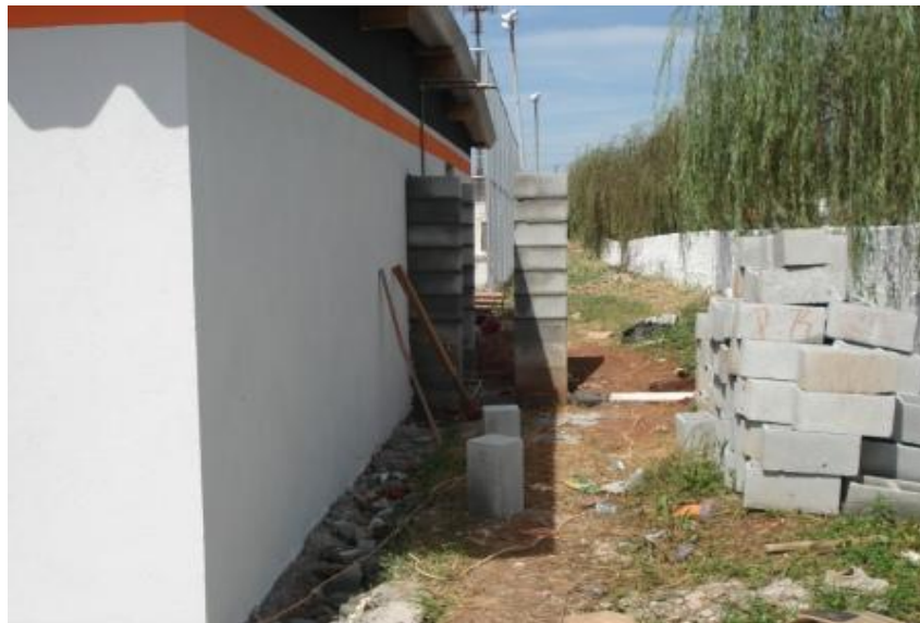
EXECUÇÃO DA TORRE DAS CAIXAS D'ÁGUA