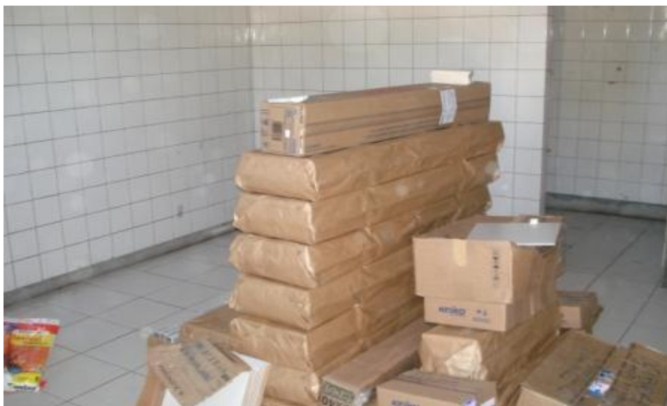
REVESTIMENTOS DE PISO E PAREDES EM FASE FINAL