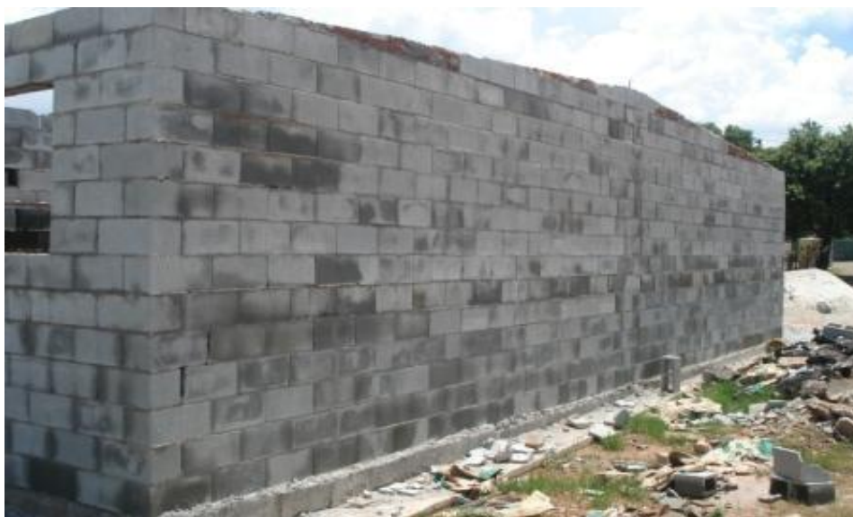
EXECUÇÃO DO ALVENARIA