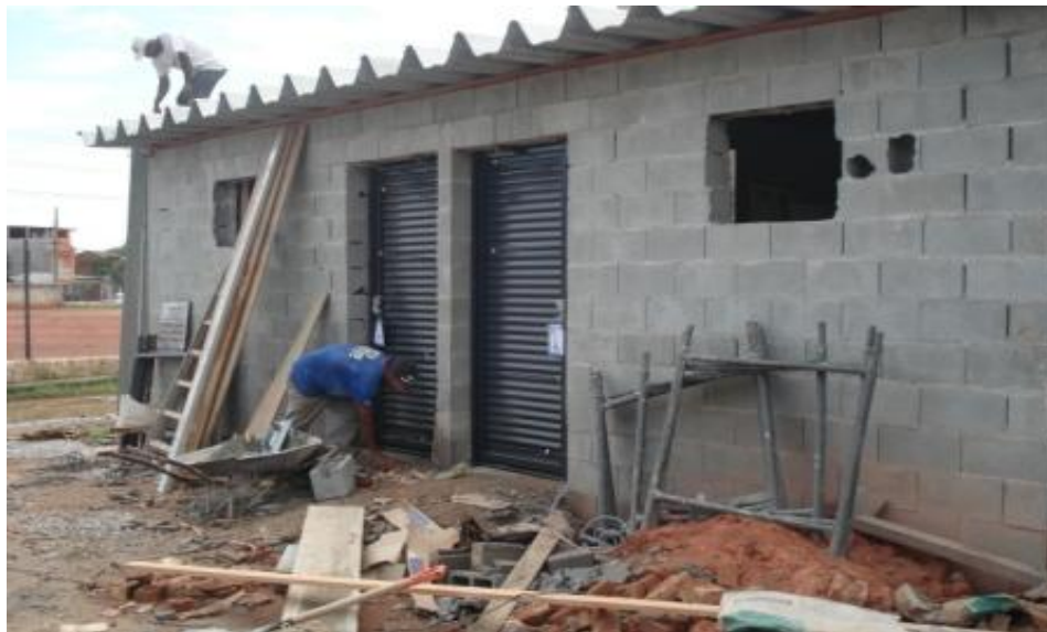
PORTAS DOS VESTIÁRIOS E EXECUÇÃO DA COBERTURA