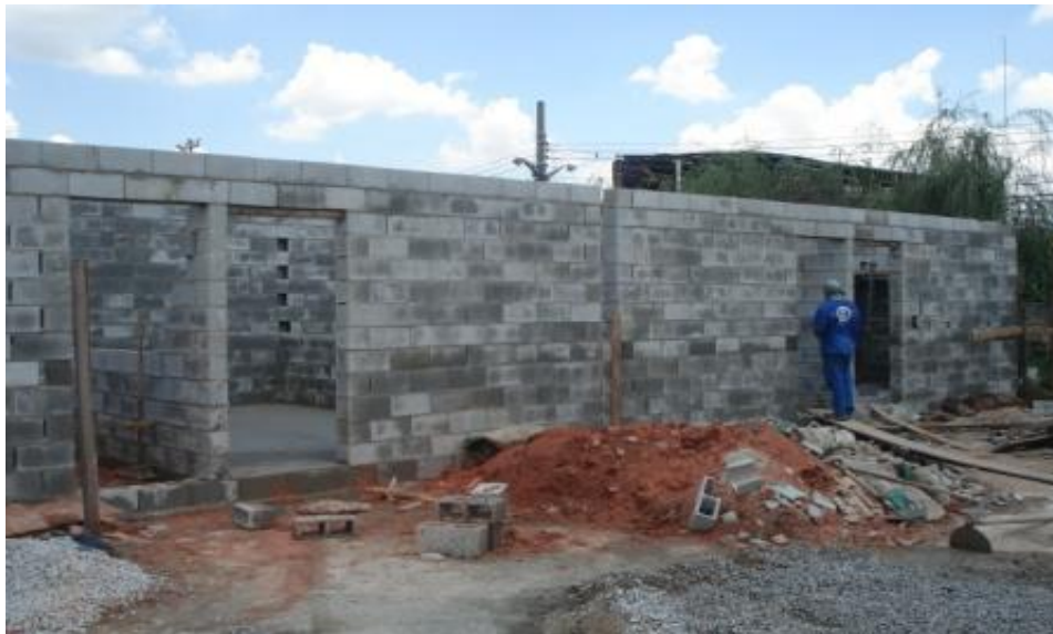
VISTA DA EXECUÇÃO DA ALVENARIA E CONTRAPISO