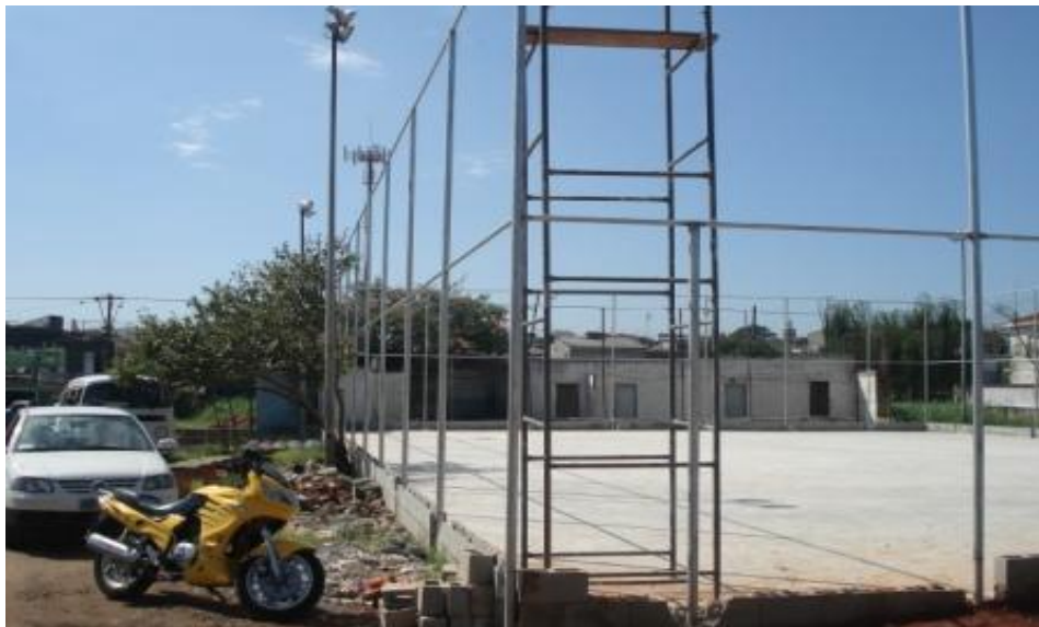
ESTRUTURA DO ALAMBRADO CONCLUÍDA