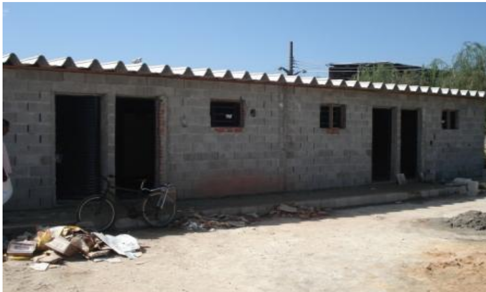
VISTA DOS FUNDOS (ENTRADA DOS VESTIÁRIOS)