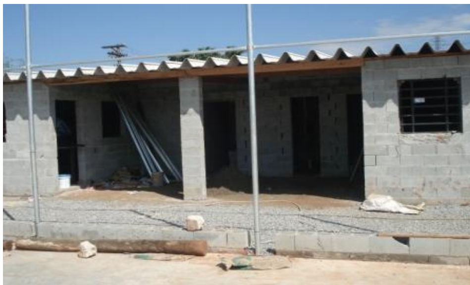
VISTA FRONTAL - COBERTURA CONCLUÍDA