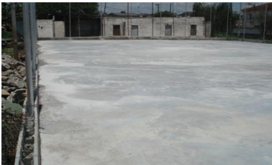
EXECUÇÃO DO PISO DA QUADRA