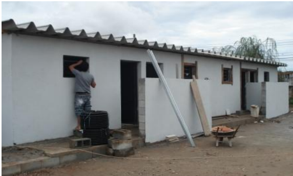
ENTRADA DOS VESTIÁRIOS