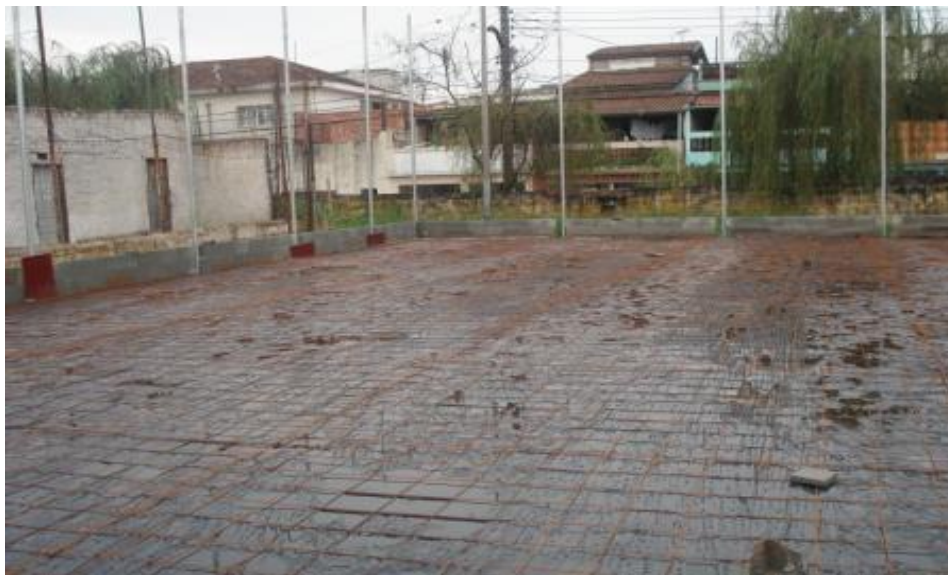
EXECUÇÃO DO PISO DA QUADRA