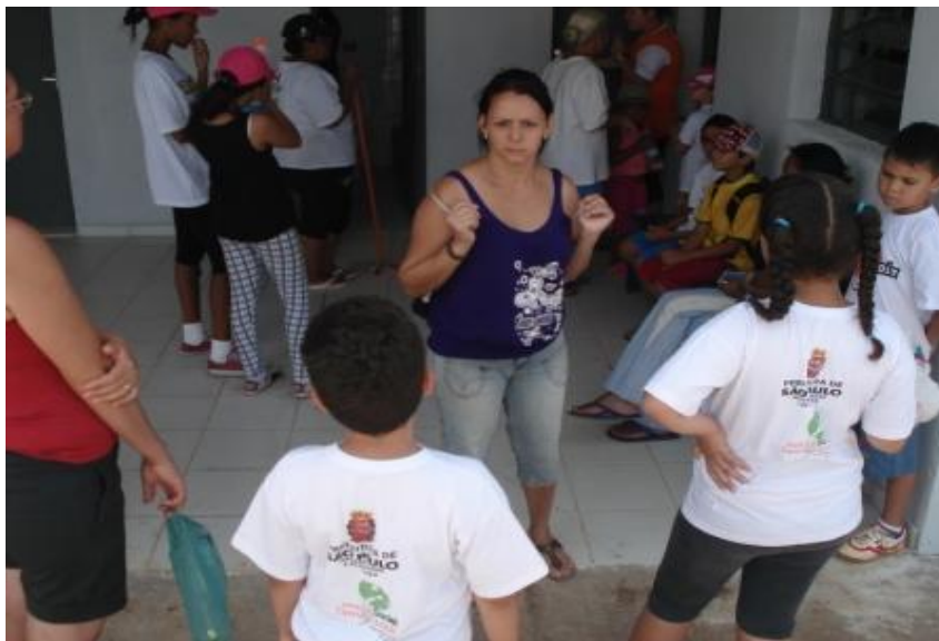
EQUIPAMENTO COM ATIVIDADES