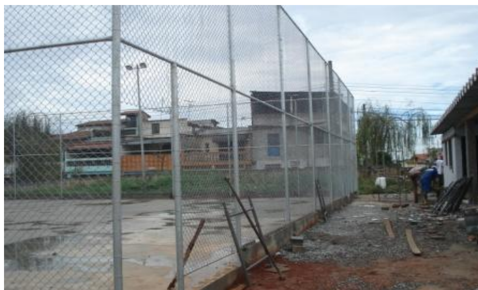
TELAS DO ALAMBRADO INSTALADAS