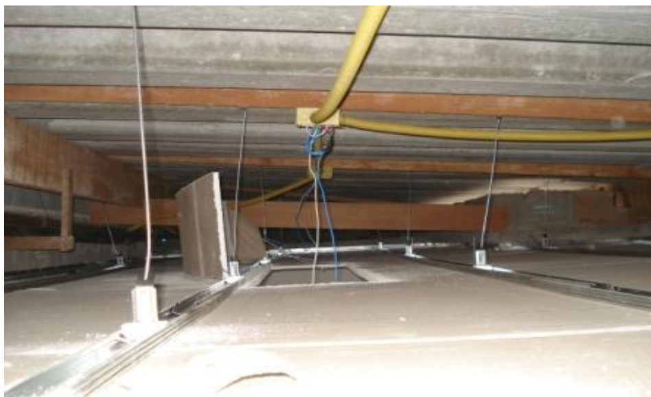
INSTALAÇÕES ELÉTRICAS REFEITAS