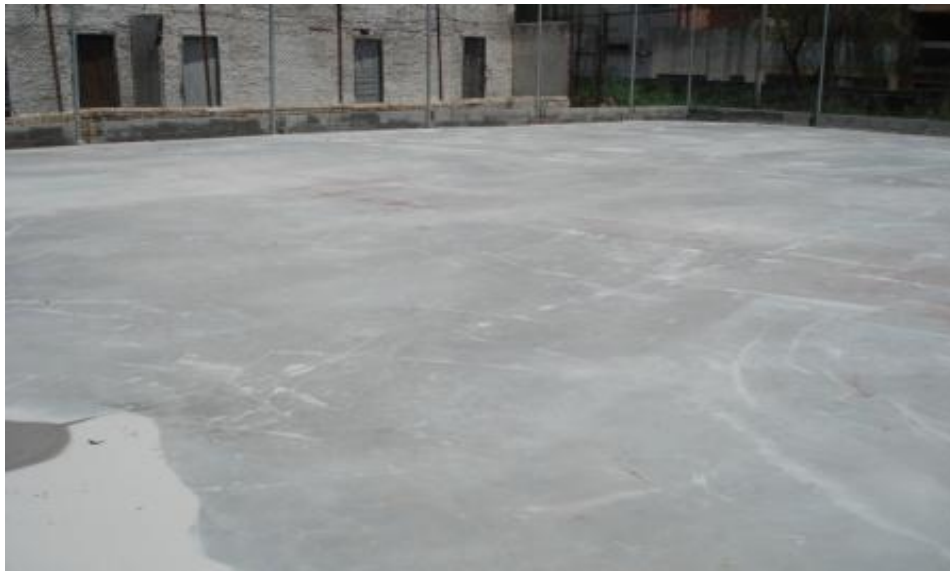
EXECUÇÃO DO PISO DA QUADRA