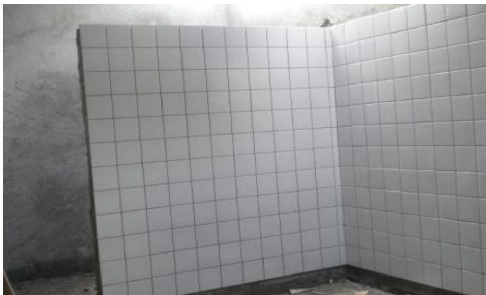
EXECUÇÃO DE REVESTIMENTO DE PAREDE