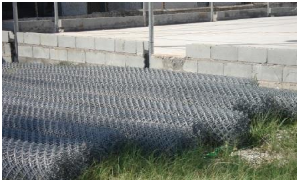
TELAS DO ALAMBRADO A SEREM INSTALADAS