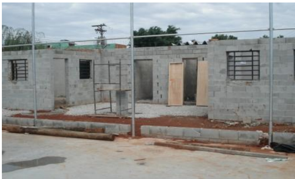
VISTA FRONTAL RECEBENDO COBERTURA