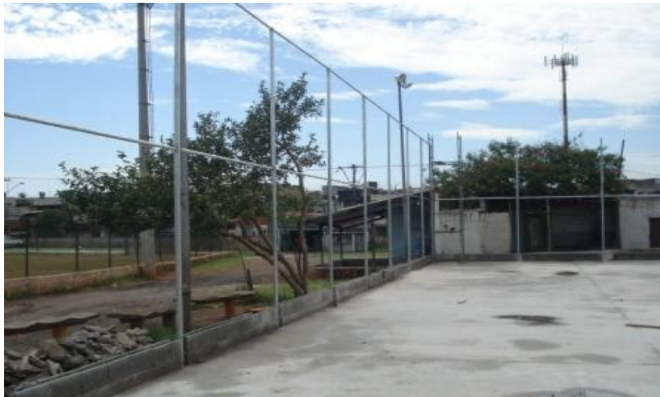
ALAMBRADO EM EXECUÇÃO