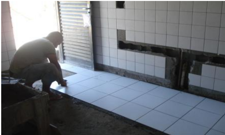
EXECUÇÃO DE REVESTIMENTOS (PISO E PAREDE)