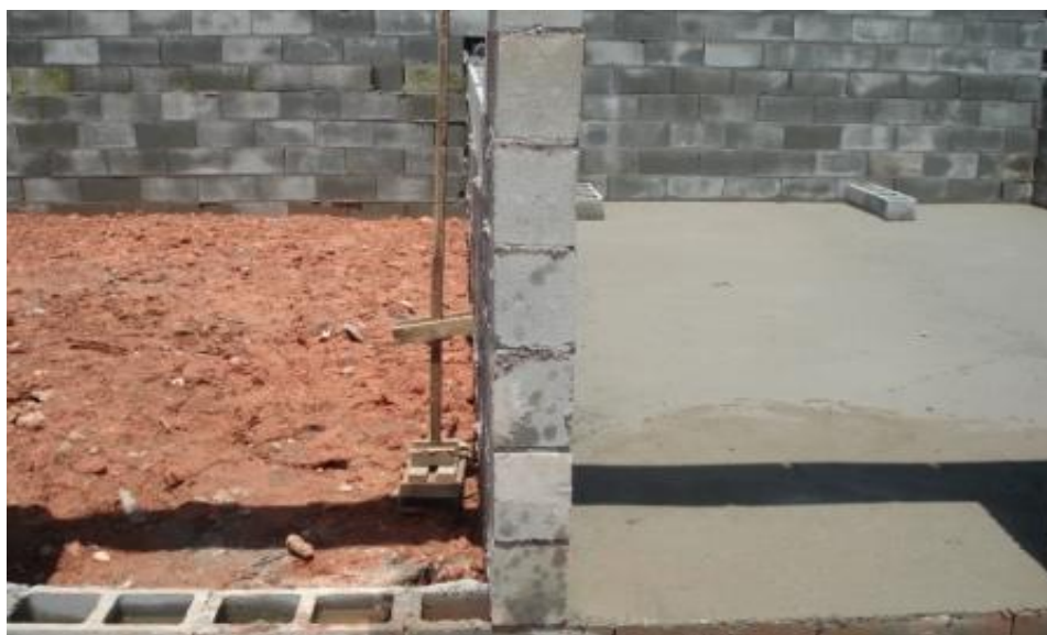
EXECUÇÃO DO CONTRAPISO