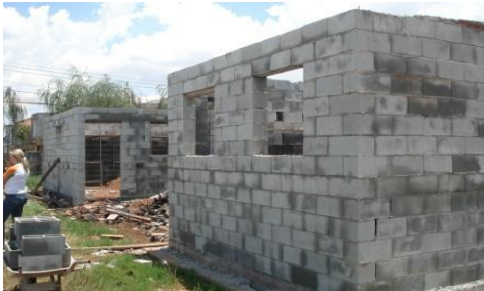
EXECUÇÃO DO ALVENARIA