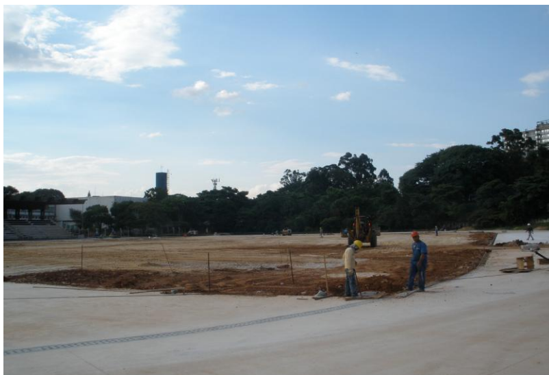
EXECUÇÃO DE NIVELAMENTO E DISTRIBUIÇÃO DA BASE DA GRAMA