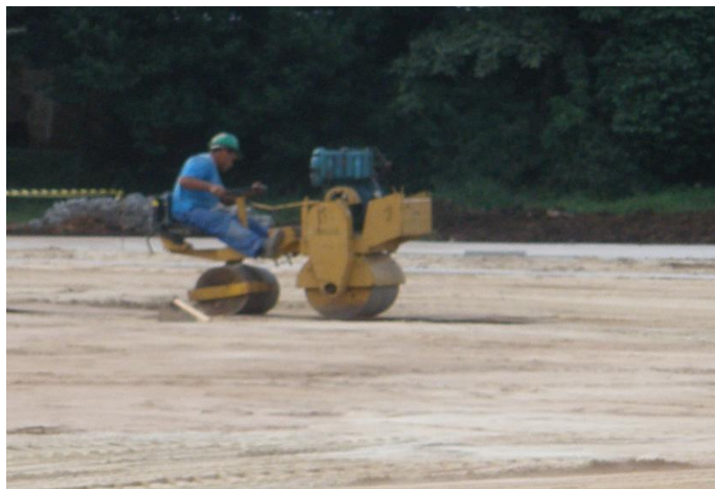
EXECUÇÃO DE NIVELAMENTO E DISTRIBUIÇÃO DA BASE DA GRAMA