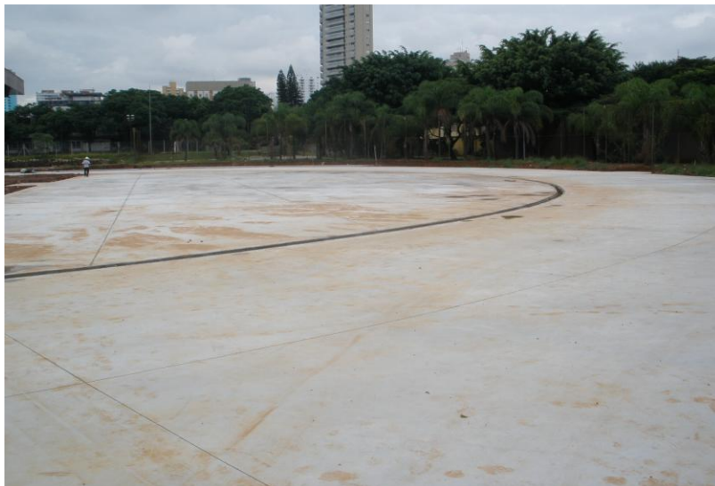
CONCRETAGEM DA PISTA