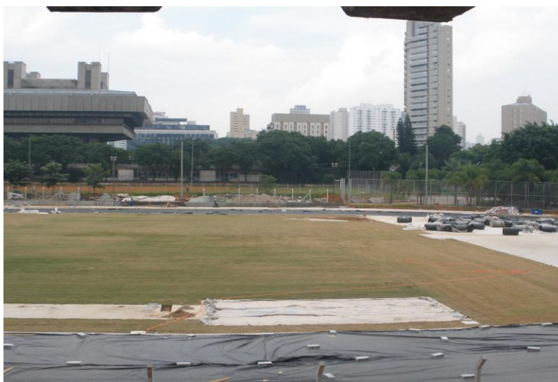
INSTALAÇÃO DE POSTES - ILUMINAÇÃO CAMPO