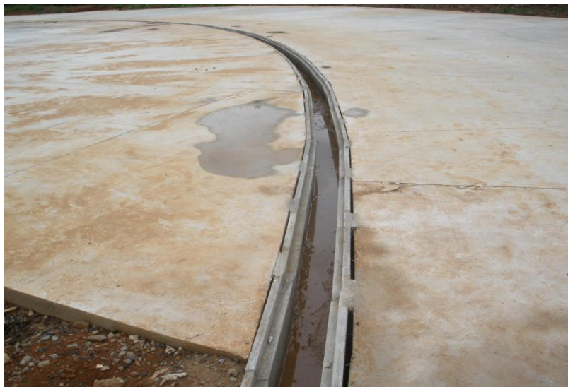
EXECUÇÃO DRENAGEM SUPERFICIAL