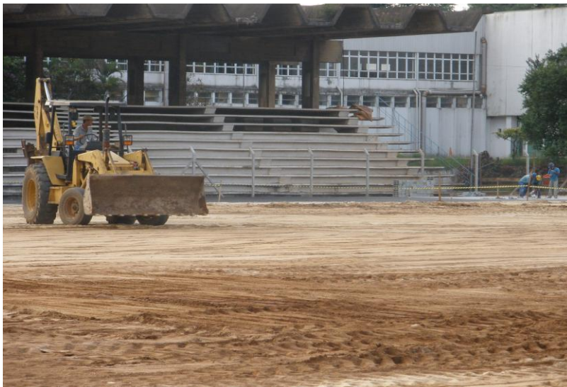
EXECUÇÃO DE NIVELAMENTO E DISTRIBUIÇÃO DA BASE DA GRAMA