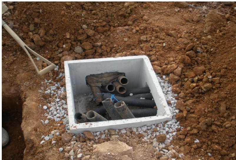
EXECUÇÃO DE TUBULAÇÃO SECA