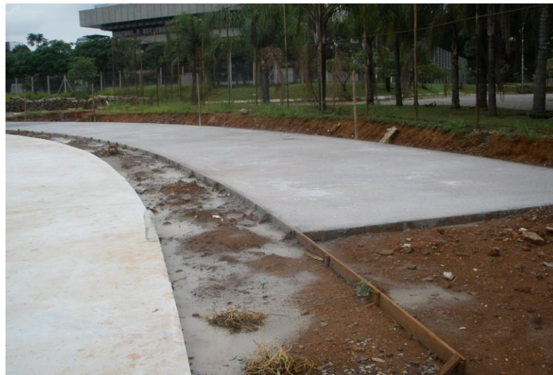
CONCRETAGEM DA PISTA