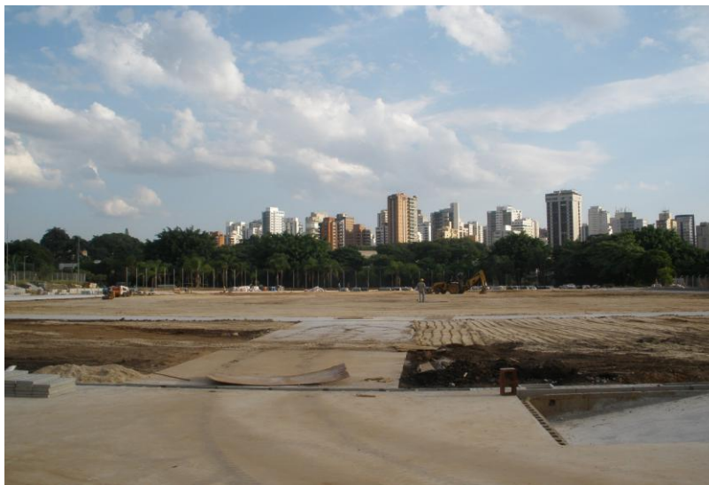
EXECUÇÃO DE NIVELAMENTO E DISTRIBUIÇÃO DA BASE DA GRAMA