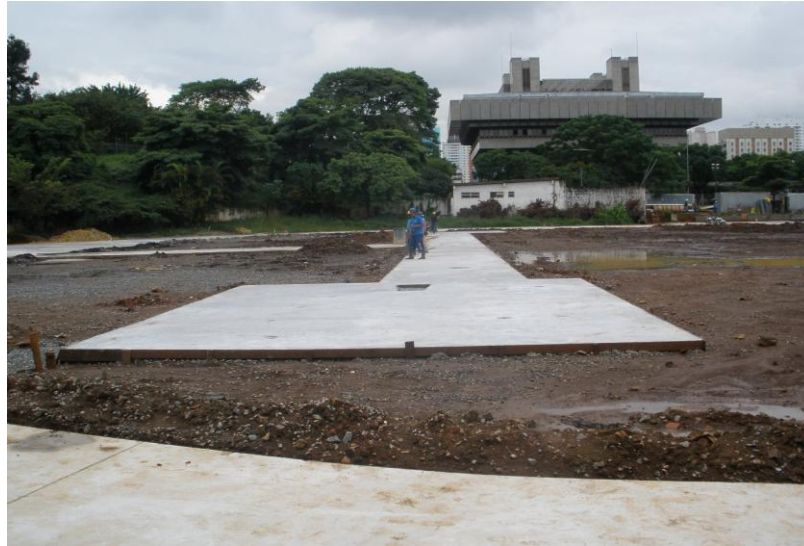
EXECUÇÃO CAIXA DE SALTO