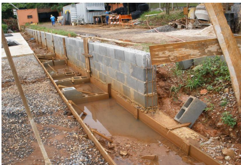
EXECUÇÃO MURO DE CONTENÇÃO E ALAMBRADO