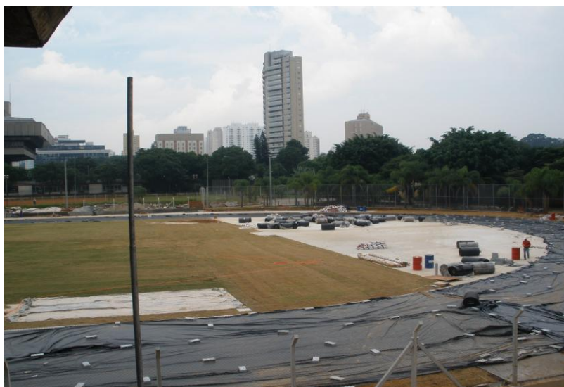
APLICAÇÃO REVESTIMENTO PISTA