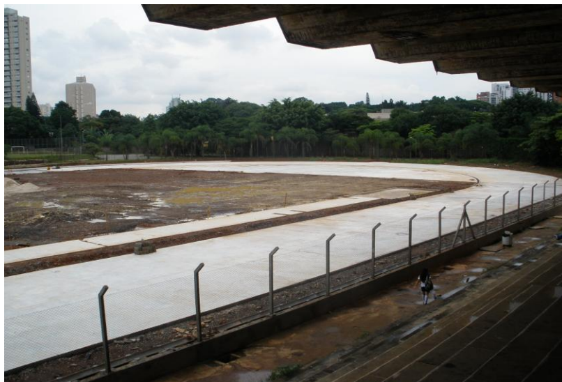
CONCRETAGEM DA PISTA