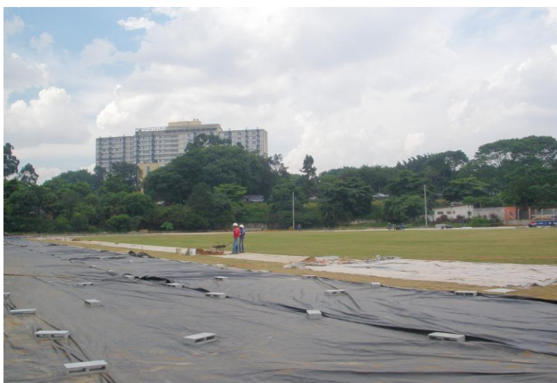
INSTALAÇÃO DE POSTES - ILUMINAÇÃO CAMPO