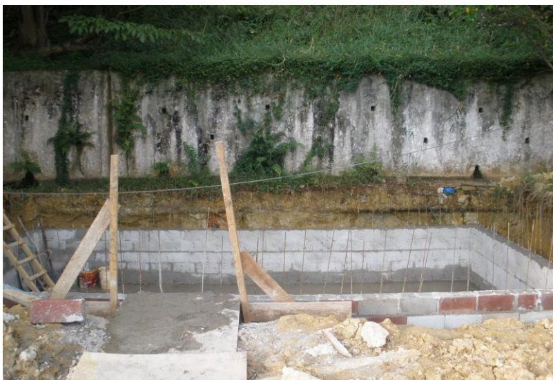
EXECUÇÃO DE RESERVATÓRIO