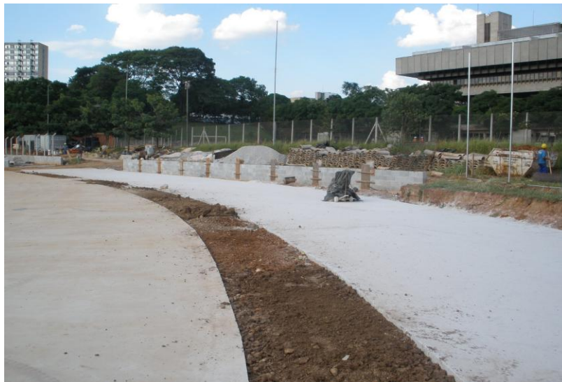
EXECUÇÃO MURO DE CONTENÇÃO E ALAMBRADO