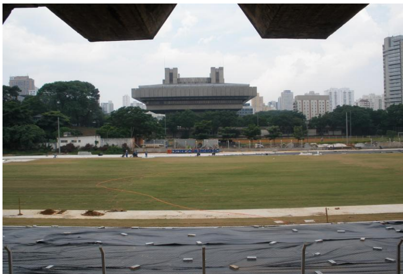
APLICAÇÃO REVESTIMENTO PISTA