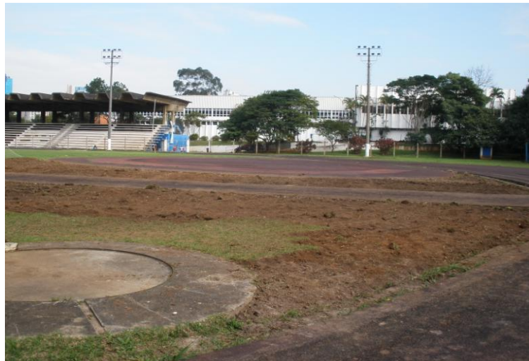
DEMOLIÇÃO PISTA E GRAMADO