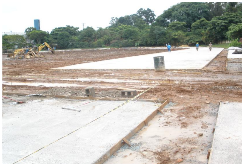
CONCRETAGEM DA PISTA