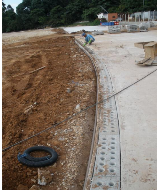
EXECUÇÃO DRENAGEM SUPERFICIAL