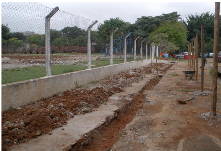
EXECUÇÃO NOVO ALAMBRADO