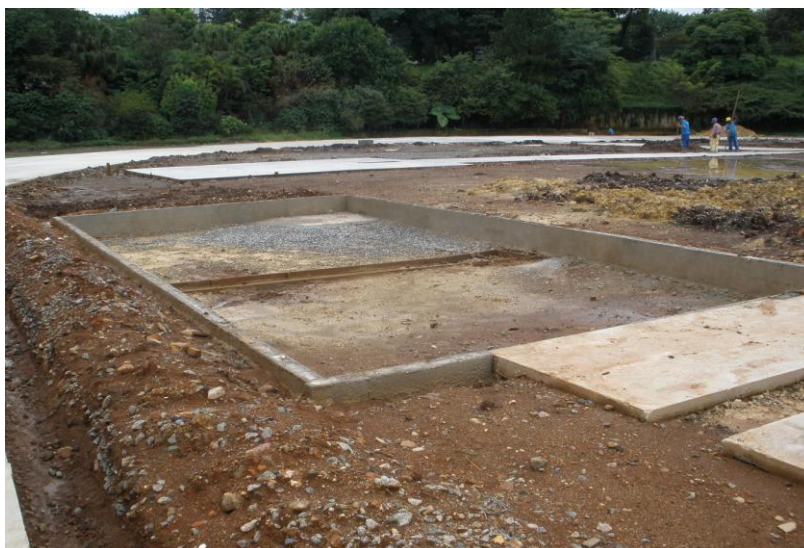
EXECUÇÃO CAIXA DE SALTO