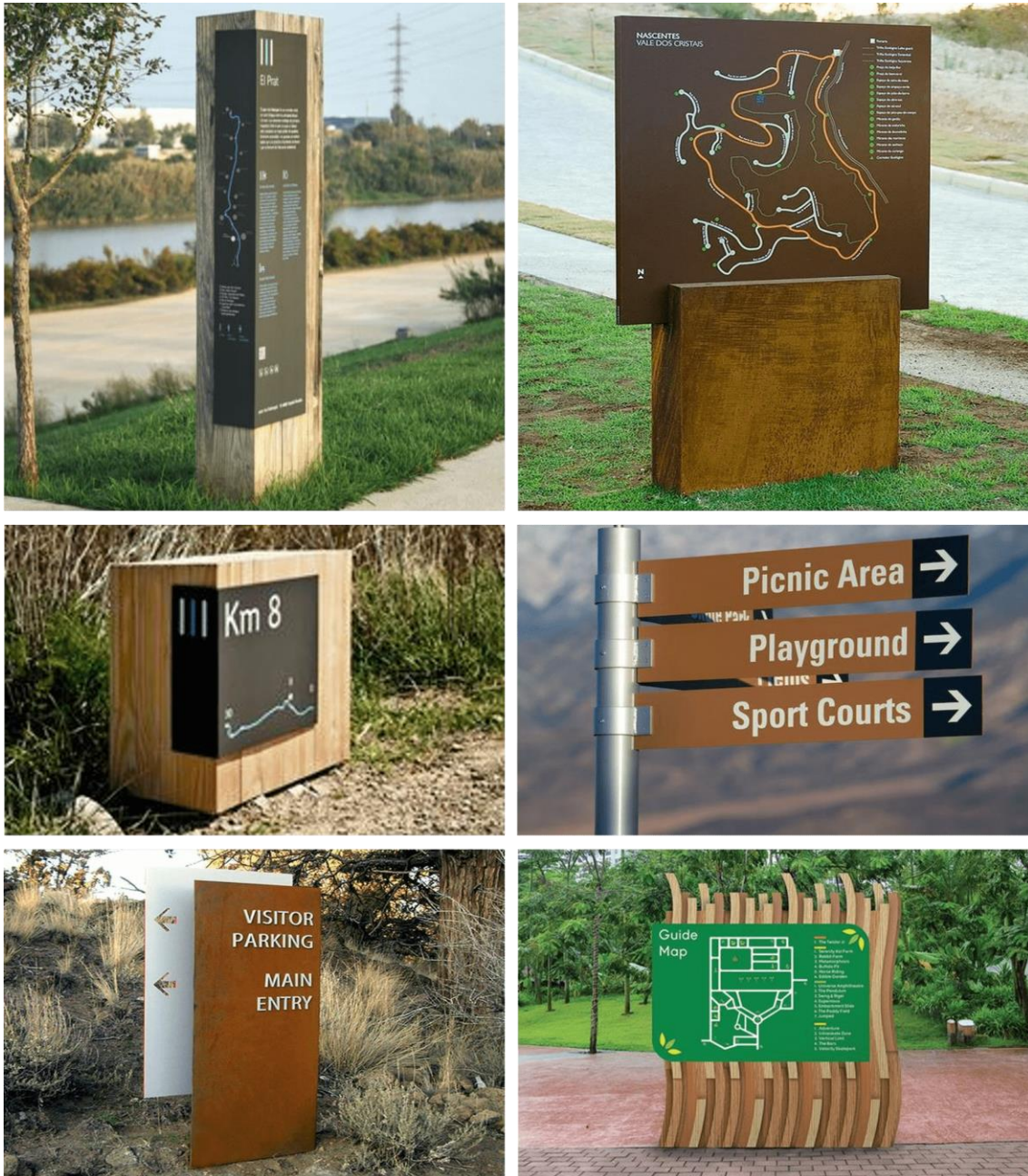
Figura 6 – Referências de sinalização indicativa