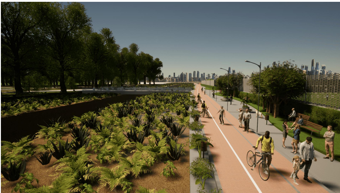
Figura 11 – Vista da pista de corrida na área do CENTRO DE CONVIVÊNCIA e Córrego Tenente Rocha

b) 1 (uma) pista de corrida de 2.000 m (dois mil metros) de extensão e área de 4.089 m 2 (quatro mil e oitenta e nove metros quadrados).