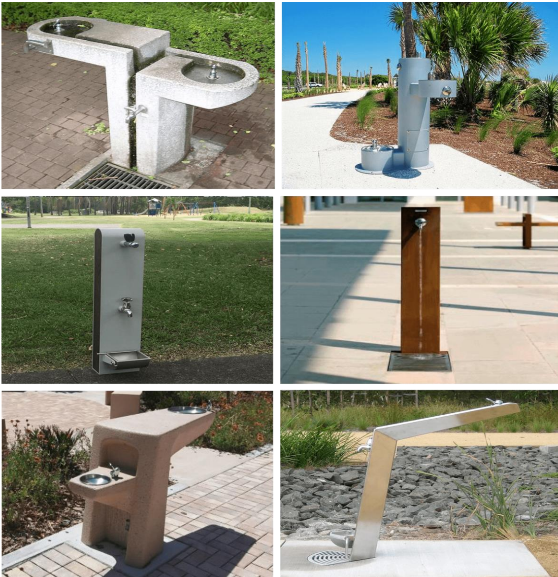
Figura 3 – Referências de bebedouros