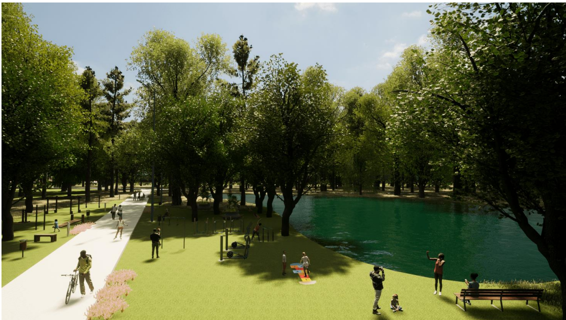
Figura 10 – Vista da área de projeto referente ao NÚCLEO DE PRESERVAÇÃO