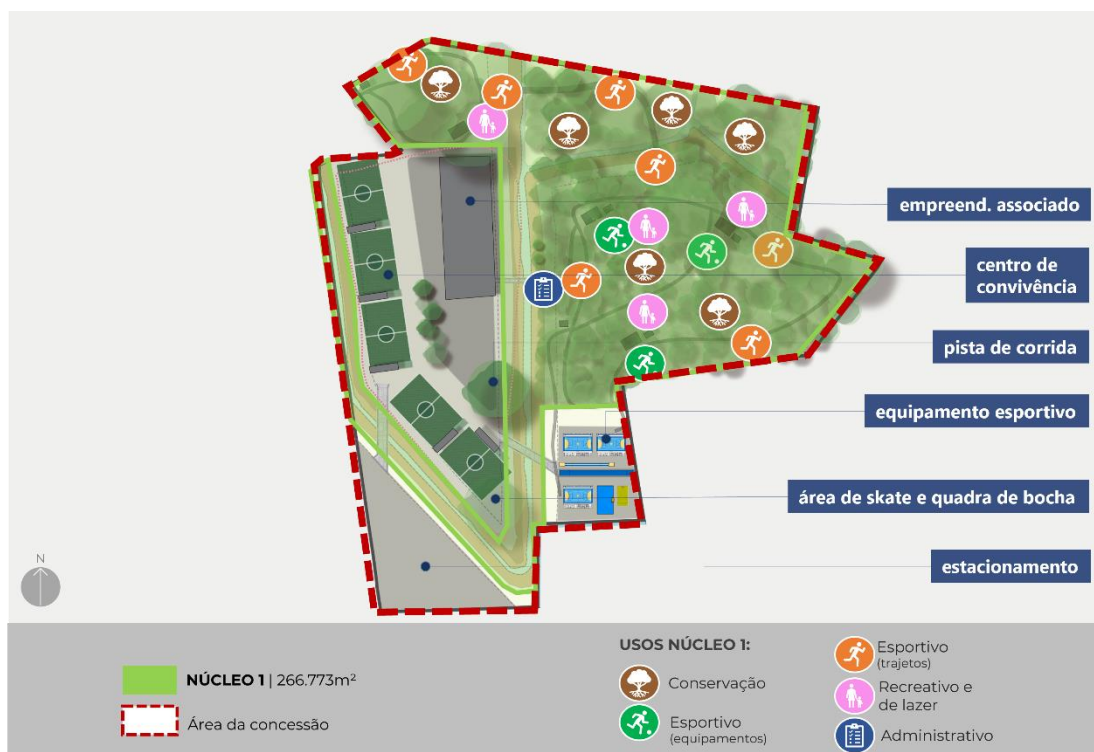
Figura 9 – Plano de Ocupação Referencial com destaque para o NÚCLEO 1

e) uso administrativo, caracterizado por um edifício de administração, o qual conterà (e.1.) 1 (uma) sala de administração, de 200 m 2 (duzentos metros quadrados); (e.2.) 3 (três) salas conjuntas à administração, totalizando 225 m 2 (duzentos e vinte e cinco metros quadrados), destinadas a setores de segurança, manejo do NÚCLEO DE PRESERVAÇÃO e utilização multiuso; (e.3.) 1 (um) vestiário, contendo 50 m 2 (cinquenta metros quadrados); (e.4.) 1 (um) sanitário para funcionários, com 70 m 2 (setenta metros quadrados); (e.5.) 1 (uma) cozinha com copa para funcionários, totalizando 150 m 2 (cento e cinquenta metros quadrados); 1 (um) ambulatório de 56 m 2 (cinquenta e seis metros quadrados), e 4 (quatro) guaritas, sendo 1 (uma) guarita edificada de 15 m 2 (quinze metros quadrados), e 3 (três) guaritas edificadas ou móveis de 3 m 2 (três metros quadrados) cada.