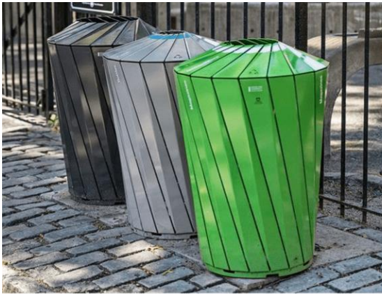
Figura 4 – Referências de lixeiras