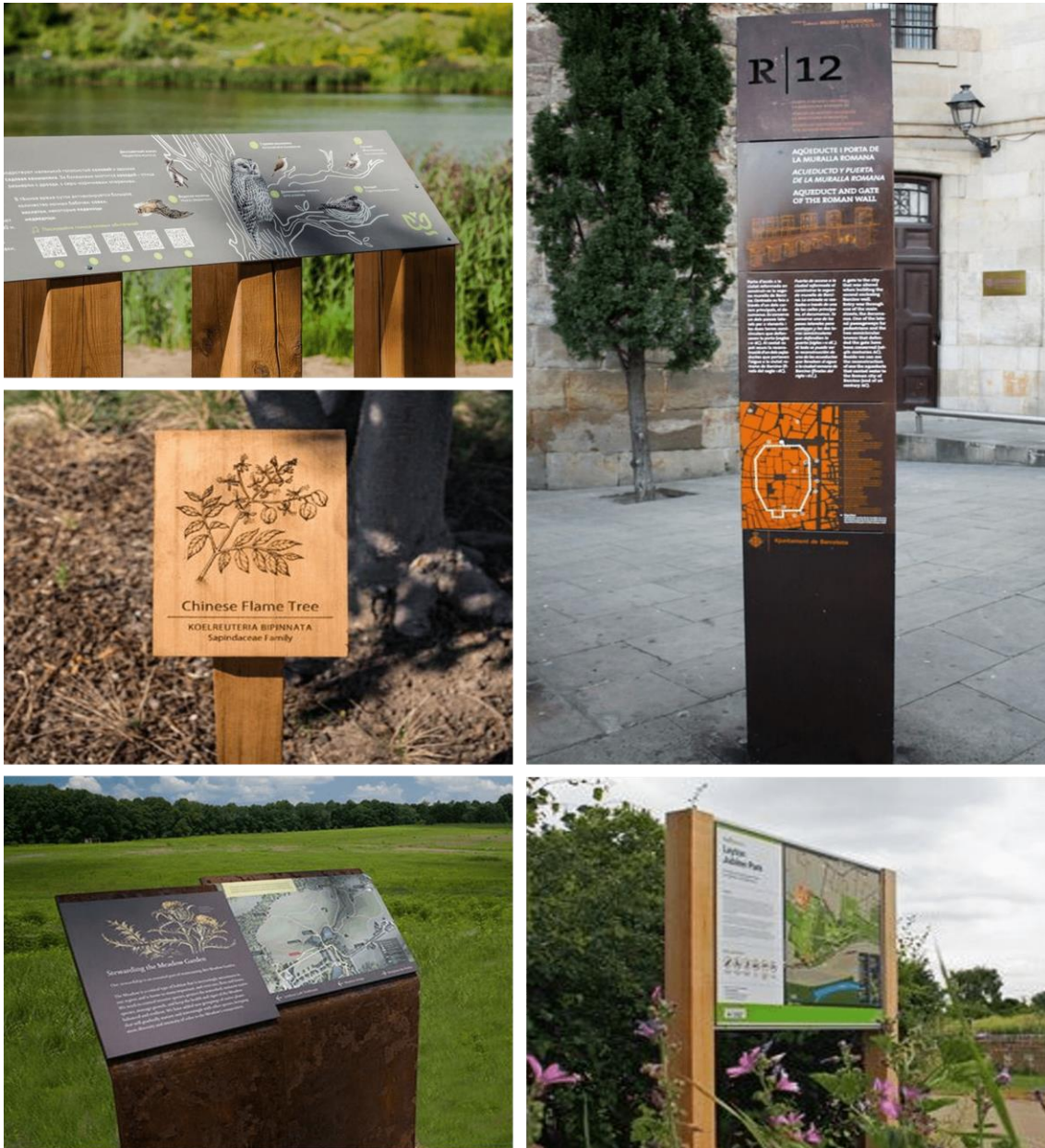
Figura 7 – Referências de sinalização educativa

Fonte: behance.net, morguefiles.tumblr.com, erinellis.com, geckogroup.com e externalworksindex.co.uk. Acesso: 26/02/2022.