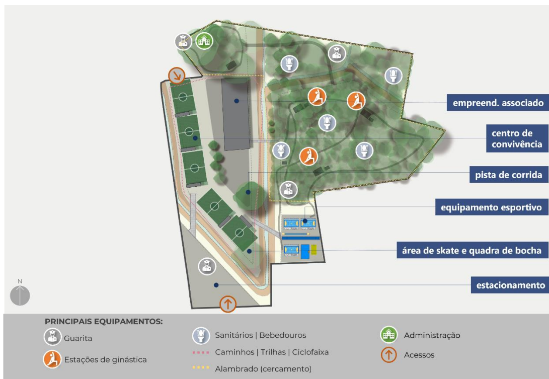
Figura 8 – Plano de Ocupação Referencial da ÁREA DA CONCESSÃO

5.1. O Plano de Ocupação Referencial segue a disposição dos equipamentos conforme figura e descrições a seguir.