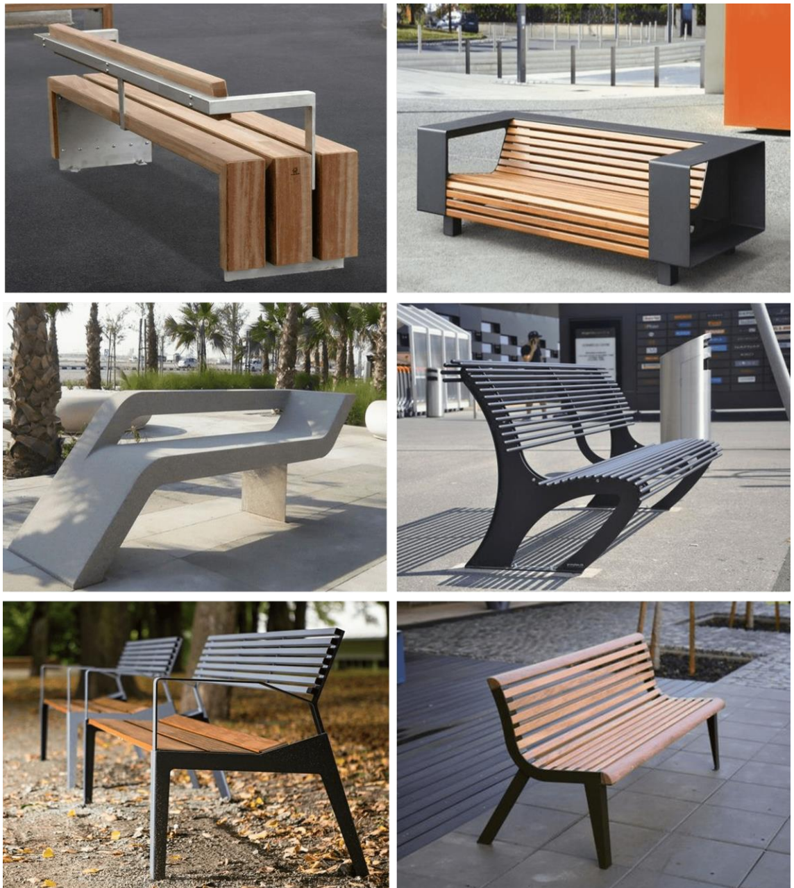
Figura 5 – Referências de bancos