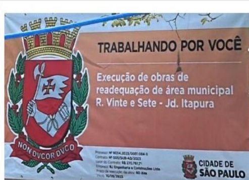
PLACA DA OBRA