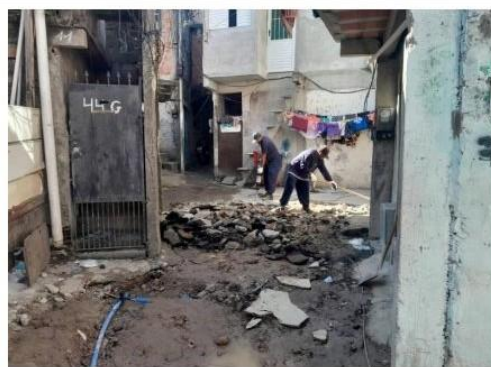
DEMOLIÇÃO DE PISO DE CONCRETO