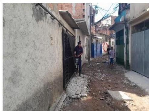
DEMOLIÇÃO DE PISO DE CONCRETO