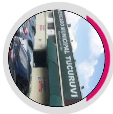
01 Mercado Municipal