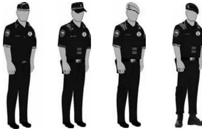
Composição dos uniformes - masculino e feminino - com camisa tipo pólo azul marinho (pantone 194010 TC)