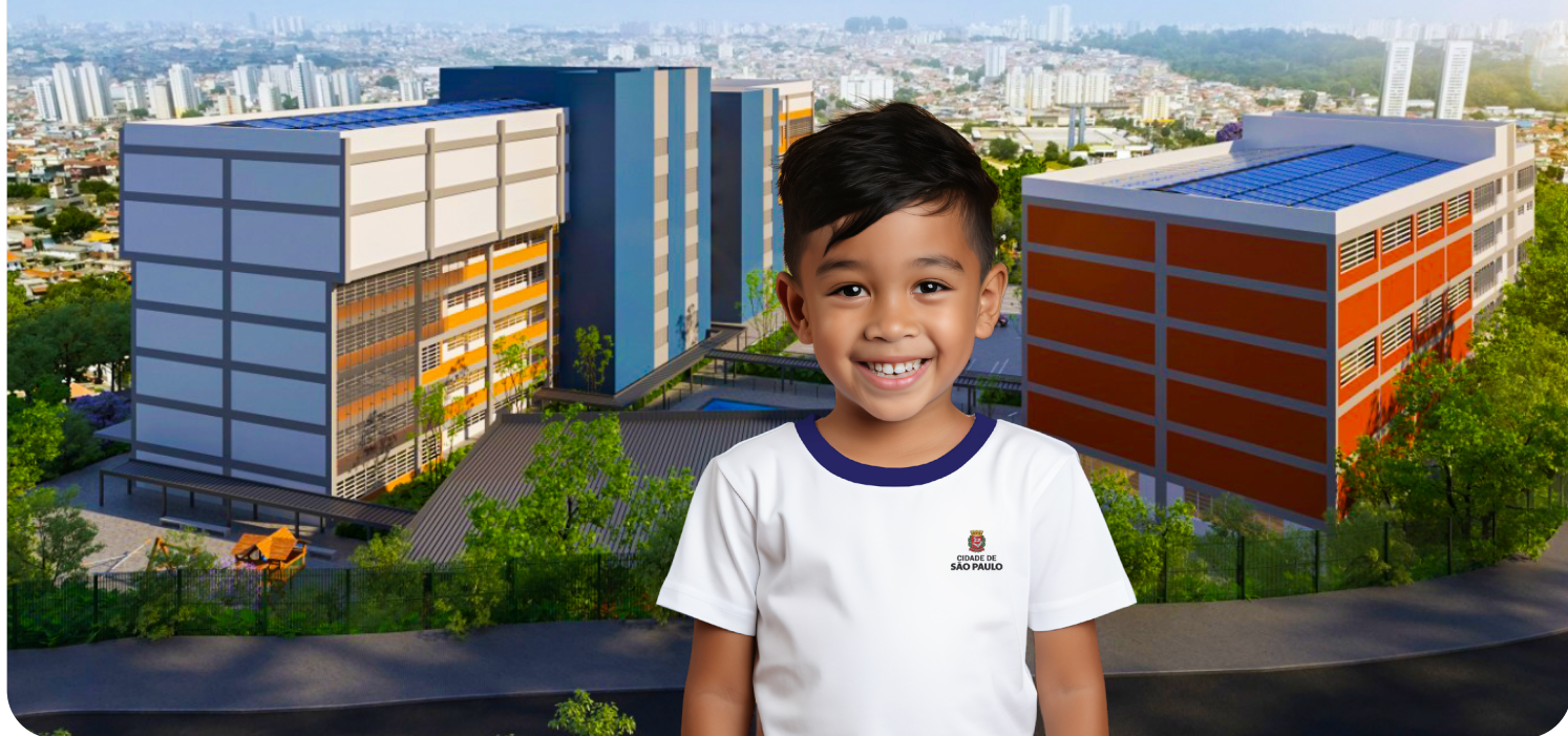
IMAGEM DE PROJEÇÃO

O CEU Cidade Líder está sendo construído para abrigar uma escola de ensino fundamental e uma universidade com cursos de administração, engenharia e pedagogia. Além disso, biblioteca, espaço de trabalho cooperativo, cineteatro, parquinho infantil, quadras poliesportivas e piscina semiolímpica também farão parte da estrutura que terá capacidade para atender até 7 mil pessoas por dia. A unidade ficará na rua Oanani, 420, no Jardim Santa Maria e a entrega será no ano que vem.