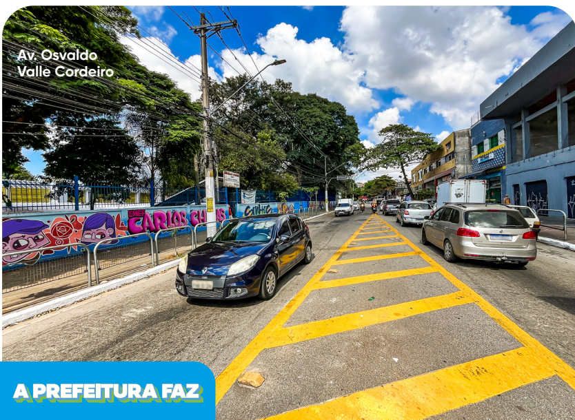
Av. Osvaldo Valle Cordeiro

A Prefeitura realiza os trabalhos de drenagem na Comunidade Labirinto, no bairro A.E Carvalho, para acabar com os problemas de alagamentos. Além disso, estão sendo pavimentadas as ruas Pascoal Alves, Joana D'arc, Campos e Monte Belo. As obras serão concluídas em julho.