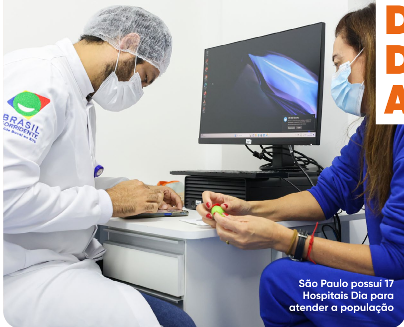
São Paulo possui 17 Hospitais Dia para atender a população

O Hospital Dia passou por ampliação e agora possui mais de dois mil metros para realizar mais de 11 mil procedimentos por mês, entre consultas, exames e cirurgias. Agora o local também traz mais conforto e melhor acessibilidade para pacientes e acompanhantes. Entre as especialidades encontradas, estão: cirurgias, ortopedia, urologia, mastologia e biopsia.