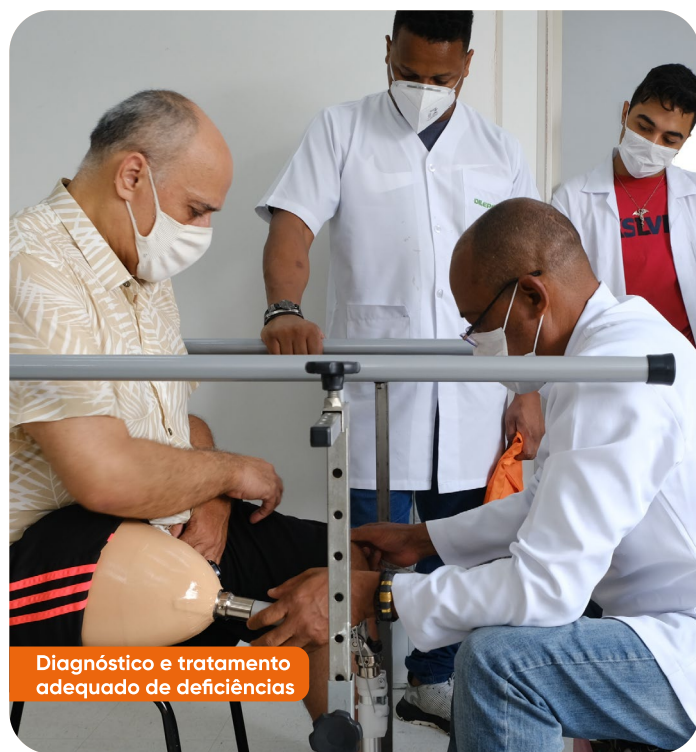
Diagnóstico e tratamento adequado de deficiências