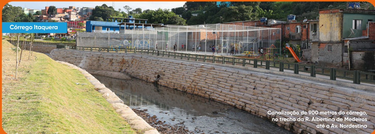
Canalização de 900 metros do córrego, no trecho da R. Albertina de Medeiros até a Av. Nordestina

Trazendo mais segurança e qualidade de vida a todos os moradores da região, além da valorização dos bairros, obras essenciais ligadas aos córregos estão em andamento. O córrego Lapenna passa pela canalização dos seus 929 metros, entre a R. Serra do Salitre e a Av. Jacu-Pêssego, além da construção de um reservatório com capacidade para armazenar até 33,3 mil m 2 de água. Já as obras do córrego Itaquera também contemplam recomposição das margens e paisagismo no entorno do canal.