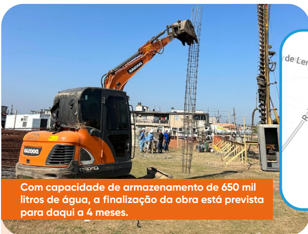
Com capacidade de armazenamento de 650 mil litros de água, a finalização da obra está prevista para daqui a 4 meses.

Trazendo mais segurança e qualidade de vida a todos os moradores da região, além da valorização dos bairros, obras essenciais ligadas aos córregos estão em andamento. O córrego Lapenna passa pela canalização dos seus 929 metros, entre a R. Serra do Salitre e a Av. Jacu-Pêssego, além da construção de um reservatório com capacidade para armazenar até 33,3 mil m 2 de água. Já as obras do córrego Itaquera também contemplam recomposição das margens e paisagismo no entorno do canal.