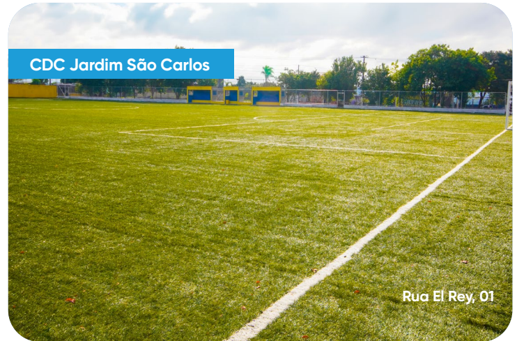
CDC Jardim São Carlos

Av. Dr. Assis Ribeiro, altura do 10.000 (altura da rua caucásica).