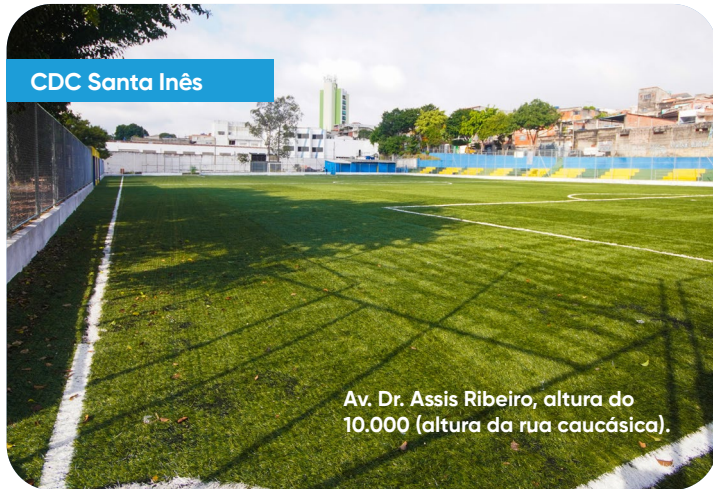
CDC Santa Inês

Investir na revitalização de espaços de esporte e lazer é uma das preocupações da Prefeitura, principalmente para incentivar os jovens a uma vivência mais saudável. Por isso, dois CDCs da sua região passaram por reformas importantes entregues este ano!