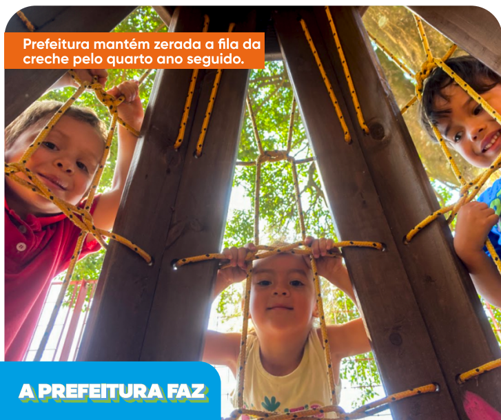
Prefeitura mantém zerada a fila da creche pelo quarto ano seguido.

A CEI Visconde de Tauna, que será inaugurada no final do mês, vai deixar as famílias mais tranquilas no trabalho sabendo que os filhos estão sendo bem cuidados. A unidade terá estrutura para 146 crianças de até 3 anos e vai contar com 8 salas, brinquedoteca e acessibilidade, na Av. Casa Grande, 566.