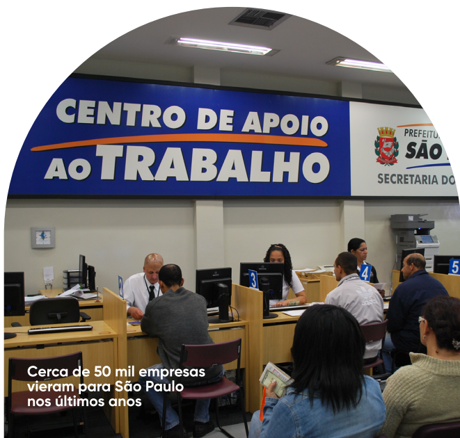
Cerca de 50 mil empresas vieram para São Paulo nos últimos anos

Avenida Sapopemba, 9064 / Telefone: 11 3357 2400