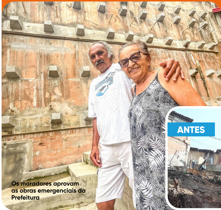
Os moradores aprovam as obras emergenciais da Prefeitura

A Prefeitura acabou com quase 50 anos de expectativa de cerca de 2 mil pessoas da Vila Renato. Um muro de concreto com estacas em um trecho de 45 metros na Viela 1, altura do nº 10, afastou eventuais riscos causados pelas chuvas. Já na travessa Manoel Blasco, altura do nº 18, uma parede de concreto vai dar estabilidade à encosta. E na Rua Luca Conforti, altura do nº 277, reparos na rede de drenagem vai agilizar a vazão das águas.