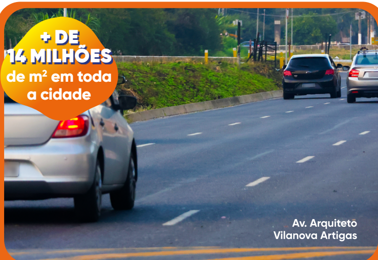
Av. Arquiteto Vilanova Artigas