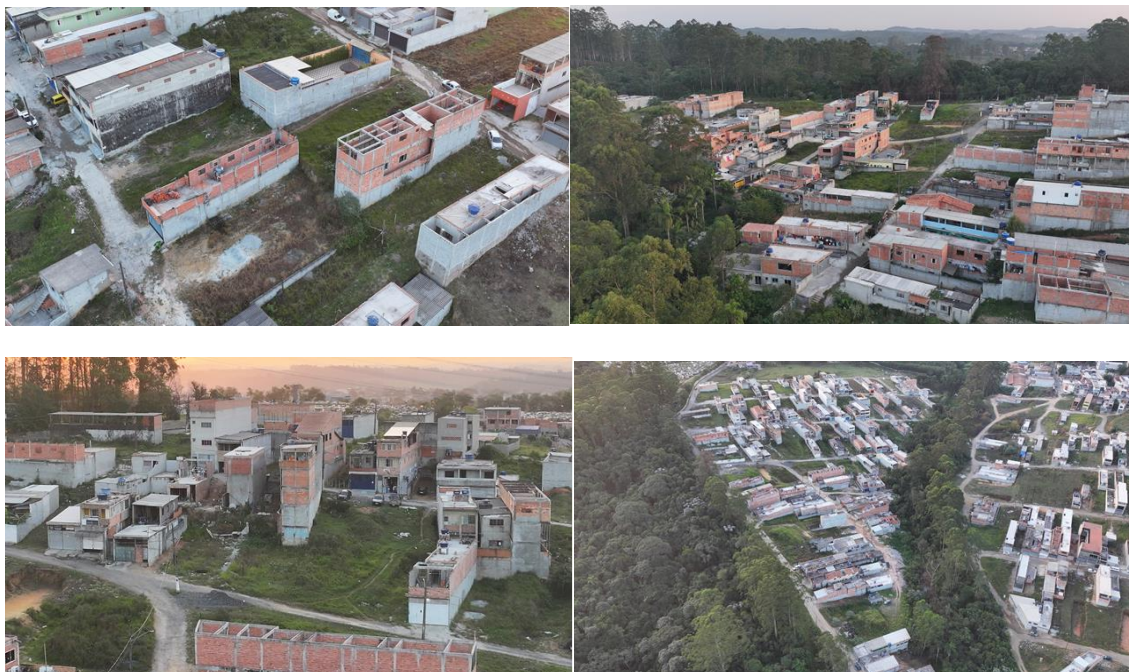
Estrada do Schmidt