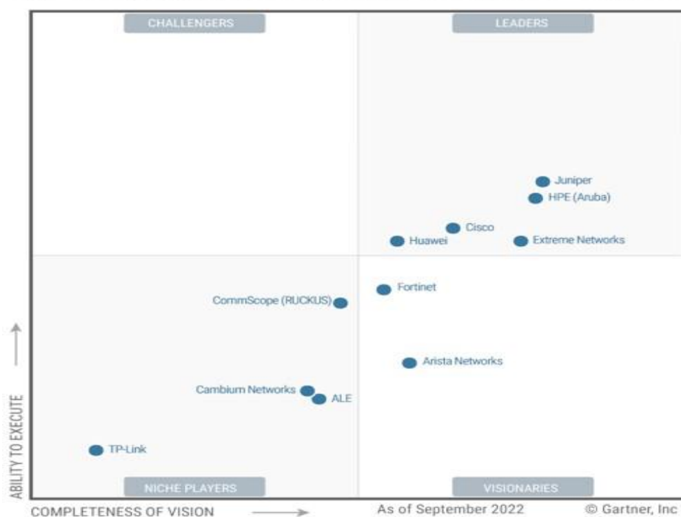
Figure 1: Magic Quadrant for Enterprise Wired and Wireless LAN Infrastructure