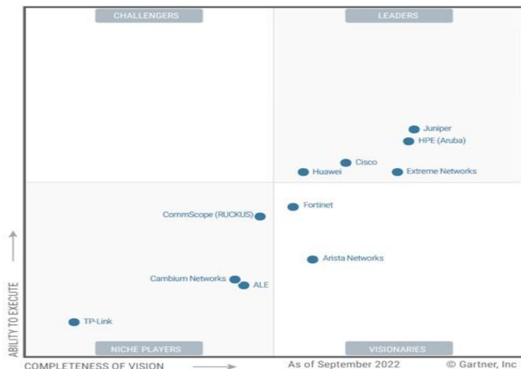
Figure 1: Magic Quadrant for Enterprise Wired and Wireless LAN Infrastructure