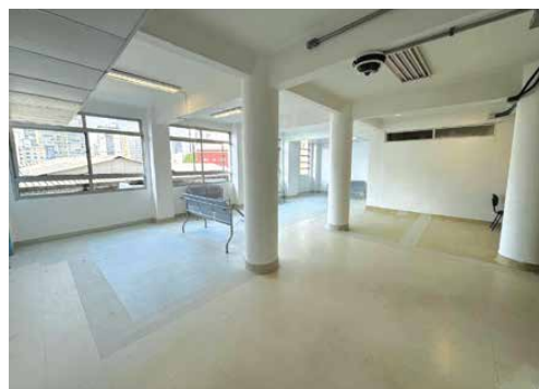
Hall do 6º andar

A fim de facilitar o acesso à informação de consultas e faltas realizadas no HSPM e nos ambulatórios descentralizados Carrão, Tucuruvi, São Miguel, Lapa e Santo Amaro, foram instalados faltômetros nas entradas das unidades. O objetivo é conscientizar os servidores que utilizam os serviços do hospital sobre a importância de cancelarem suas consultas com antecedência e, por isso, o HSPM orienta que os pacientes entrem em contato pelo telefone indicado no banner para fazerem o cancelamento, caso não possam comparecer à consulta agendada. Diga não ao absenteísmo nas consultas! Quando você falta, outra pessoa perde a oportunidade de ser atendido.