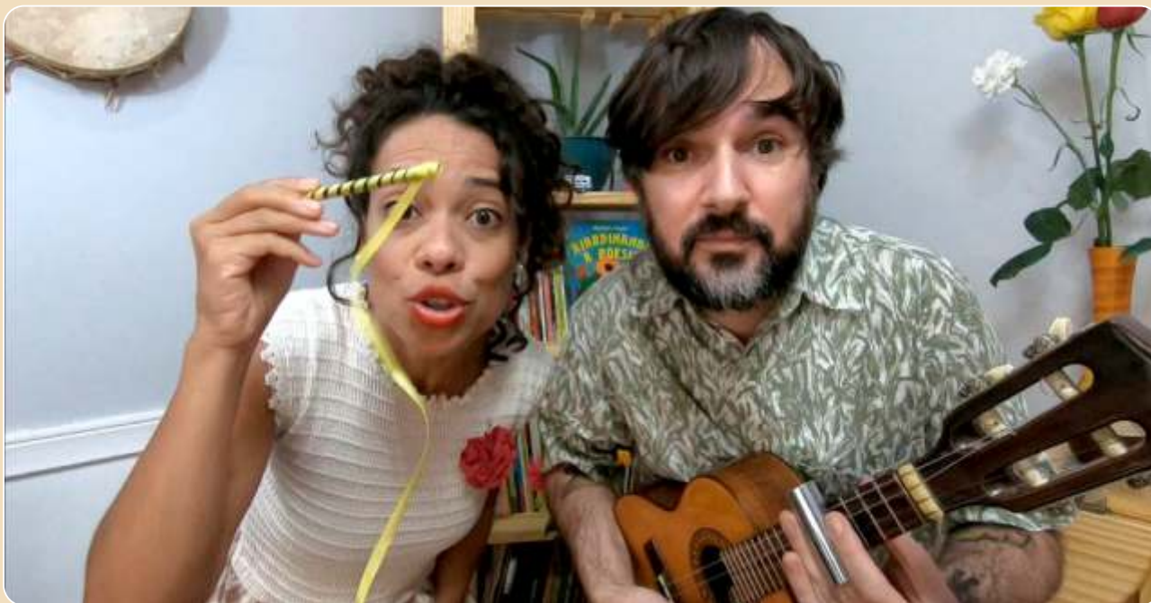
O Casulo Viajante