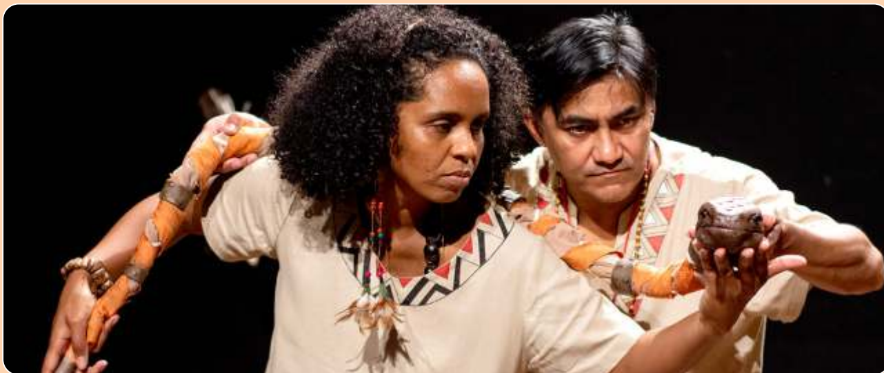
O Sucuriju e Jaguaretê Onça Mãe