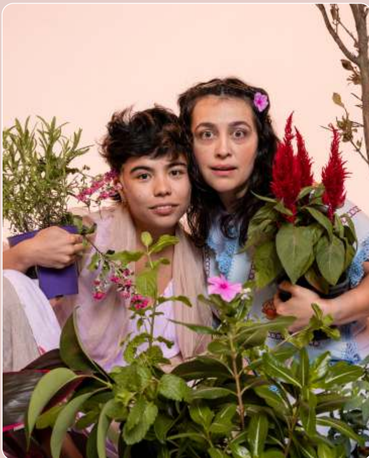
Histórias da Mata Calada