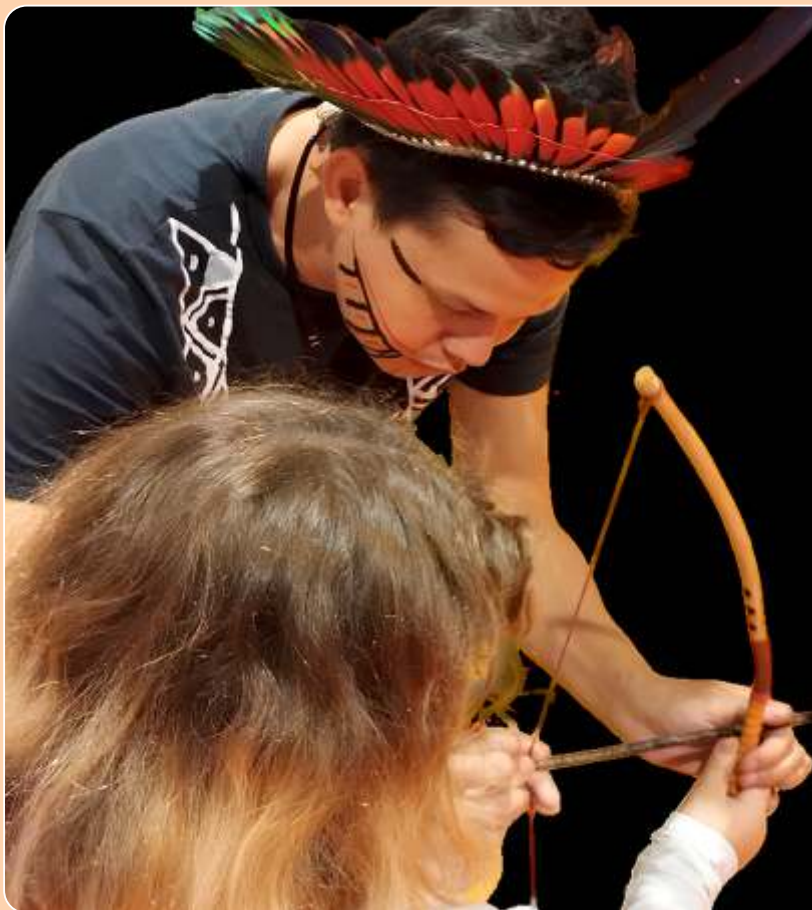
Fulni-ô – (Re)existir