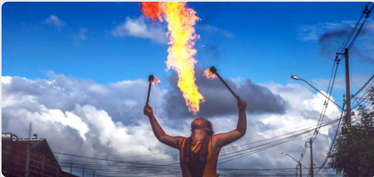
O Incrível Número Final