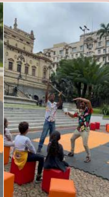
Mpatapo - histórias e brincadeiras