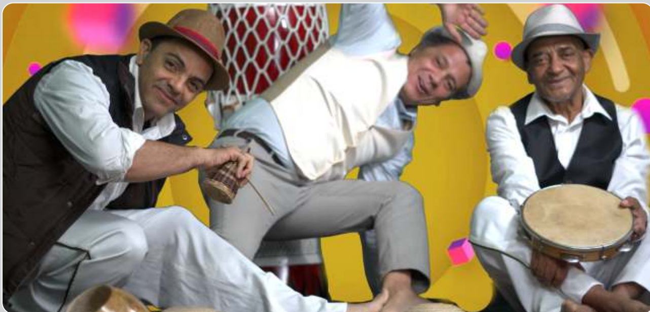
A Volta que o Mundo Deu