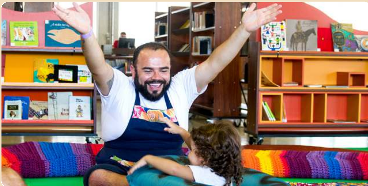
Engatinhando com as Histórias