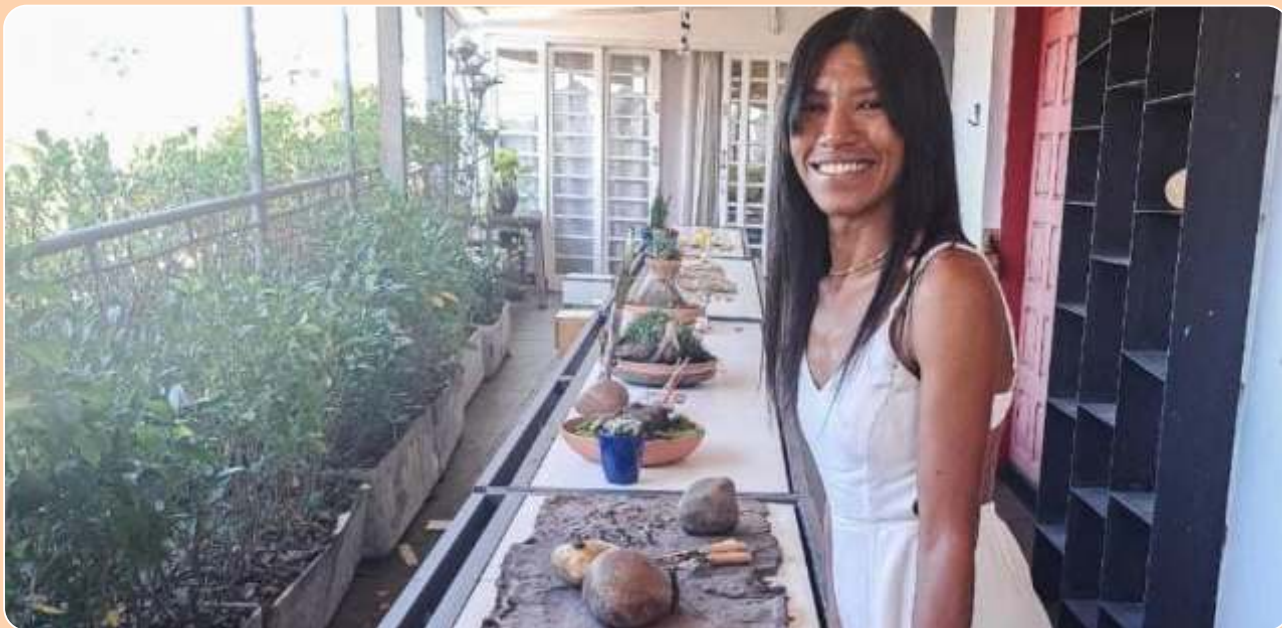
Ateliê de artes originárias