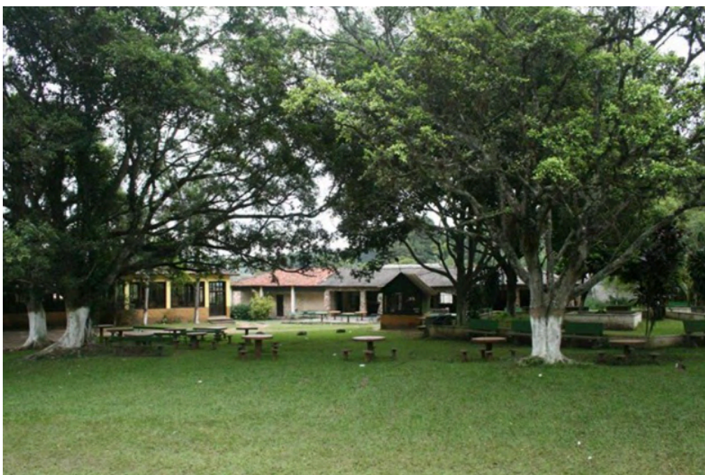
Imagem da antiga sede, na Estrada do M'Boi Mirim. Disponível em: https://memoriasdesampa.blogspot.com/2011/11/memorias-saborosas.html . Acesso em: ago. 2025.

Em 2012 a cantina mudou para a Chácara Santo Antônio, já nestes anos um bairro em desenvolvimento.