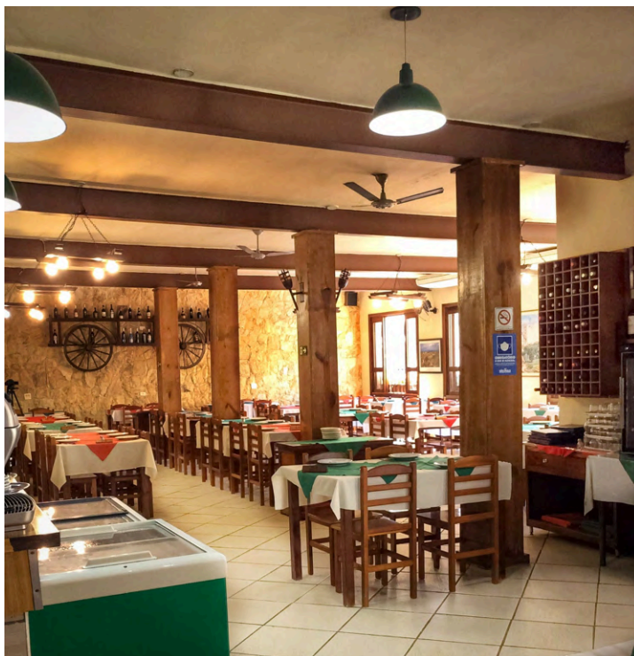
Interior do estabelecimento.