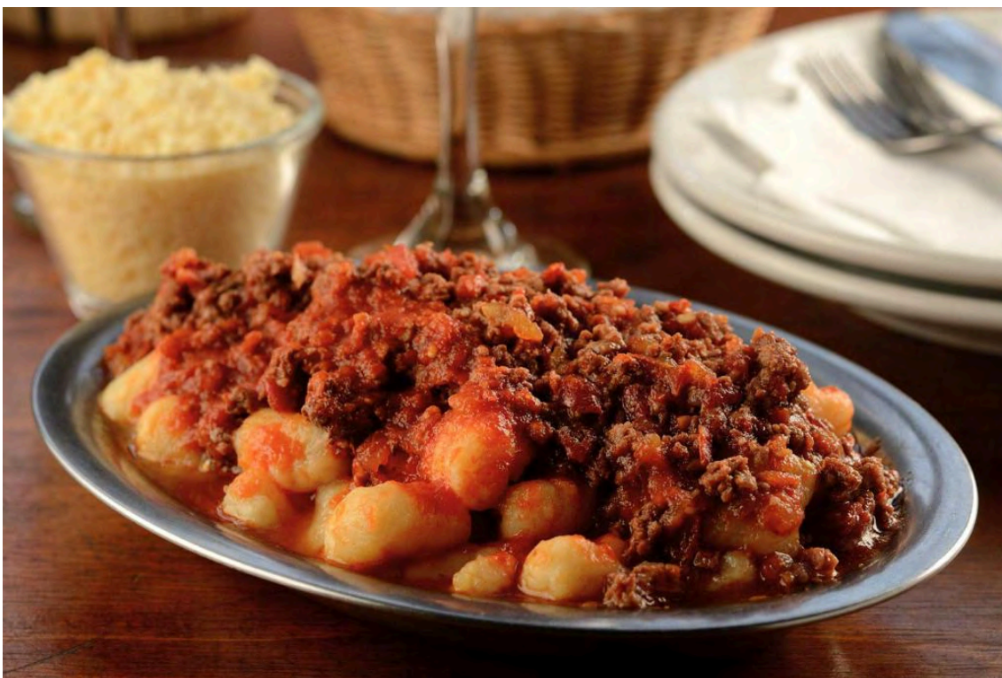
Imagem de prato da casa.