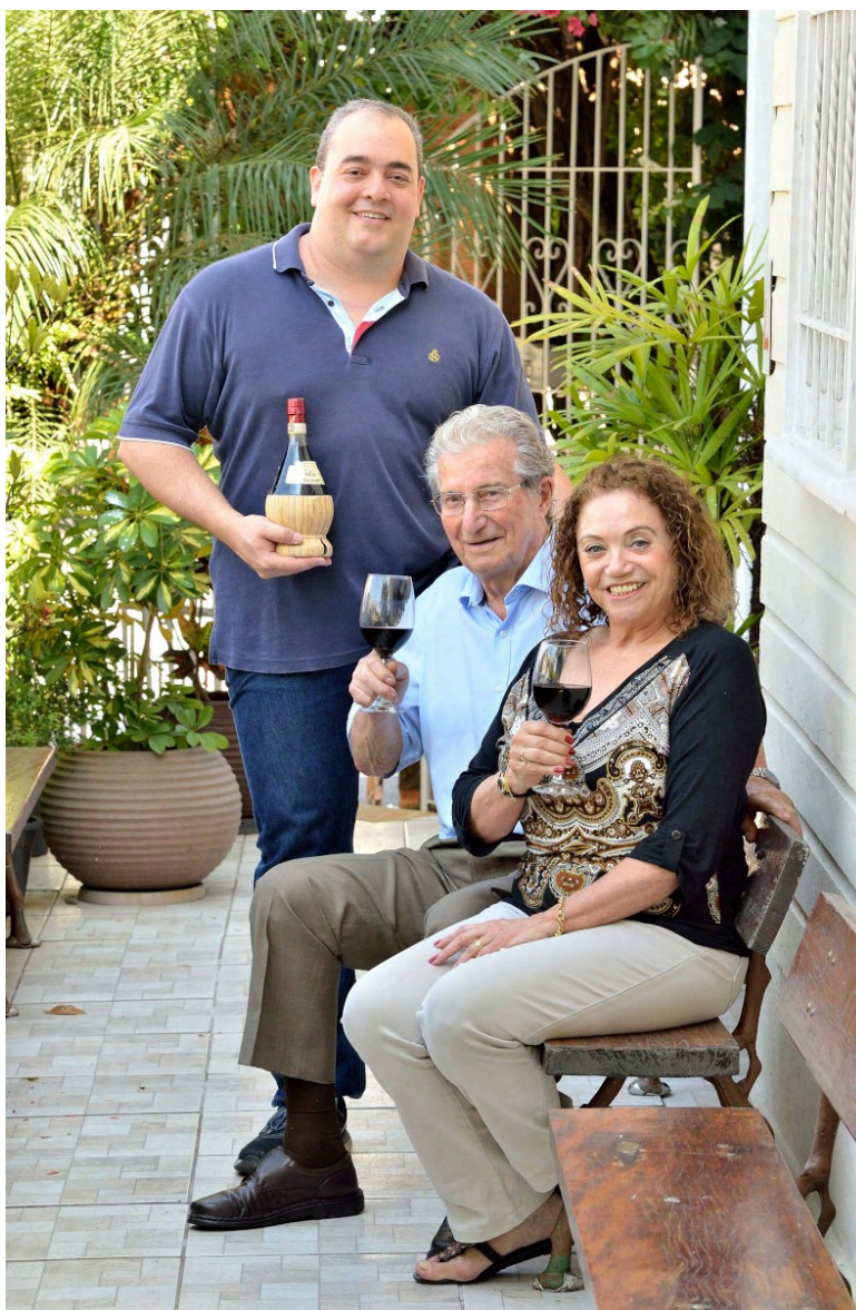
Equipe do restaurante.

Internamente, o espaço foi totalmente alterado, perdendo sua compartimentação interna. Parte do salão ocupa a antiga residência, contando com fotografias de diferentes regiões da Itália nas paredes.