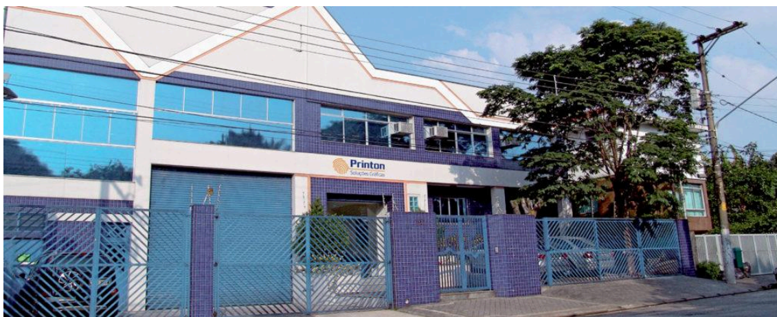
Fachada da loja Printon Soluções Gráficas. Disponível em: https://www.printongrafica.com.br/grafica-campos-novos-paulista/ . Acesso em: ago. 2025.