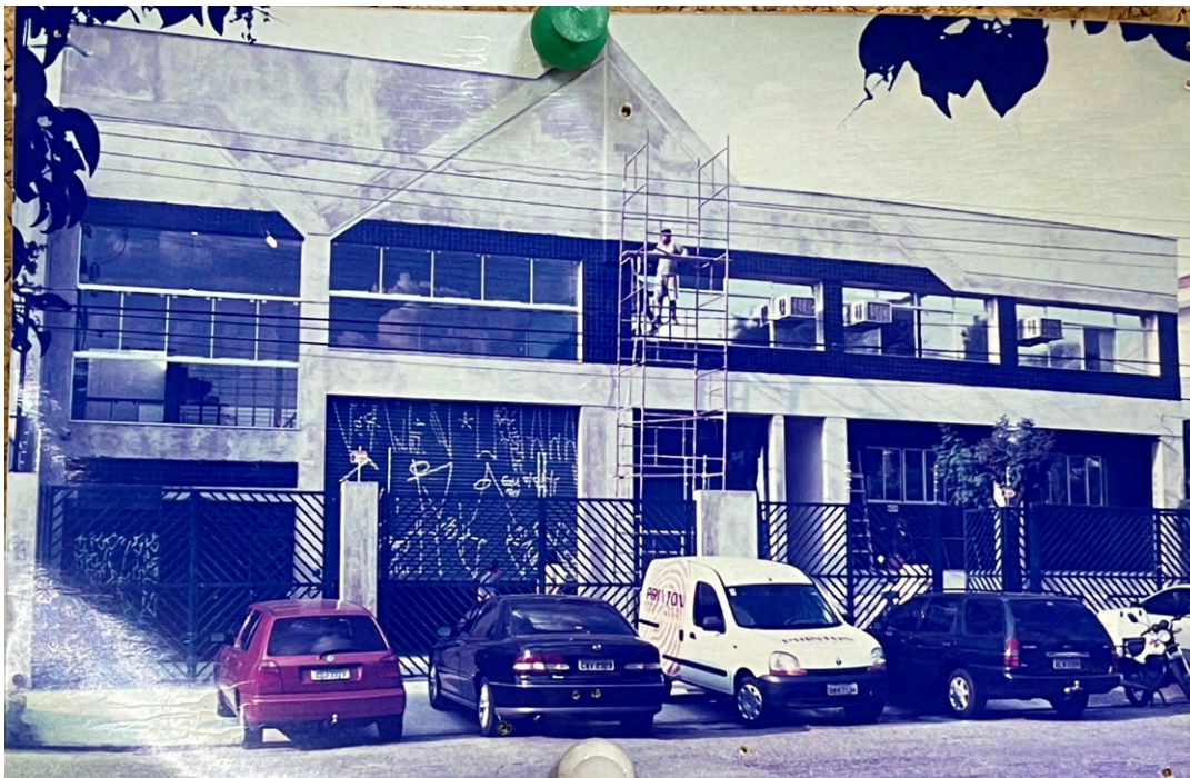
Acima, fachada do terceiro endereço e atual endereço da Printon, em junho de 1995, antes da ampliação. Abaixo, fachada da Printon após a ampliação, evidente pelo lado esquerdo da foto.