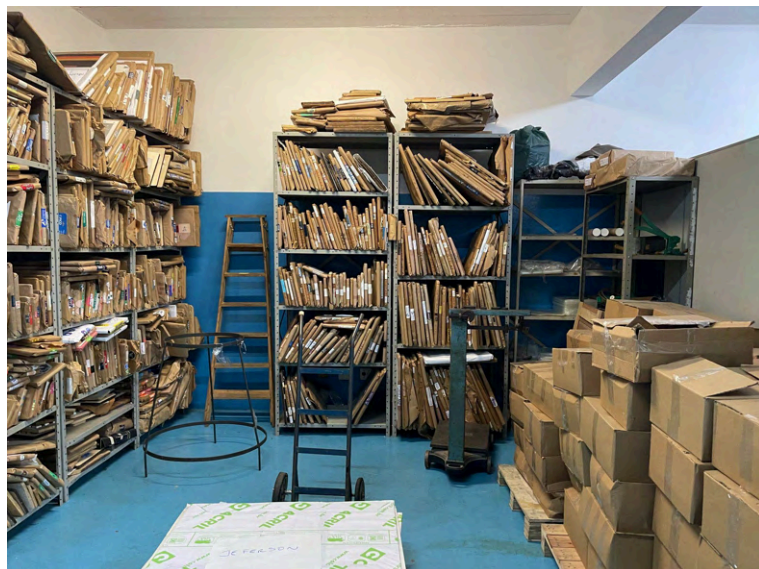
Acervo de vincos criados pela empresa, no depósito.