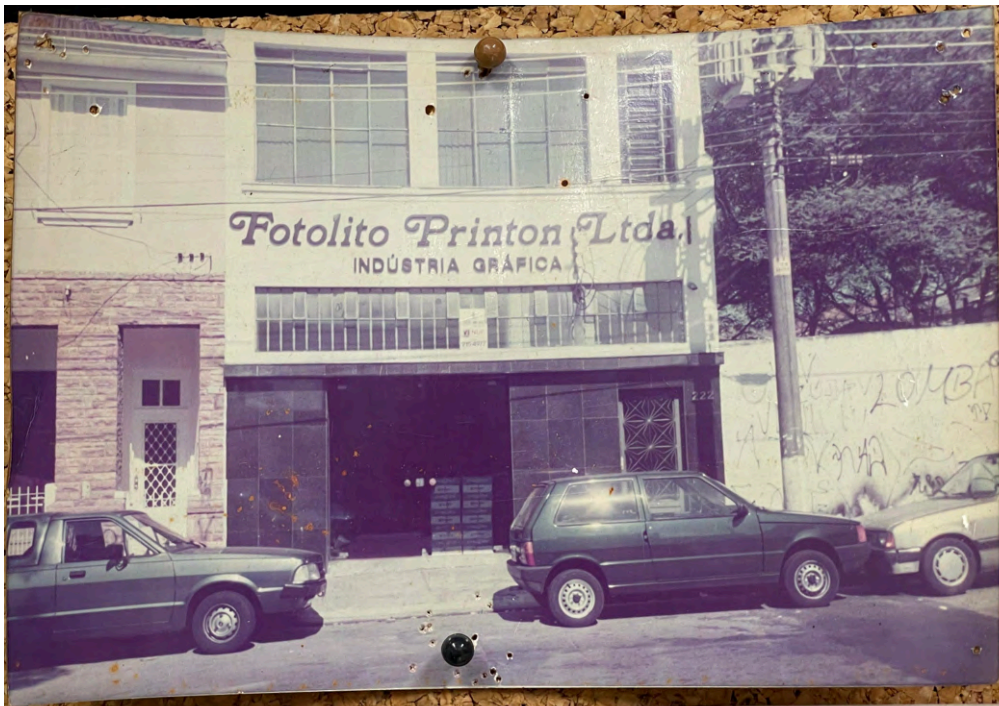
Fachada do segundo endereço da Printon Ltda, na Rua dos Campineiros.

Em 1995, uma terceira mudança ocorreu, dessa vez para o endereço atual, na Rua Secundino Domingues. Conforme a empresa aumentava de clientes e maquinário, fez-se necessário uma nova ampliação. Para tal, a empresa adquiriu as casas ao lado e atrás de seu prédio, que resultou numa ampliação de sua planta, totalizando 2.500m 2 equipados com impressoras digitais e máquinas de Verniz UV Total, Verniz UV Reserva, Laminadora, Plastificadora e Hotstamping.