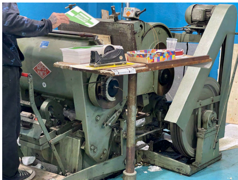
Detalhe das máquinas de vinco de embalagens.