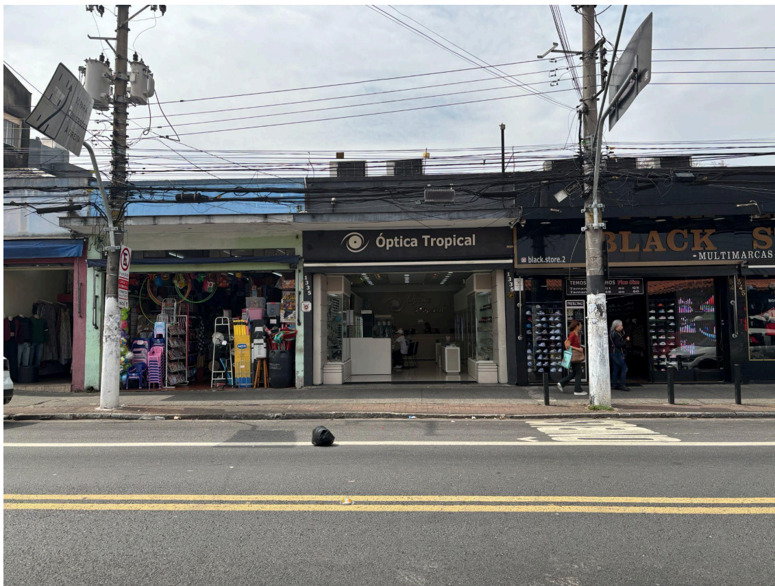
Vista da Óptica Tropical entre outros estabelecimentos comerciais na avenida Padre Arlindo Vieira. Foto: Fatima Antunes, DPH/SMC/PMSP, 09 set. 2025.