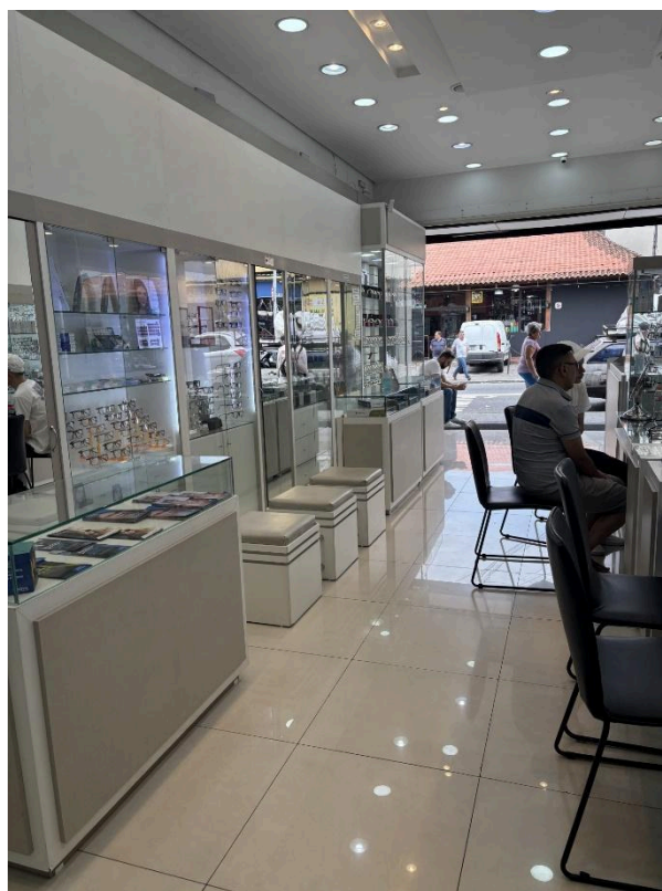
Aspectos do interior da Óptica Tropical. Fotos: Fatima Antunes, DPH/SMC/PMSP, 09 set. 2025.