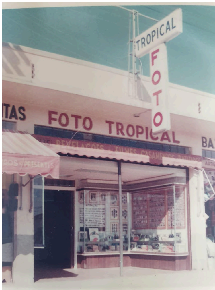
Fachada da Foto Tropical, anos 1970. No toldo, um resumo dos serviços oferecidos: “revelações de filmes, casamentos e batizados”. Imagem cedida por Sergio Miyazaki.

No novo endereço, Ryohati montou seu estúdio fotográfico. Ali mantinha cenários para fotos de casamento, primeira comunhão, etc. Outro serviço muito requisitado eram as reportagens fotográficas de casamentos e batizados, por exemplo, além das fotos 3x4 para documentos, venda e revelação de filmes fotográficos.