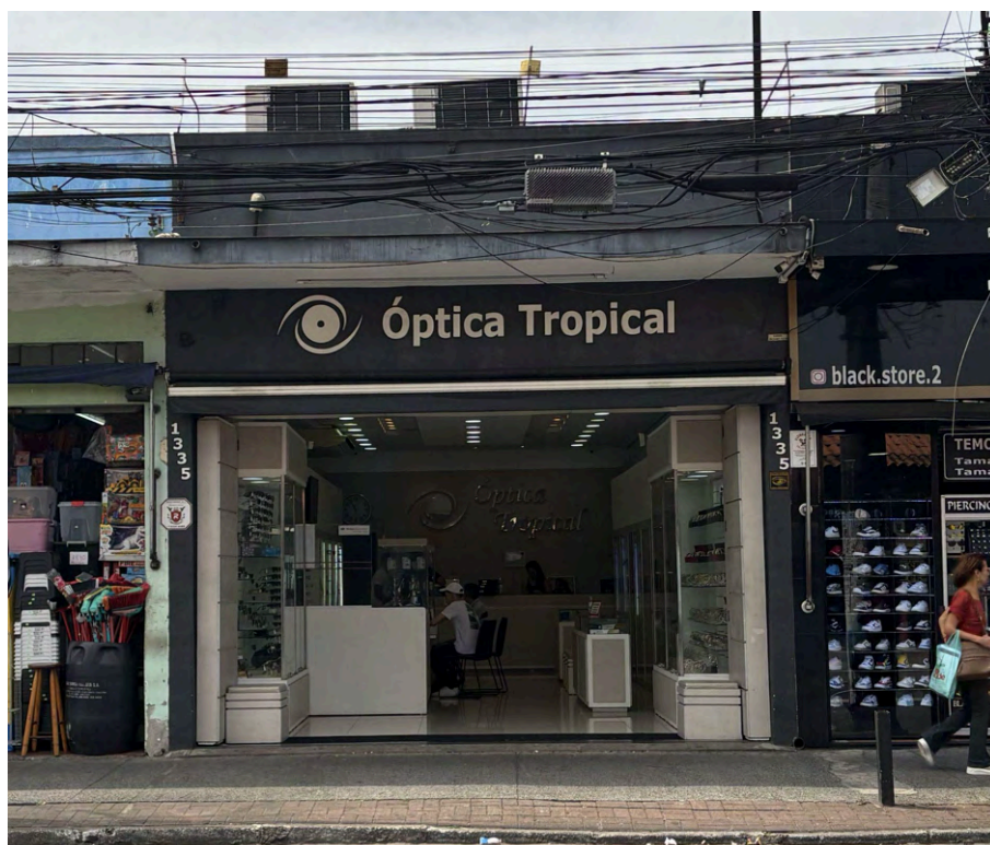
Fachada da Óptica Tropical. Foto: Fatima Antunes, DPH/SMC/PMSP, 09 set. 2025.