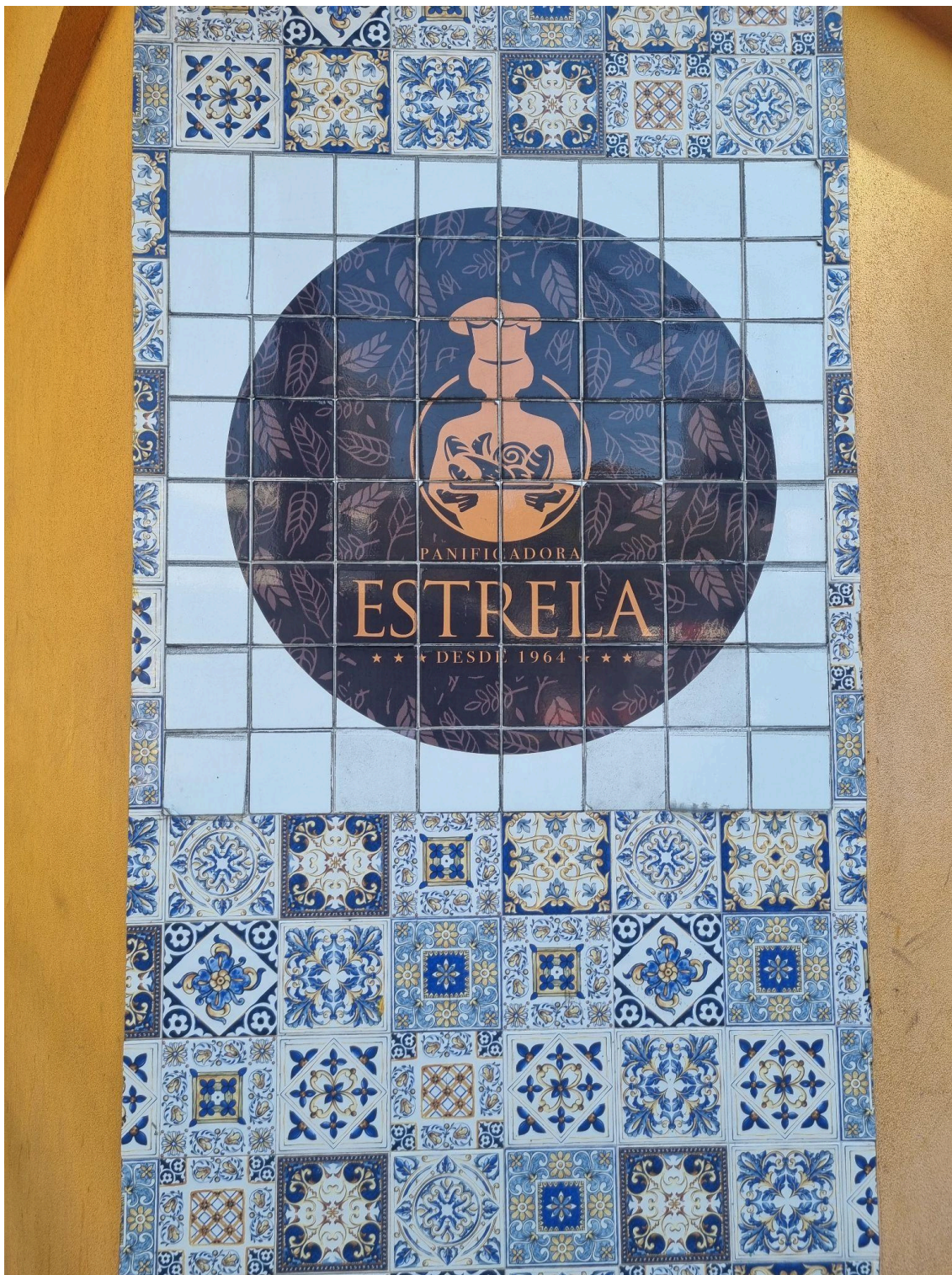
Logo na esquina da Avenida Vital Brazil com a Rua Camargo.