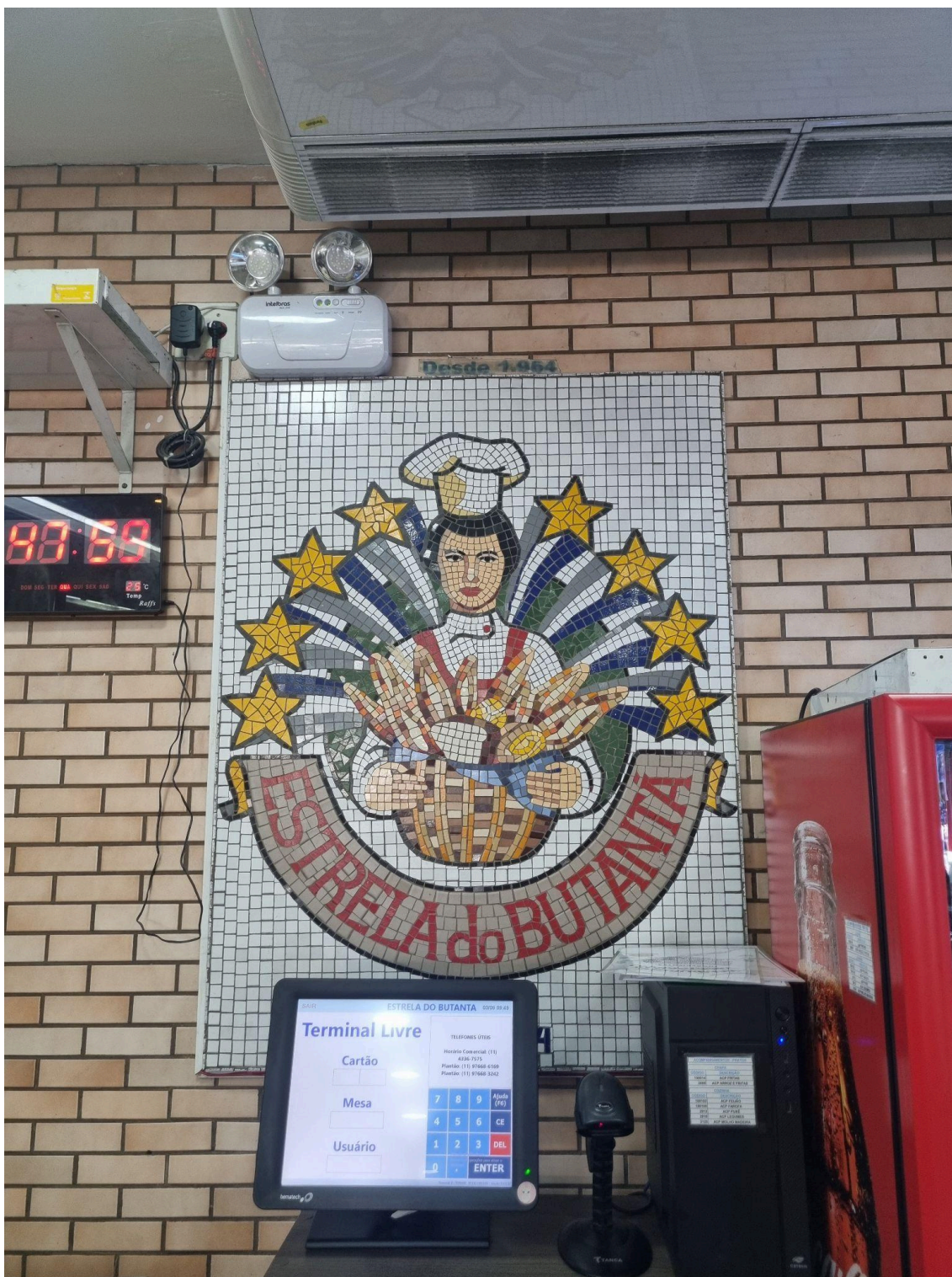
Mosaico com o logotipo da panificadora. Foto: Alec Akasaka (2025).