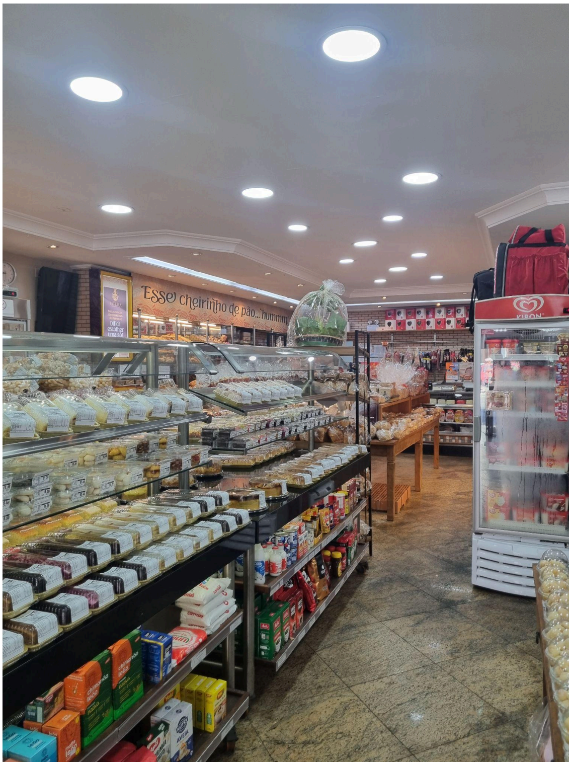
Área de mercado no interior da padaria. Foto: Alec Akasaka (2025).