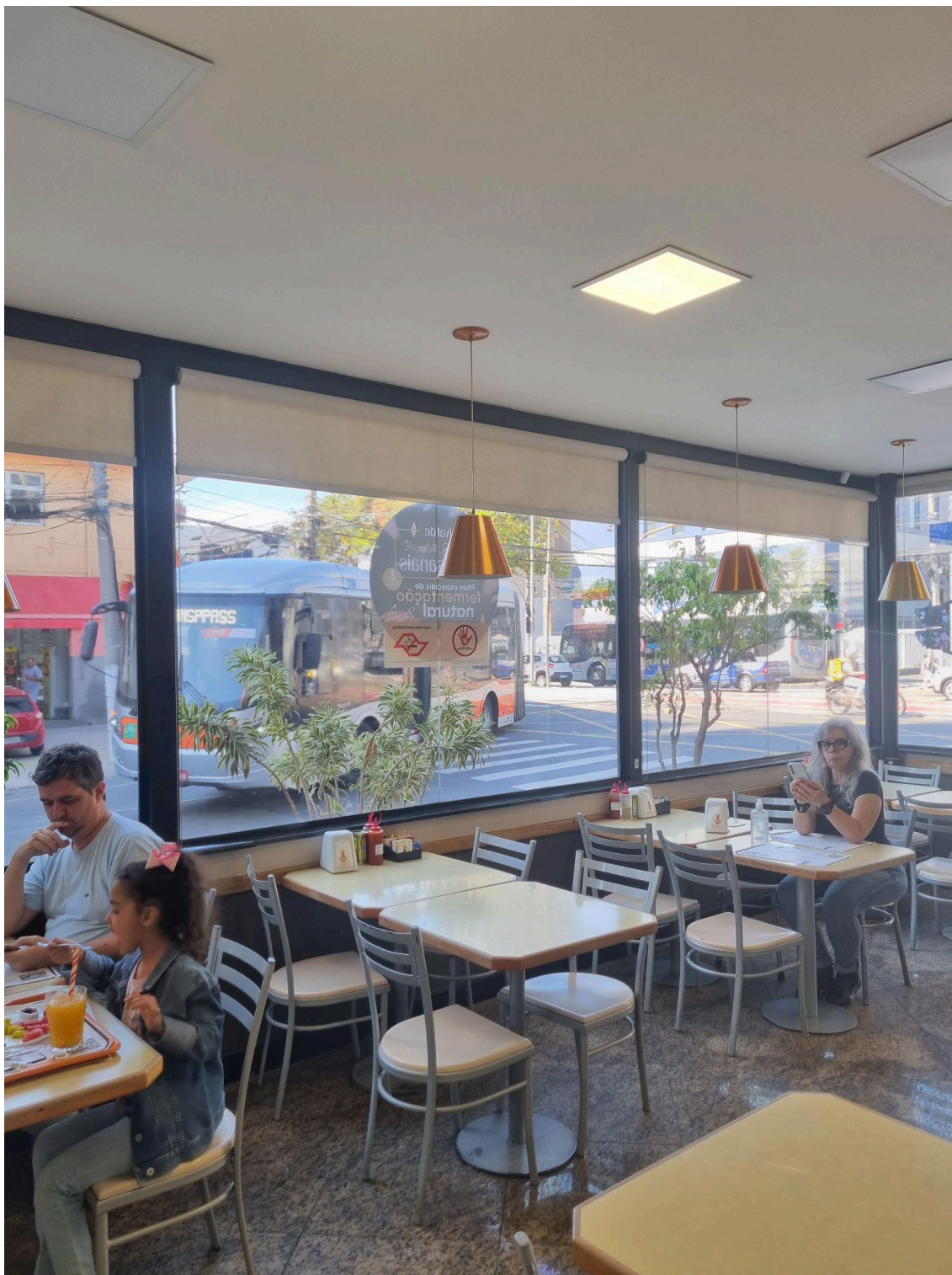
Área de salão nos limites entre a Avenida Vital Brasil e a Rua Camargo.