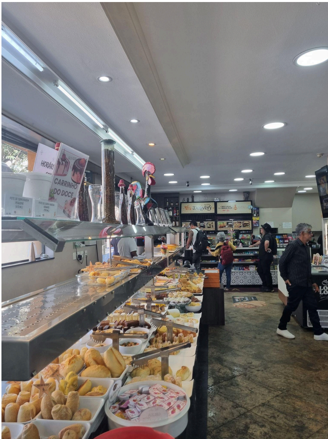
Área de self-service e caixa, no interior da padaria.