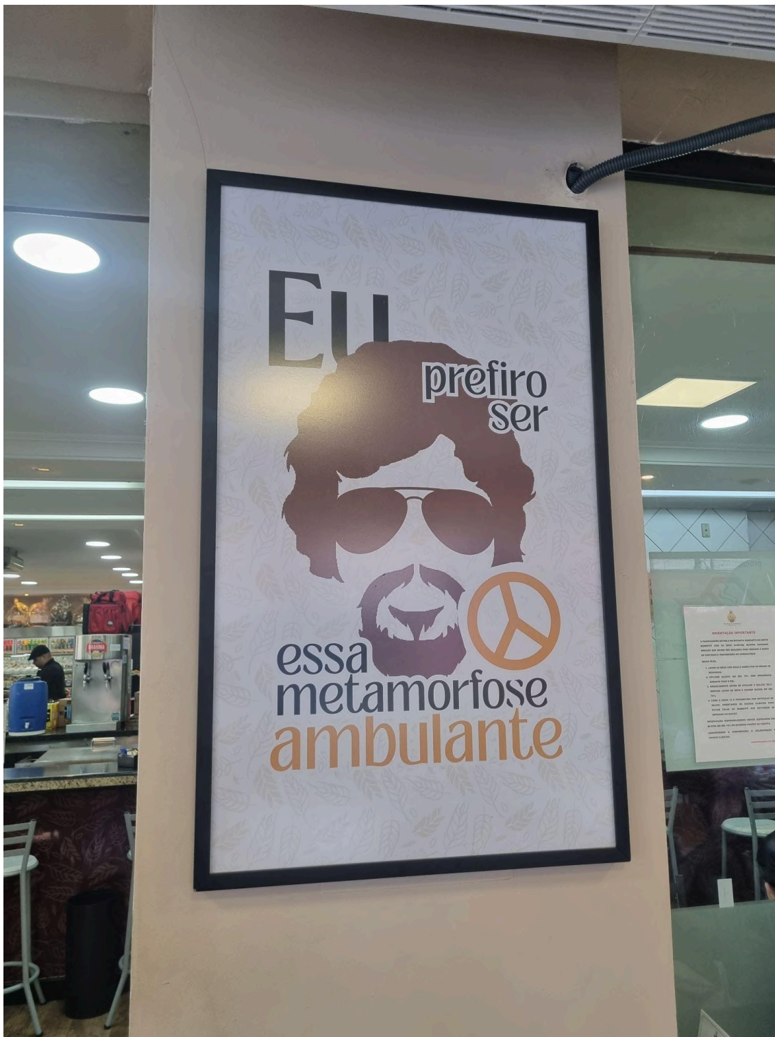
Quadro de Raul Seixas, antigo frequentador. Foto: Alec Akasaka (2025).