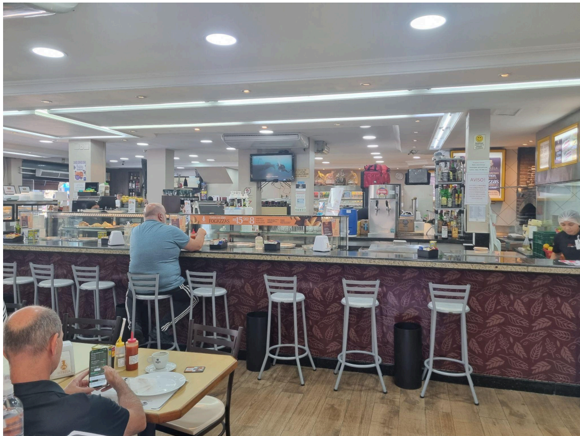
Área do balcão no centro do salão.