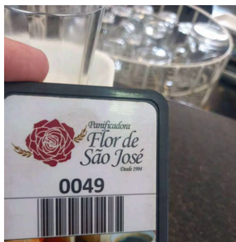
À esquerda, área de buffet na Panificadora Flor de São José. À direita, comanda com logo da padaria. 135