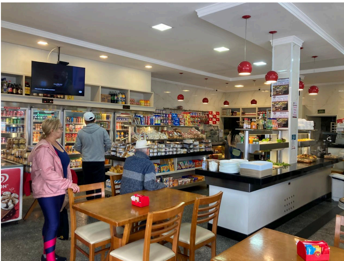
Interior da Panificadora Flor de São José.

No interior, a decoração é bastante sóbria e o vermelho da fachada figura apenas em alguns detalhes, como nas luminárias. O salão possui piso em granito cinza, paredes em tons claros e neutros, forro rebaixado em gesso branco com iluminação. O mobiliário é composto por mesas e cadeiras em madeira, além das vitrines, refrigeradores e móveis expositores que, apesar da grande oferta de produtos, permitem visualizar todo o espaço. A Panificadora Flor de São José se adequou aos tempos, mas permanece há décadas no coração do bairro, acompanhando e participando do desenvolvimento da Vila São José.