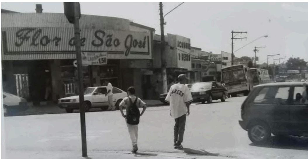
Fotografia sem data. À esquerda vemos a Panificadora Flor de São José e mais ao fundo a rua José Bocchiglieri. 134