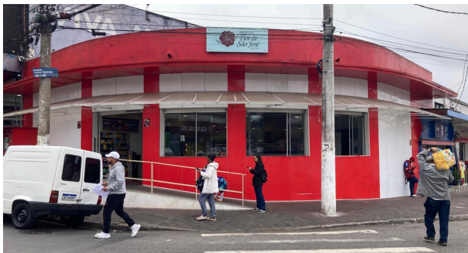
Fachada da Panificadora Flor de São José, à esquina da Rua José Bocchiglieri com a Avenida Carlos Oberhuber.

A Panificadora Flor de São José se situa à esquina da Avenida Carlos Oberhuber com a Rua José Bocchiglieri, voltada para a atual praça José Boemer Roschel, centro comercial do bairro de Vila São José. A edificação térrea apresenta aspecto contemporâneo, com janelas amplas em vidro temperado, cobertura em material transparente sobre leve estrutura metálica fazendo as vezes de marquise e acesso ao interior mediado por catraca. A fachada, de acabamentos nas cores vermelha e branco, possui discreto letreiro com o nome da padaria e a inscrição “desde 1994” - demarcando o início da atual gestão.