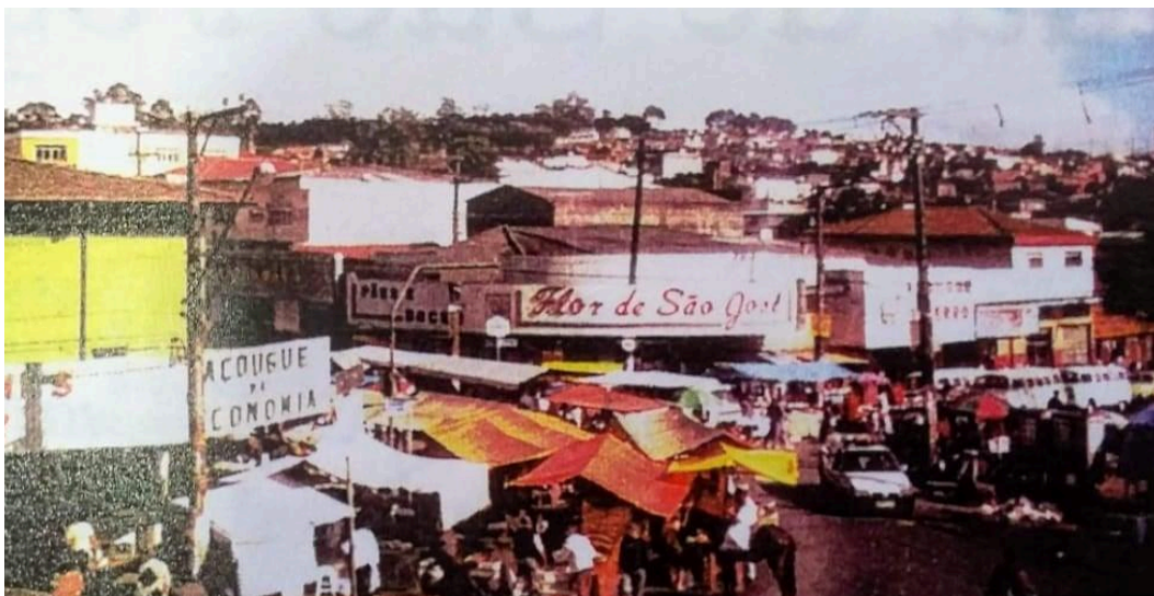
Fotografia sem data. À esquerda tem-se a Casa de Carnes São José e à direita a padaria. 133