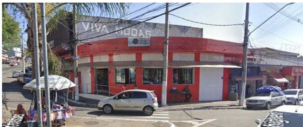
Fachada da Panificadora Flor de São José. Disponível em: Google Street View: maio de 2024. Acesso em: 11 de ago. de 2025.