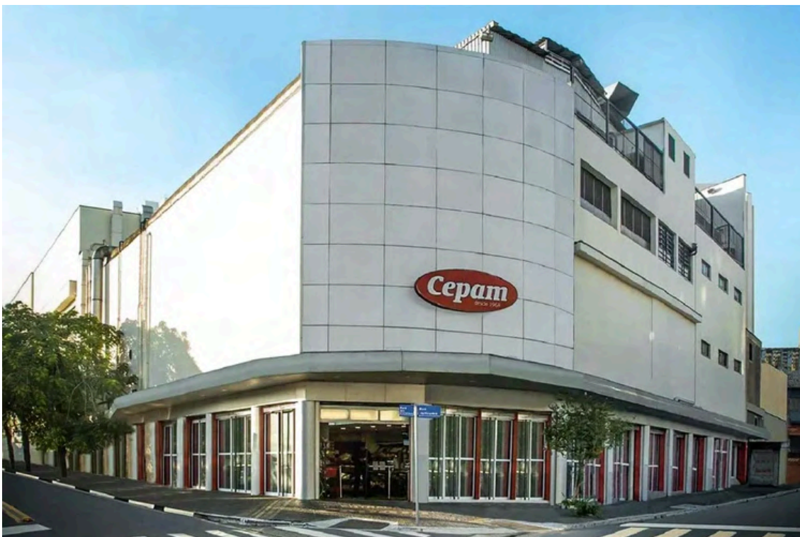
Fachada da loja Panificadora Cepam.