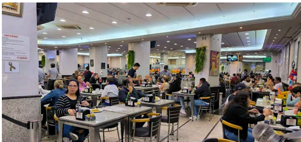
Foto da ambiência interna da padaria CEPAM. Autor: Gabriel Arantes . Disponível em Google Imagens . Acesso em set. 2025.

A padaria, atualmente, conta com cerca de 2.300 a 2.500 m 2 de espaço interno, a depender da fonte. Em seu interior, há 500 lugares disponíveis para quem busca café da manhã, almoço, jantar, happy hour ou mesmo um local para reuniões de trabalho.