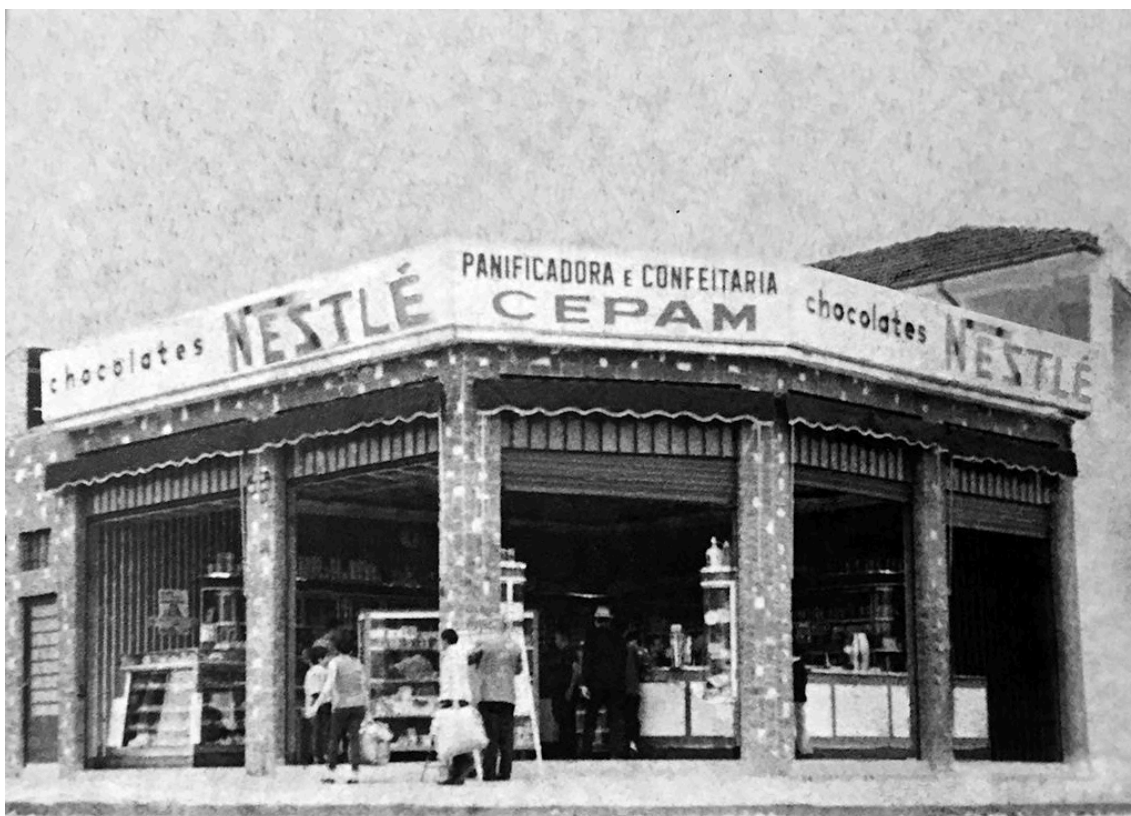
Fachada da Panificadora e Confeitaria CEPAM, final da década de 60, início dos anos 1970.