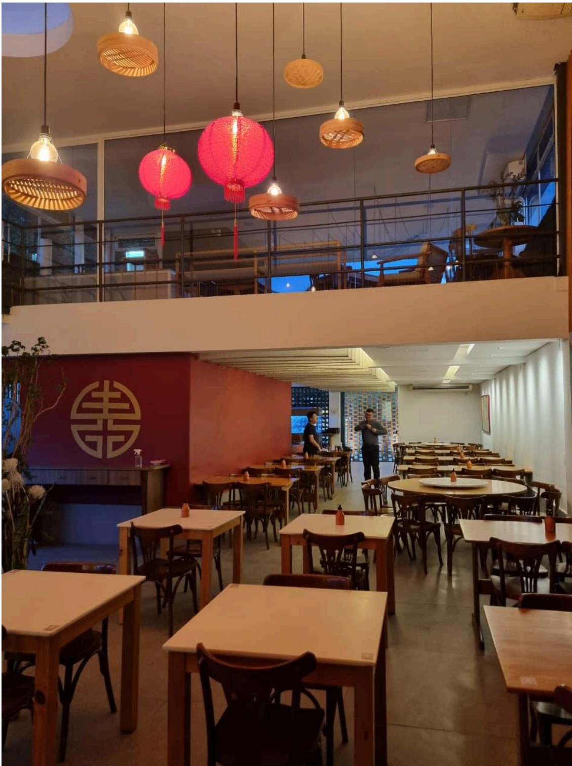
Salão no segundo pavimento e espaço de eventos no mezanino. Foto: Alec Akasaka (2025).