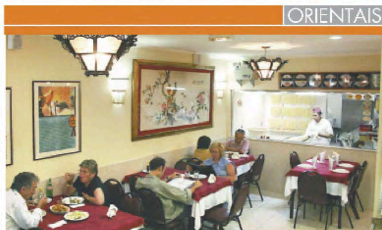
Ambiente do restaurante Ton Hoi , no Butantã, um das poucas representantes da cozinha do mar da China