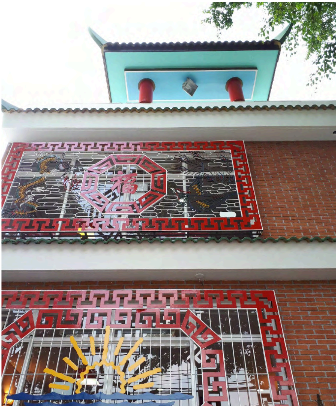
Antiga fachada do restaurante Ton Hoi, 2018. Fonte: Google Maps. Acesso em: ago. 2025.