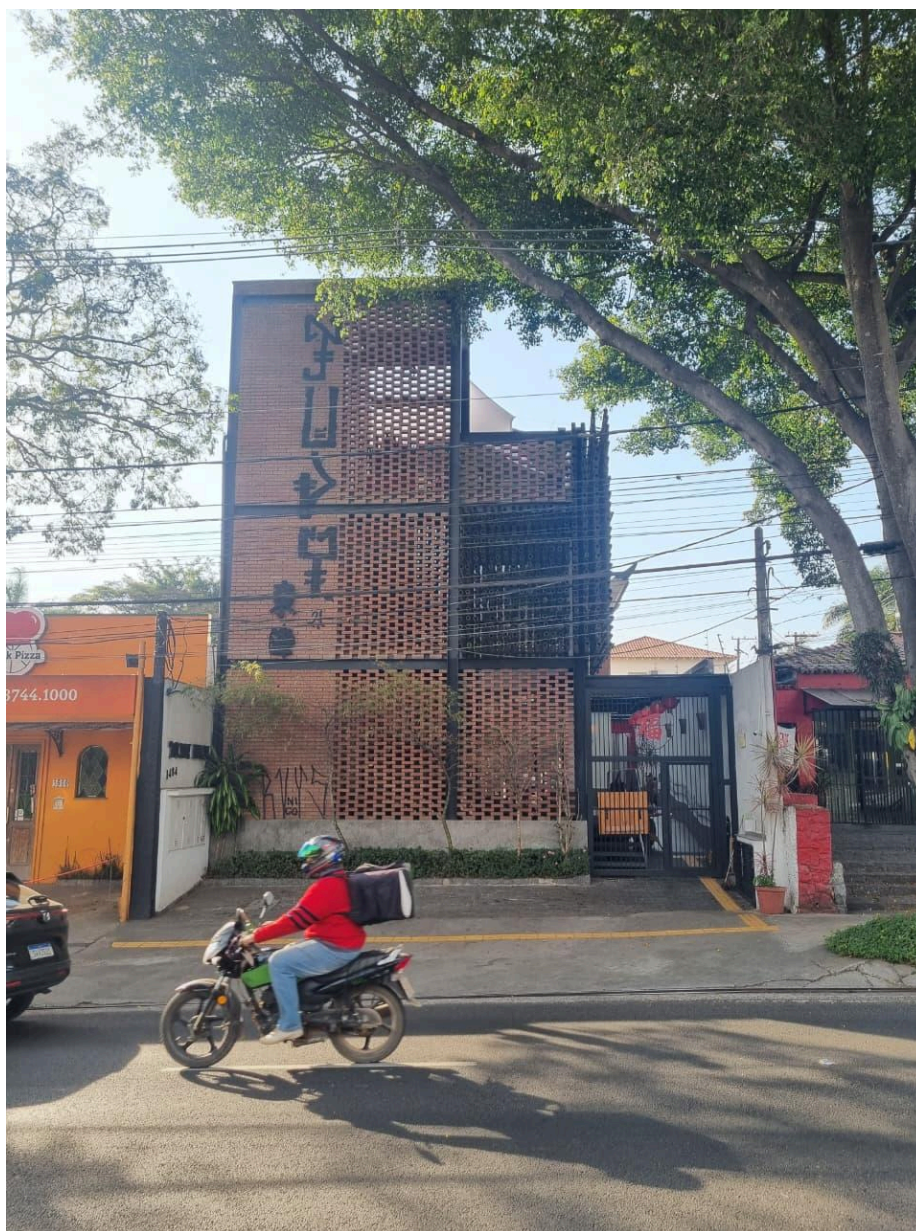
Fachada atual do Ton Hoi.

O edifício localizado na Avenida Francisco Morato, sede do Ton Hoi, passou por sucessivas modificações, de consultório odontológico em uma casa térrea para sobrado e, finalmente, o pequeno edifício atual. Após as reformas realizadas em 2018, o restaurante adquiriu a feição atual, com estrutura metálica e alvenaria e elementos vazados de tijolos, além dos planos ornamentais de hastes de bambu, perpendiculares à fachada.