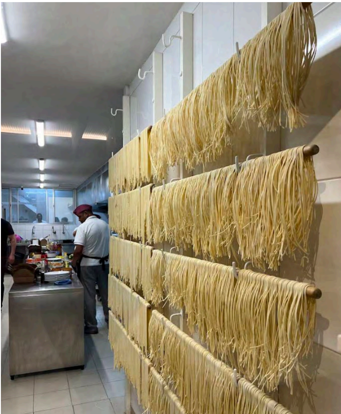
Interior da cozinha e expositor de massas. Fonte: Google Maps. Acesso em: ago. 2025.