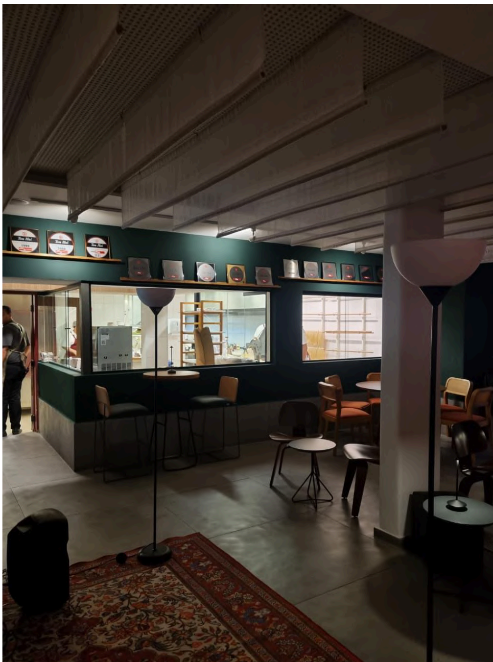
Lounge no interior do restaurante, com vistas para a cozinha. Foto: Alec Akasaka (2025).

Pelo portão lateral é possível acessar o primeiro piso através de uma rampa, onde estão localizados os banheiros e o lounge de recepção. É a partir deste espaço que se observa a pioneira cozinha “ao vivo”, onde encontram-se as estações de preparo de alimentos, bem como um expositor de massas feitas na casa. O lounge de recepção se destaca como espaço de estar com música ao vivo.