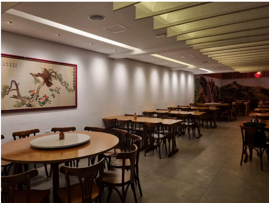
Salão no segundo pavimento. Foto: Alec Akasaka (2025).

Ainda no primeiro piso encontram-se, atrás do lounge, o bar e balcão, onde é também possível acessar o elevador para os pavimentos superiores. No segundo pavimento está localizado o atual salão, local amplo onde estão dispostas as mesas do restaurante, espaço ornamentado por luminárias de papel, além de um conjunto imagético da cultura chinesa, com fotografias, quadros e painéis. No mezanino está localizado o espaço de eventos, área livre com acesso para a cobertura.