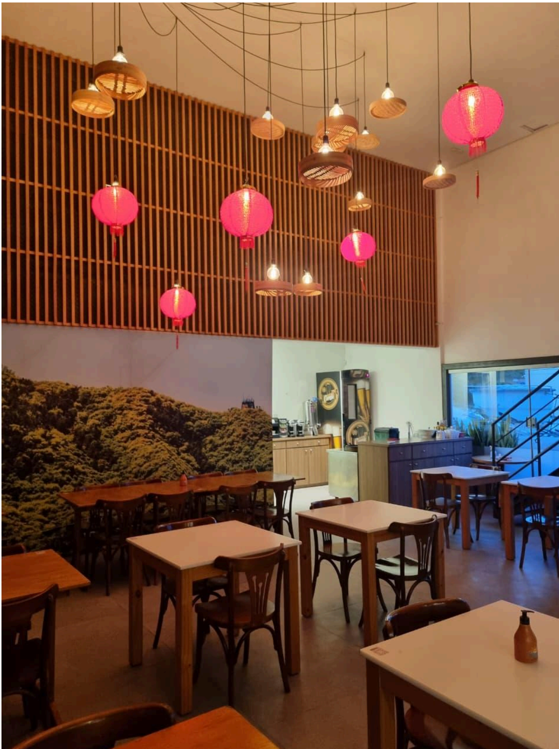
Salão no segundo pavimento. Foto: Alec Akasaka (2025).