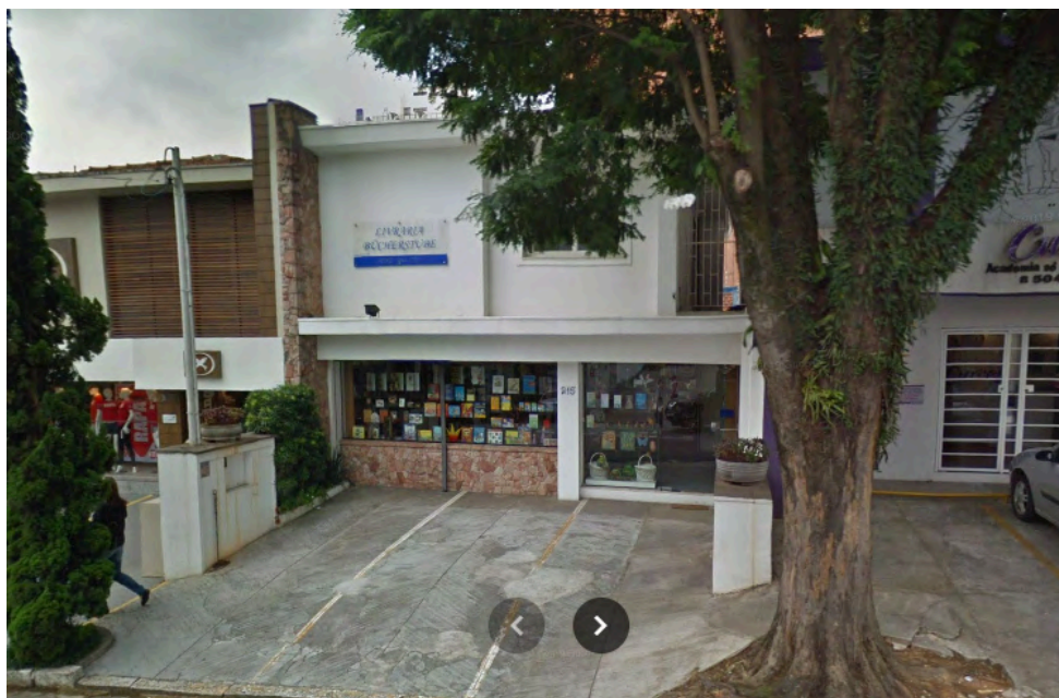
Fachada da Livraria Alemã. Fonte: Google Maps. Acesso em: ago. 2025.