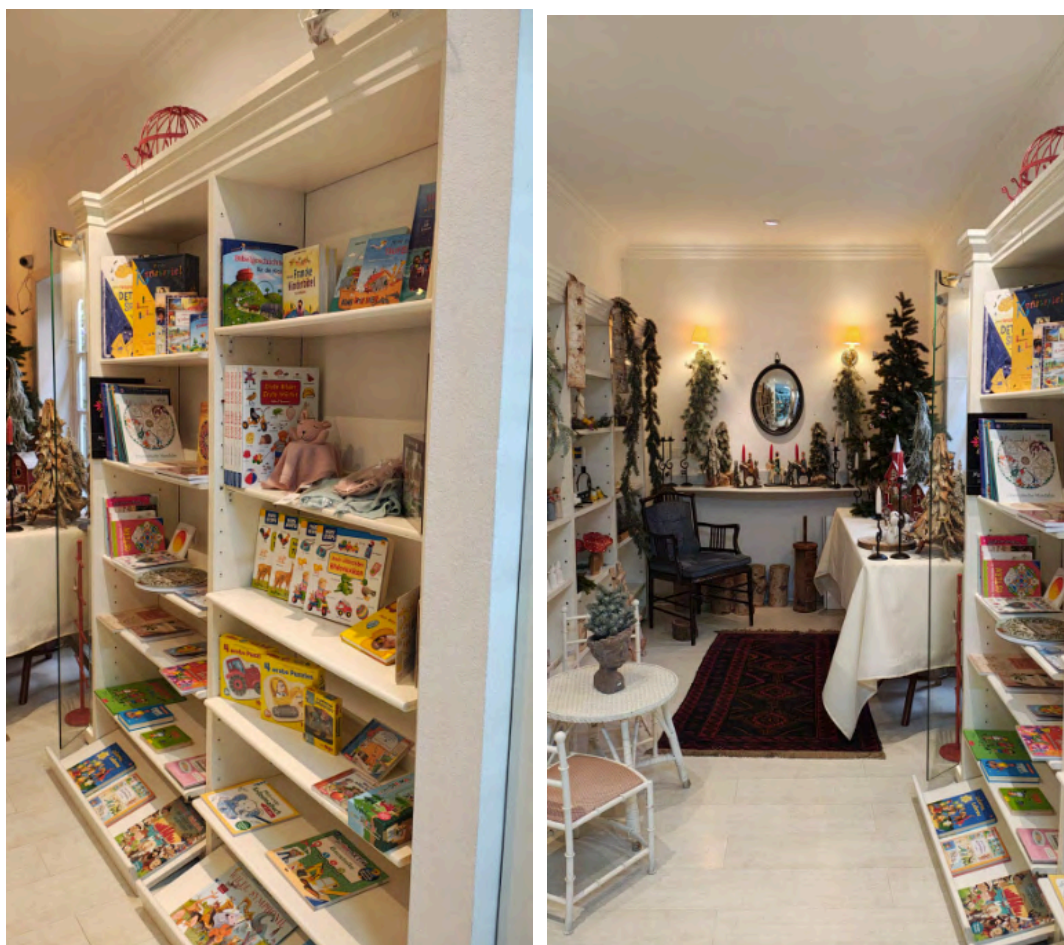
Fotos da área aos fundos da loja, com exposição de artesanatos e estantes de livros didáticos.