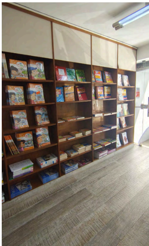
Fotos da área de entrada da loja, com exposição de artesanatos e estantes de livros didáticos. Foto: Licia de Oliveira (2025)