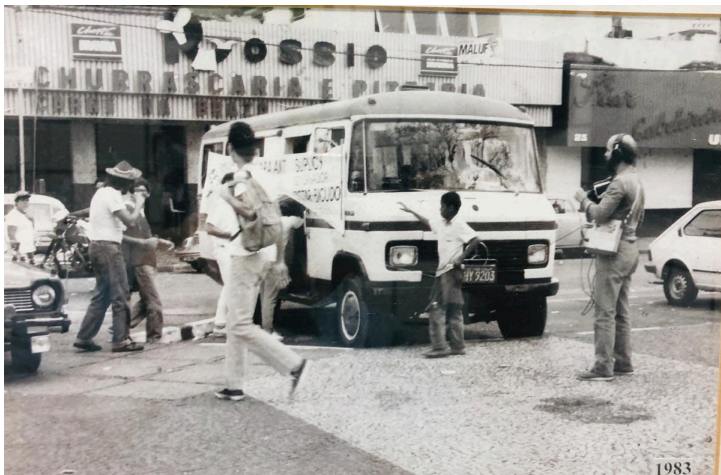
Restaurante Rossio nos anos 1980.

mas segundo ele, a cada década desde 1981, aproximadamente, eram feitas algumas modificações no lugar.