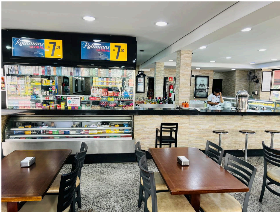
Caixa com vitrine em vidro.

Seguindo adiante do caixa, há um primeiro salão com mesas e cadeiras e também um balcão em formato de “U”, que ocupa bastante espaço do restaurante.