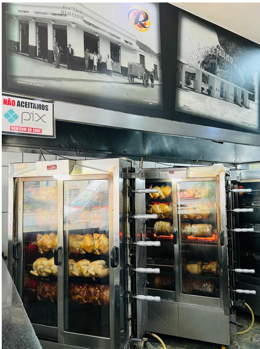
Máquinas de frango assado.

Do lado direito depois da entrada, em frente das máquinas de frango assado, há o caixa, bastante característico de padarias e lanchonetes. Trata-se de um caixa com vitrine de vidro.