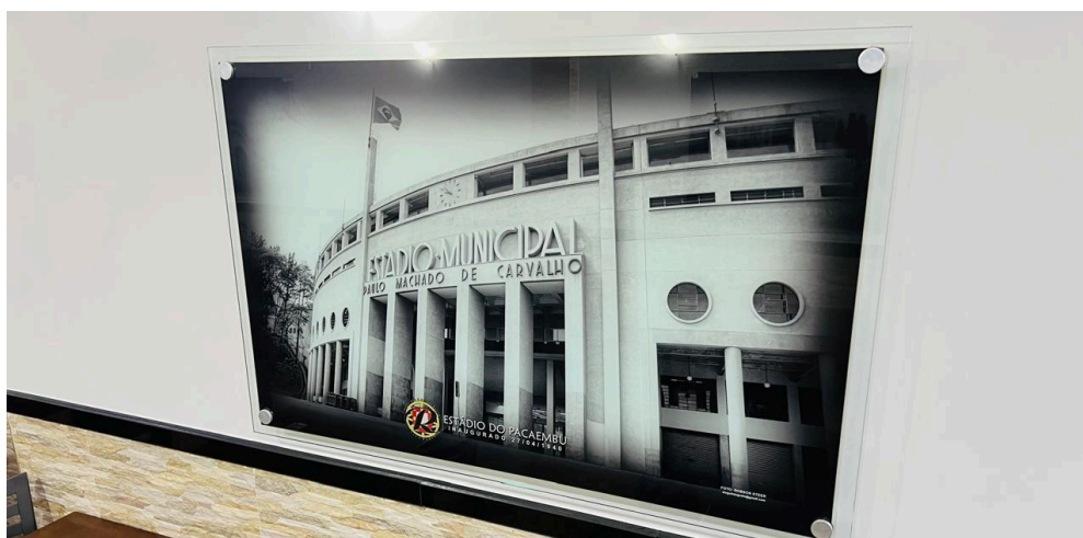
Fotografias presentes no segundo salão.

Além disso, ao redor de todo o espaço existem quadros com locais conhecidos e característicos da cidade de São Paulo, como o Estádio do Pacaembu ou o Theatro Municipal. Há também algumas fotografias antigas do restaurante (como as reproduzidas no tópico anterior).