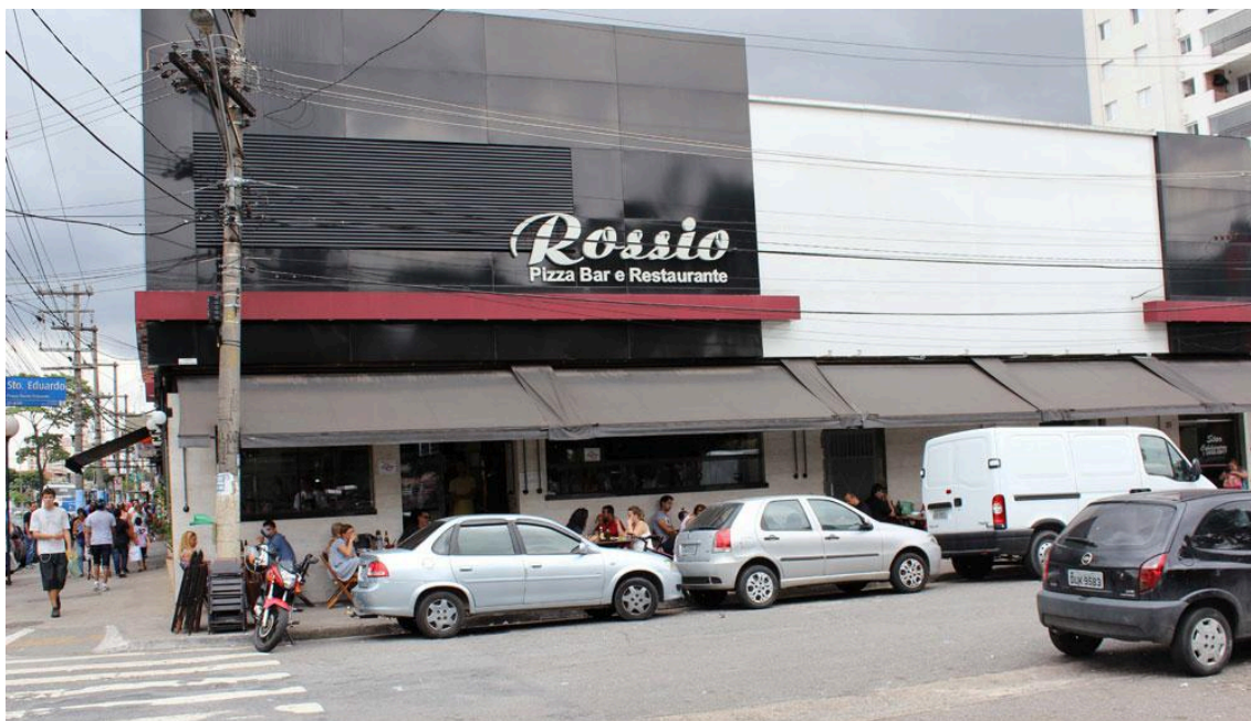
Fachada do Rossio Pizza Bar e Restaurante. Disponível em: https://www.rossiovilamaria.com.br/espaco.php . Acesso em: jul. 2025.