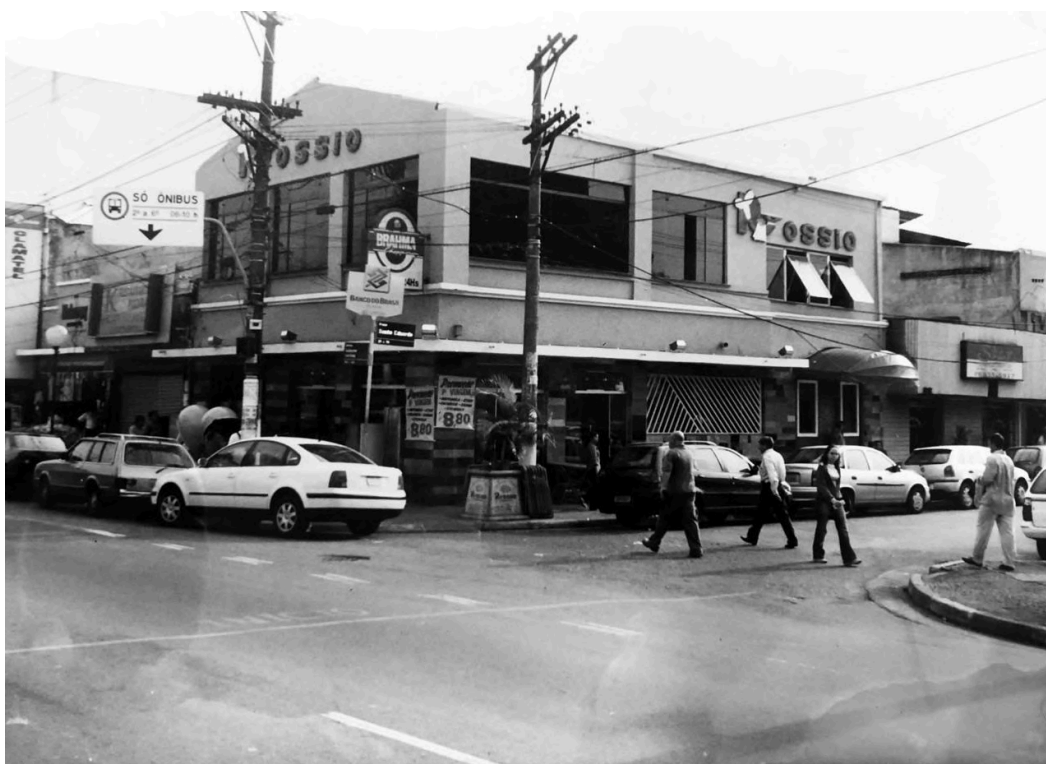
Restaurante Rossio nos anos 1990.