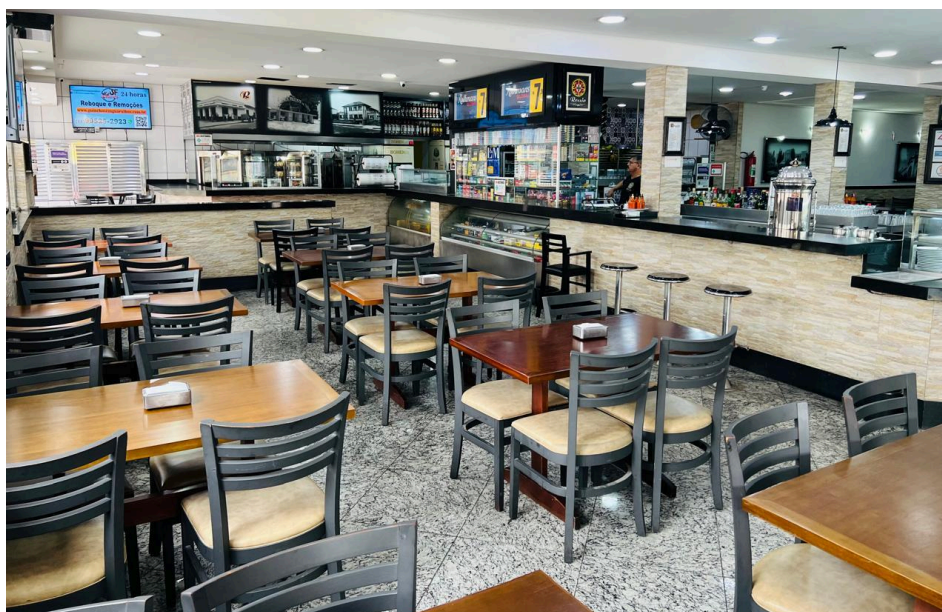
Primeiro salão e balcão.

Seguindo adiante do caixa, há um primeiro salão com mesas e cadeiras e também um balcão em formato de “U”, que ocupa bastante espaço do restaurante.