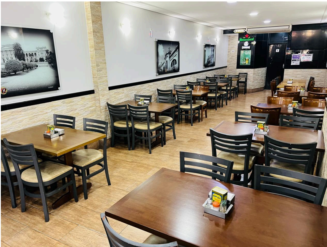
Segundo salão.

Além disso, ao redor de todo o espaço existem quadros com locais conhecidos e característicos da cidade de São Paulo, como o Estádio do Pacaembu ou o Theatro Municipal. Há também algumas fotografias antigas do restaurante (como as reproduzidas no tópico anterior).