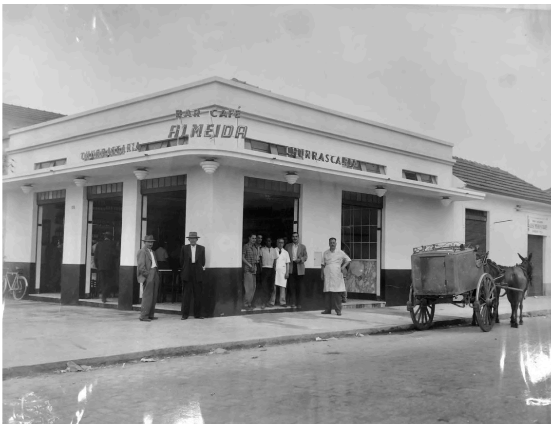
Bar Café Almeida, comércio que antigamente ocupava o imóvel do Rossio, por volta da década de 1960.

O imóvel que hoje abriga o Rossio existe há mais tempo que o restaurante; em sua trajetória, ele já acolheu empórios, bares e até uma pastelaria e, segundo o proprietário, não há data precisa de quando o primeiro desses comércios foi inaugurado. Até 1969, operava lá o Bar Almeida, um bar, café e churrascaria de propriedade de uma família de imigrantes portugueses do bairro. A partir de 1969, o bar é transformado em restaurante, sendo renomeado de “Rossio”, que faz menção a uma praça na cidade de Lisboa, em Portugal, e continuava administrado pela mesma família.