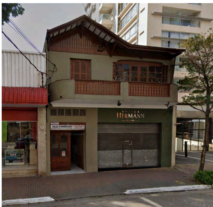
Fachada da Ótica Hermann. Fonte: Google Maps. Acesso em: ago.2025