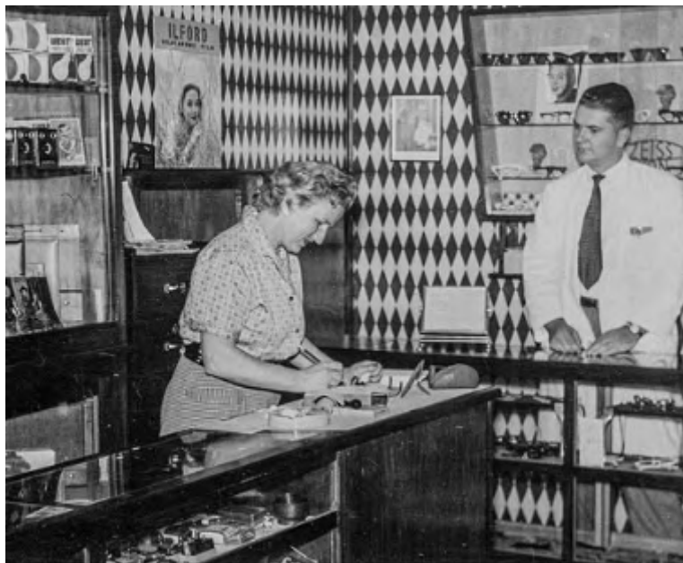
O casal proprietários na loja em 1958.

A Hermann, juntamente com a Livraria alemã e alguns restaurantes mais recentes, ainda contam a história da comunidade alemã do Brooklin, tão numerosa em outros tempos.