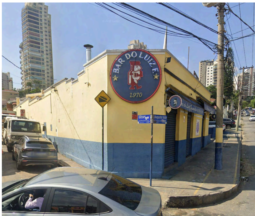
Fachadas do Bar Luiz Fernandes. Rua Augusto Tolle, 610, Mandaqui, abr. 2024. Fonte: Google Street View. Disponível em: < https://maps.app.goo.gl/Posni5thhNJQWUjY7 >. Acesso em: 27 ago. 2025.