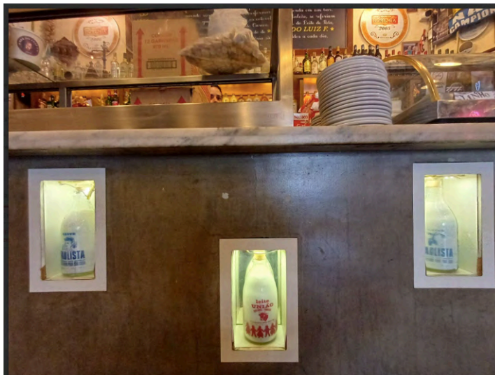
Fig. 21. Detalhe do balcão decorado com antigas garrafas de leite, onde eram armazenadas as primeiras batidas artesanais, 04 set. 2025.

Segue o texto escrito na lousa, junto ao balcão do salão principal (Fig. 20).