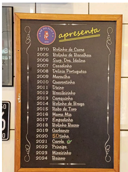
Fig. 14. Lousa com uma lista de 21 bolinhos criados a cada ano, 04 set. 2025.

Notam-se nas listas das lousas, do cardápio, e das garrafas sobre os balcões, a variedade de sabores de bebidas feitas de cachaça, a caipirinha, e as batidas, produzidas pelo bar e recomendadas por seus donos. Ambas têm suas garrafas personalizadas (Fig. 15 a 21).