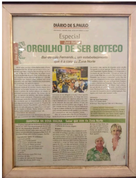
Fig. 13. Bar do Luiz F. Matérias de jornais e revistas por todo o bar, 04 set. 2025.

Notam-se nas listas das lousas, do cardápio, e das garrafas sobre os balcões, a variedade de sabores de bebidas feitas de cachaça, a caipirinha, e as batidas, produzidas pelo bar e recomendadas por seus donos. Ambas têm suas garrafas personalizadas (Fig. 15 a 21).