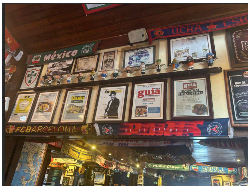
Fig. 30. Ambiência interior, 04 set. 2025.

O piso de cimento foi assentado em todo o bar, com cerâmica impressa com o logo do bar nas suas juntas (Fig. 31), como marca e personificação do lugar.