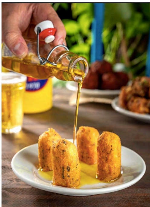
Fig. 9. Recheio do bolinho de carne, 2024.