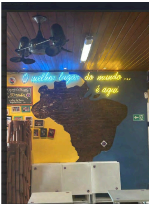
Fig. 32. Ambiência interna, 04 set. 2025.

Por fim, conclui-se com a figura 32, que é uma amostra de brasilidade da família espanhola, que ganhou destaque num dos ambientes do Bar do Luiz Fernandes.