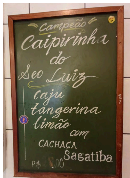
Fig. 15. Lousa com lista de bebidas com cachaça, 2024.