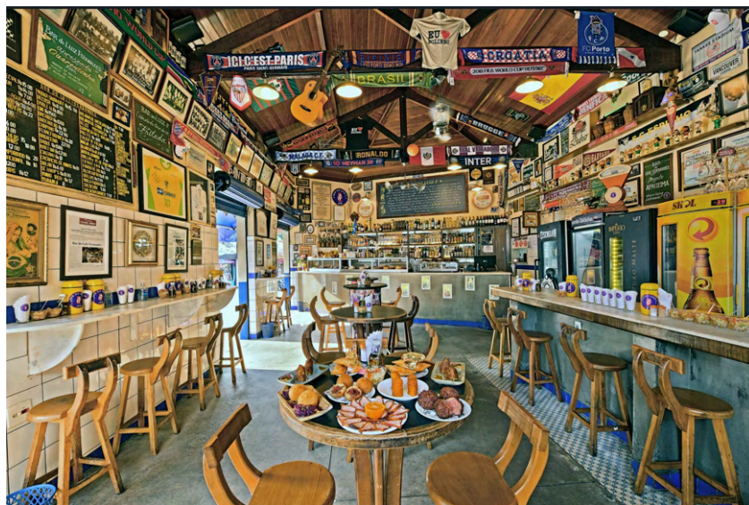
Fig. 27 Salão principal. Painel com esta foto no bar, 2023. Fonte: Revista Menu. Acesso em: 28 ago. 2025.

Quanto ao seu ambiente interno, organiza-se com o salão principal e outros ambientes, como foi dito anteriormente, com as paredes cobertas de quadros com motivos diversos, lousas informativas, e as tesouras aparentes são dotadas de objetos, faixas e bandeiras de vários países. Os ambientes possuem mobiliário distintos (mesas, cadeiras) e balcões de serviços do bar e de clientes. Esse conjunto de adereços traz uma atmosfera aprazível ao local (Figs. 27 a 30).