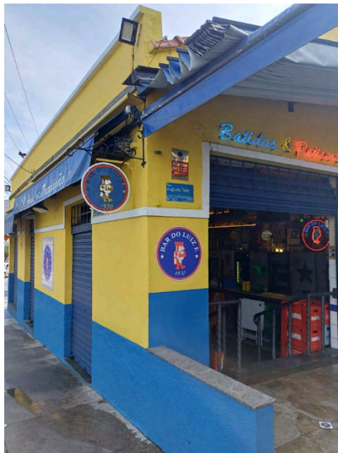
Fig. 5. Logo do bar na sua fachada principal, 04 set. 2025 (Foto: Iná Rosa).