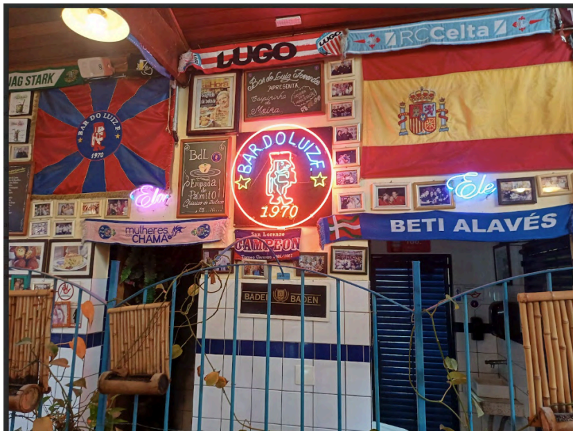
Fig. 29. Ambiência interior, 04 set. 2025.