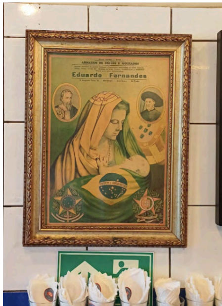
Fig. 2. Inscrição na parede do Bar do Luiz Fernandes, antigo “Mercado de Seccos Molhados” de Eduardo Fernandes, que estampa a parede do bar, 04 set. 2024.