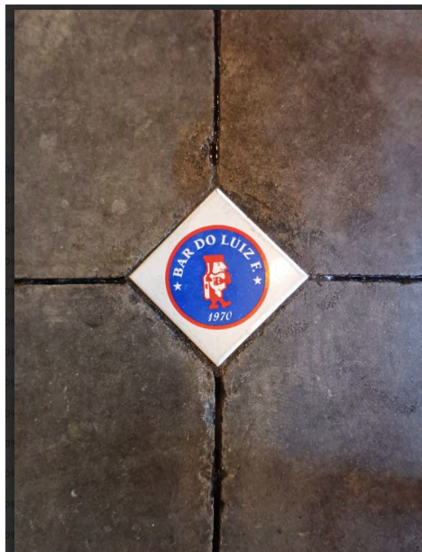
Fig. 31. Detalhe do piso de concreto em todos os ambientes, 04 set. 2025.

Por fim, conclui-se com a figura 32, que é uma amostra de brasilidade da família espanhola, que ganhou destaque num dos ambientes do Bar do Luiz Fernandes.