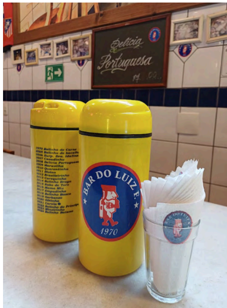
Fig. 12. Bar do Luiz F. Suportes de cerveja e guardanapos personalizados, 04 set. 2025.