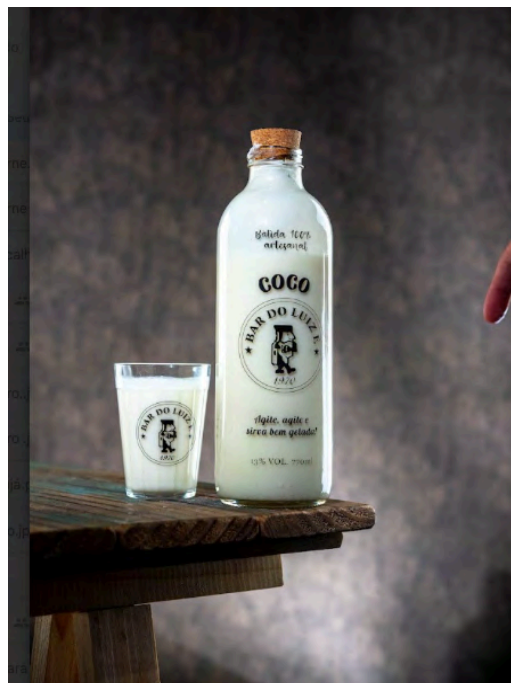
Fig. 19. Batida de coco. Garrafa e copo personalizados, 2024 (Foto: Flavio Santana).