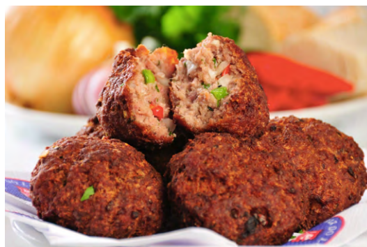
Fig. 8. Bolinho de Carne, tradicional no bar, 2024.