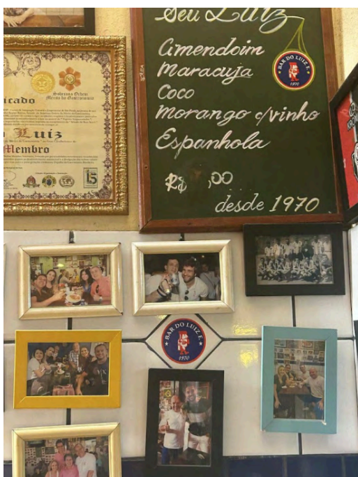
Fig. 18. Lousa com a lista de batidas artesanais feitas pelo bar, 04 set. 2025.