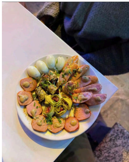
Fig. 10. Recheio do bacalhau, 2024.