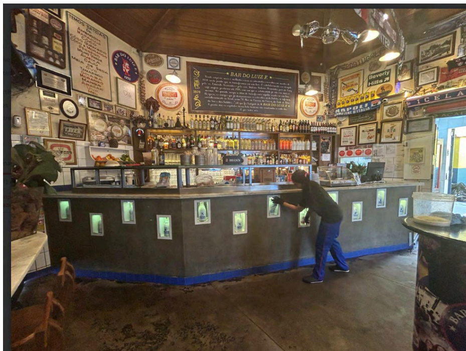
Fig. 20. Salão principal. Parede com prateleiras de bebidas e balcão decorado com antigas garrafas de leite, onde eram armazenadas as primeiras batidas artesanais. Lousa com um breve histórico do bar pelo bar, 04 set. 2025.

Aqui no Bar do Luiz as batidas são produzidas artesanalmente desde a década de 60, quando o pequeno empório do Sr Luiz transformou-se em botequim. A qualidade da bebida fez com que o boteco ficasse conhecido na região como Bar das Batidas. Os sabores mais amados pelo público estão presentes no cardápio até hoje, sendo vendidos por dose ou por litro. Experimente: da nossa família para a sua! [Grifo nosso]