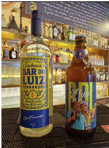
Fig. 16. Garrafas de cachaças personalizadas, 04 set. 2025