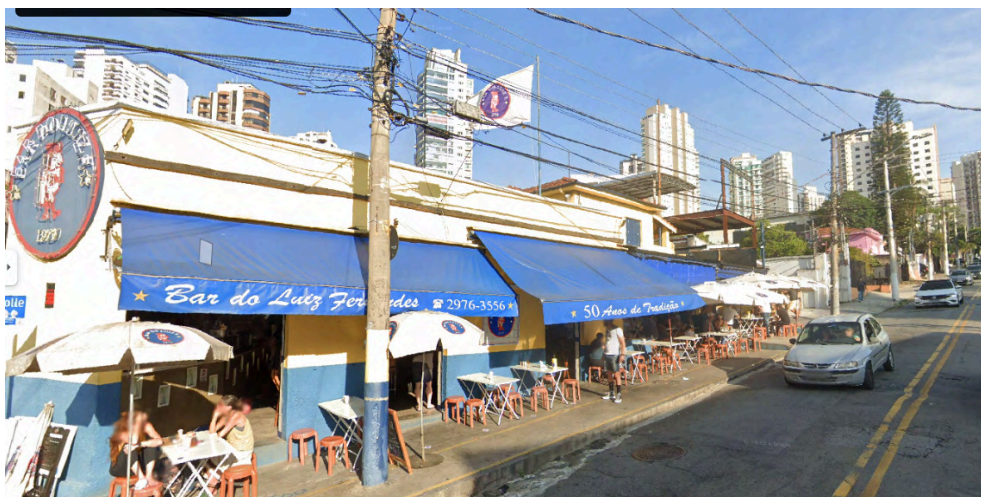
Fig. 25. Entorno do Bar do Luiz F., antes da pintura atual. Vista da rua em alicive, dez. 2023.

O bar ocupa as calçadas principalmente aos sábados, domingos e feriados, o que propicia outra dinâmica no local, como pode ser visto na imagem de 2023 extraída do Google Street View, antes da atual cor da fachada, e na foto disponibilizada pelo Bar do Luiz F., de 2000 (Figs. 22, 25 e 26).