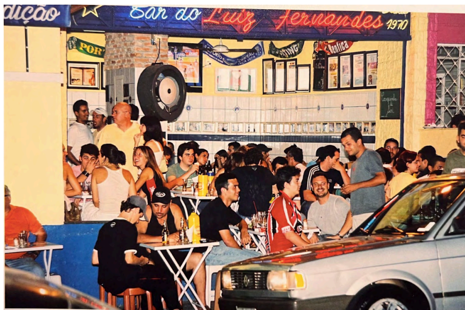
Fig. 26. Bar do Luiz F., antes da reforma de 2014, 2000.