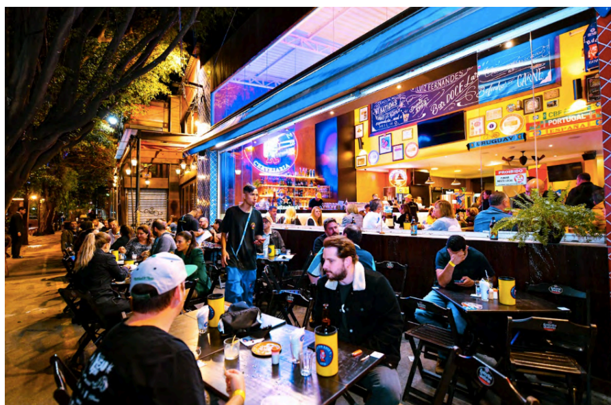
Fig. 23. Filial à Avenida Eng. Caetano Alves, 1470, jan. 2024 (Fonte: Acervo Bar Luiz Fernandes).