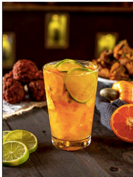
Fig. 17. Caipirinha do Seu Luiz, com cachaça, limão, tangerina e caju, 2024.