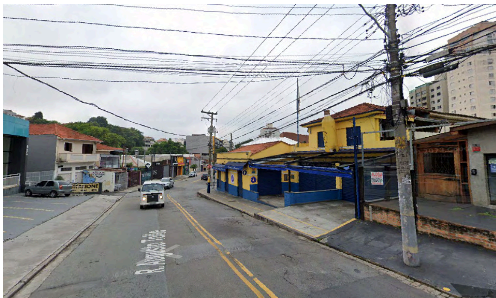
Fig. 24 . Entorno do Bar Luiz Fernandes. Rua Augusto Tolle, vista em declive, abr. 2024. Fonte: Google Street View. Disponível em: < https://maps.app.goo.gl/Posni5thhNJQWUjY7 >. Acesso em: 27 ago. 2025.

Sob o ponto de vista da preservação, verificou-se que não há construções ou áreas tombadas nas suas proximidades. Entretanto, como estabelecimento de ‘comida de boteco’ destaca-se pelo seu valor histórico e cultural, alinhados à sua tradição espanhola, à boa qualidade de seus produtos e de seu atendimento, apreciados por clientes fiéis e atraindo sempre novos consumidores.