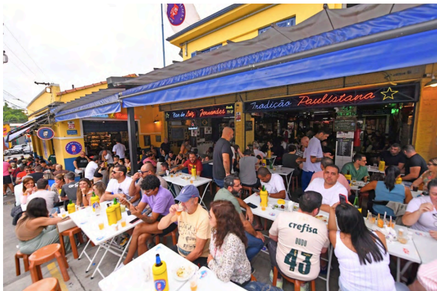
Fig. 22. Bar do Luiz F. Sede. Rua Augusto Tolle, 610, jan. 2024.