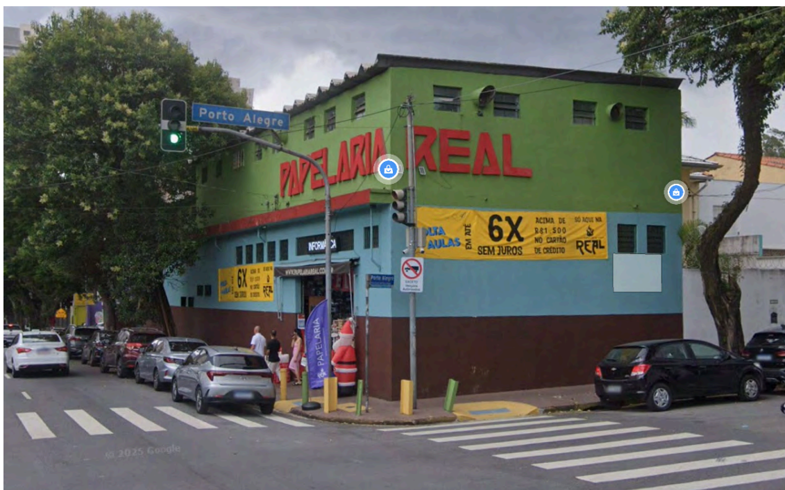
Localização da loja