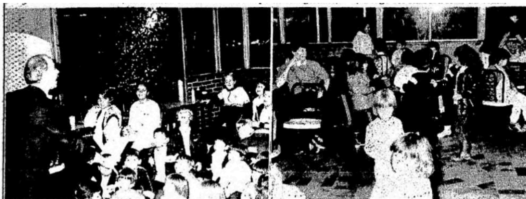
Lanchonetes, pizzarias, clubes atraem os aniversários infantis. E todos ficam felizes

marisco -, além da inovação com as pizza doces. 235