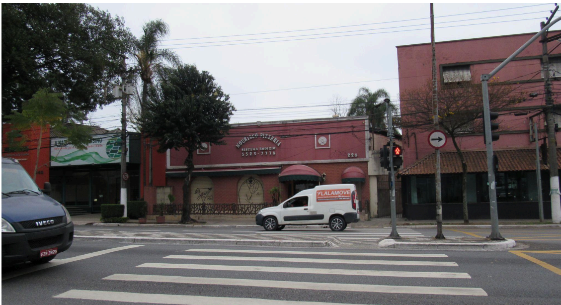
Fachada da Mourisco Pizzeria, à Avenida João Dias.

A Mourisco Pizzeria se situa em via de forte caráter comercial, sem faixas destinadas ao estacionamento de veículos. A edificação conserva o aspecto dos anos 1970, com vãos em arco - sendo o de acesso destacado pelo toldo vermelho e verde -, fachada com acabamento em lajota terracota na porção inferior e pintura em vermelho e branco na metade superior, que esconde a cobertura e sustenta o letreiro com nome e telefone do estabelecimento.