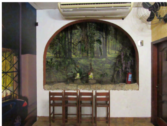
Salão da Mourisco Pizzeria, a partir da entrada, olhando para o fundo do lote. À direita, nicho decorativo.