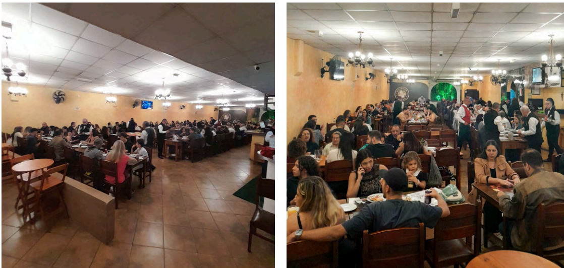
Salão da Pizzeria Mourisco durante um sábado.