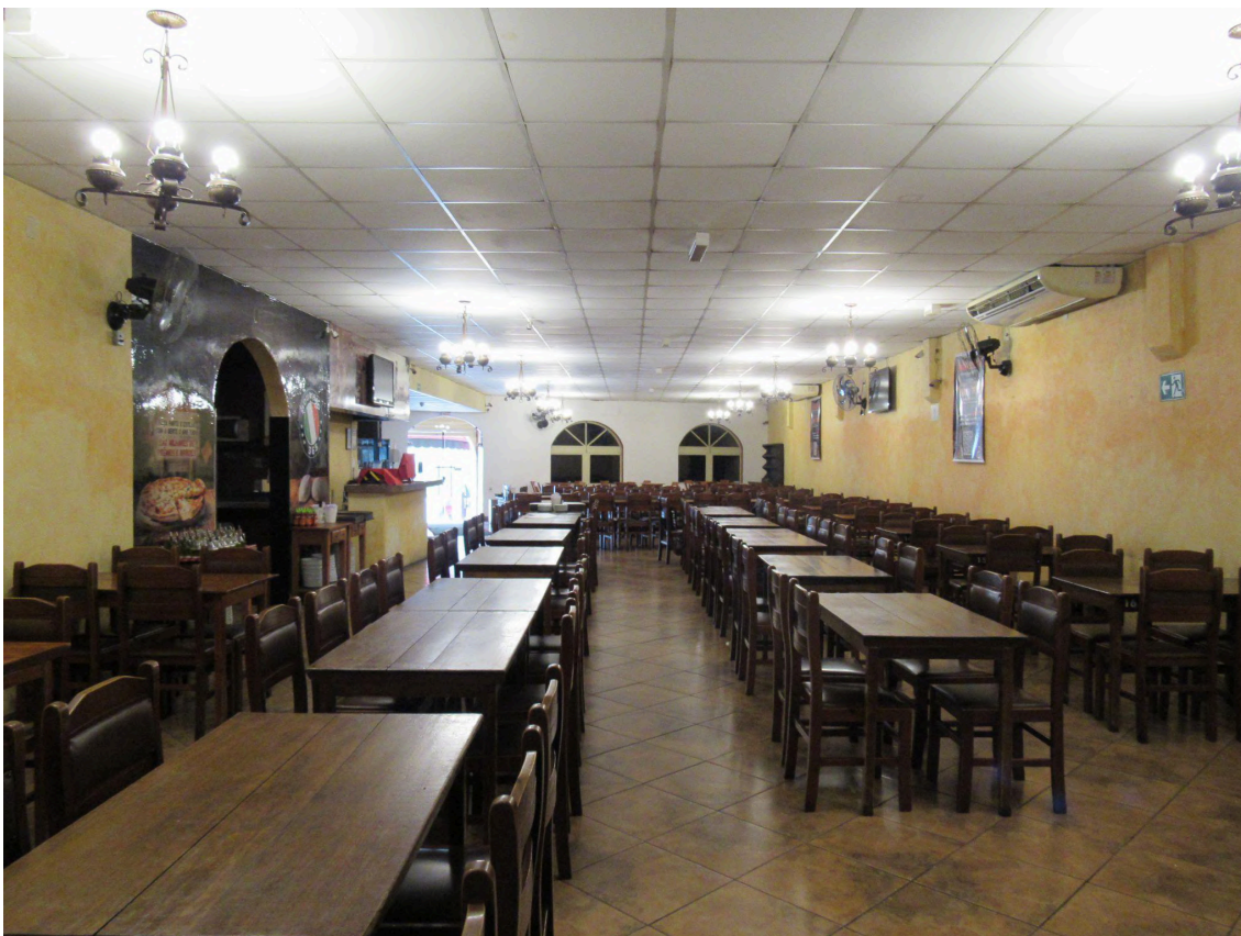
Salão da Mourisco Pizzeria, olhando para a frente do lote. Foto: Nicole S. S. Macedo (2025).