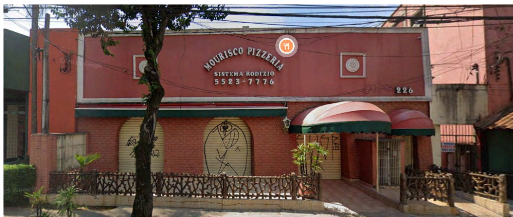
Fachada da Mourisco Pizzeria. Disponível em: Google Street View: dez. de 2024. Acesso em: 19 ago. 2025.