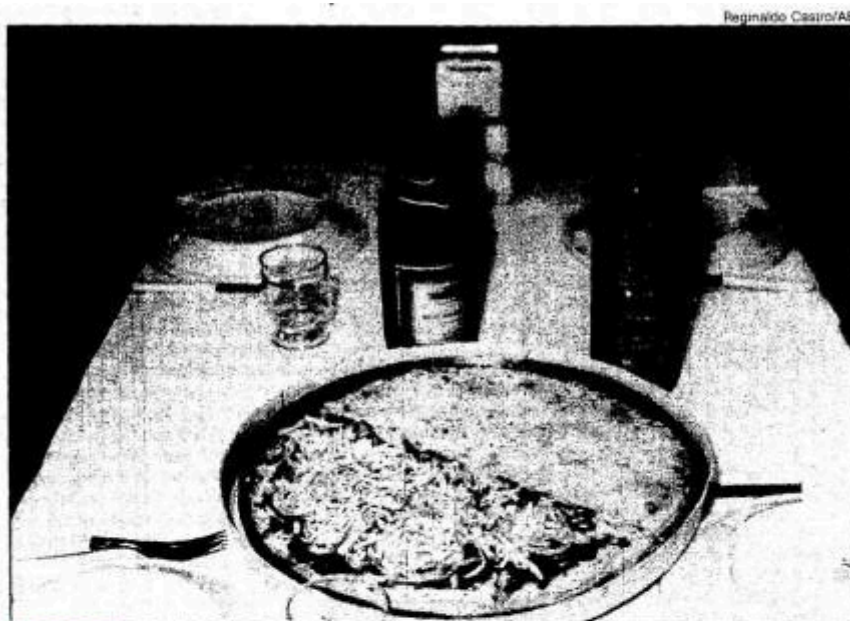
Mourisco: rodízio de pizzas há 25 anos, investe agora em atendimento personalizado