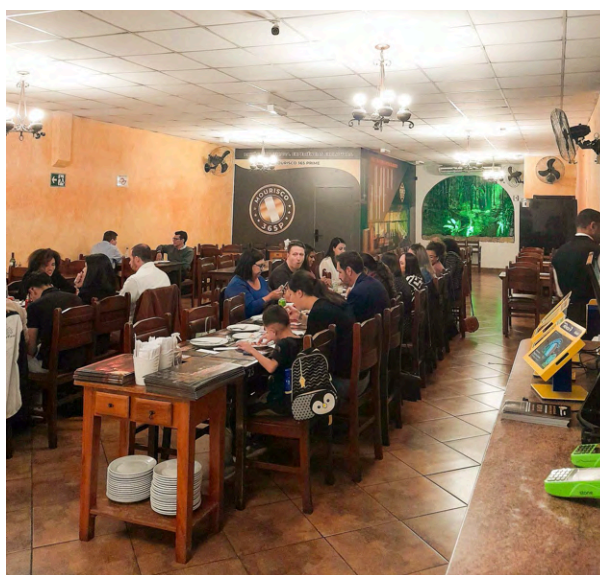
Salão da Pizzeria Mourisco durante um sábado.