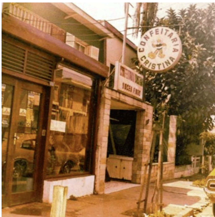
Antiga fachada da Confeitaria. Disponível em: https://confeitariachristina.com.br/nossa-historia/ . Acesso em: ago. 2025.