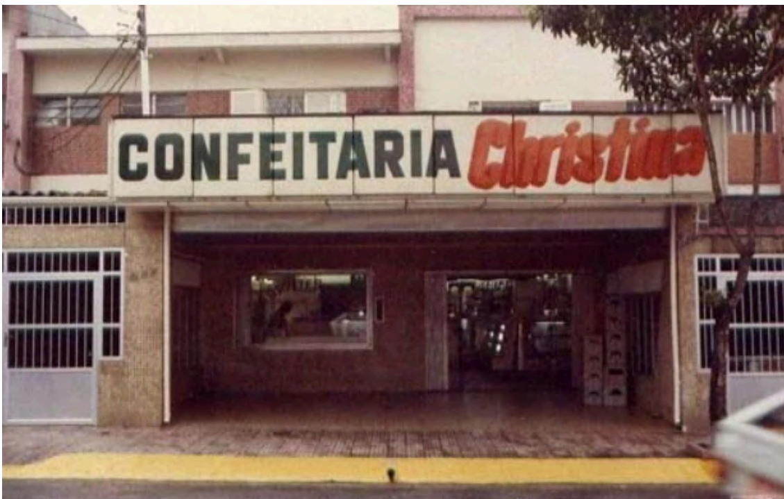
Confeitaria Christina, década de 1980, ainda mantendo a arquitetura da antiga residência.