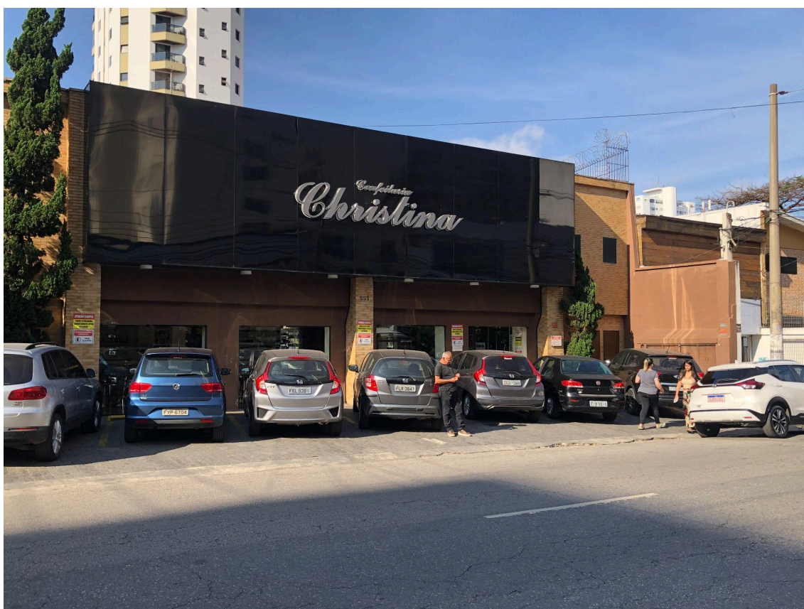
Fachada da confeitaria. Foto: Mariana D'Oliveira (2025).