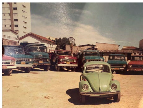
À esquerda, primeiro caminhão da Clipper. À direita, fotografia da frota.