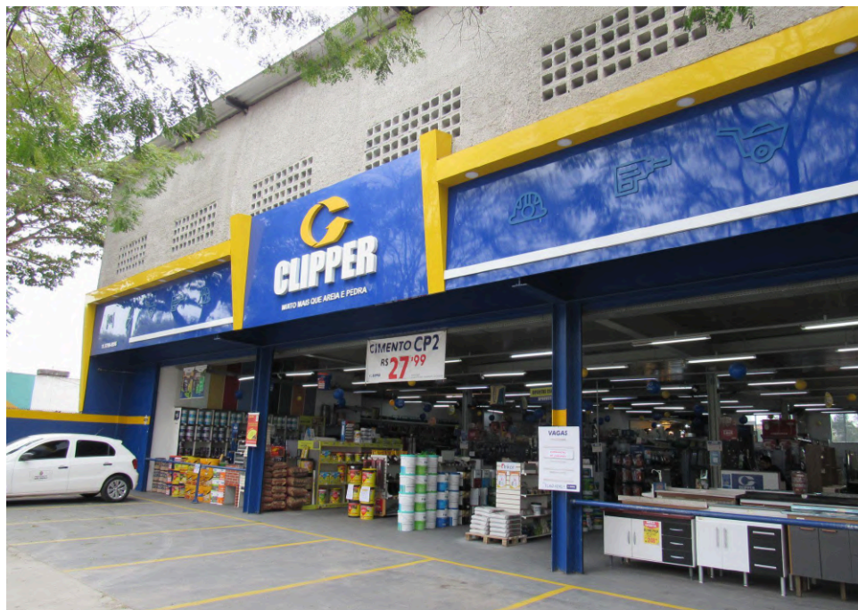
Fachada da Clipper, à Rua Frederico René de Jaegher.

Situada em importante via da região, a Clipper tem por sede uma edificação de dois pavimentos, de aspecto contemporâneo. Na fachada, o letreiro em azul, amarelo e branco emoldura o salão de vendas, que se abre em grandes vãos para a área de