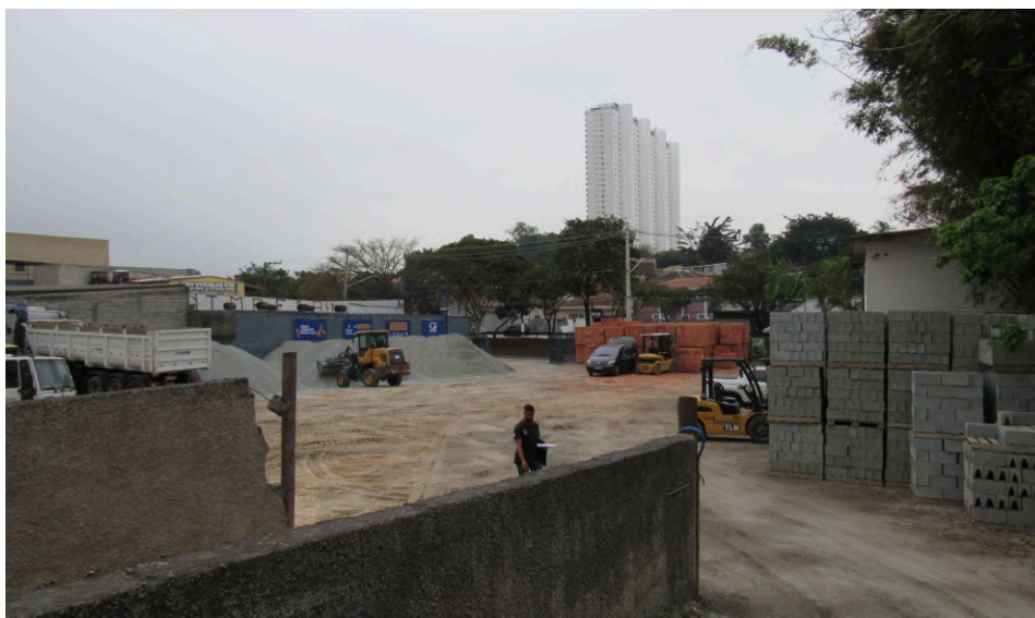
Pátio da Clipper.

estacionamento. No interior, notam-se a estrutura metálica, o uso de lajes pré-moldadas, o piso em revestimento único de cor cinza, além do mobiliário na cor branca, no qual estão expostos os produtos à venda. Na parte posterior do lote, encontra-se o pátio de armazenamento de tijolos, blocos e agregados.