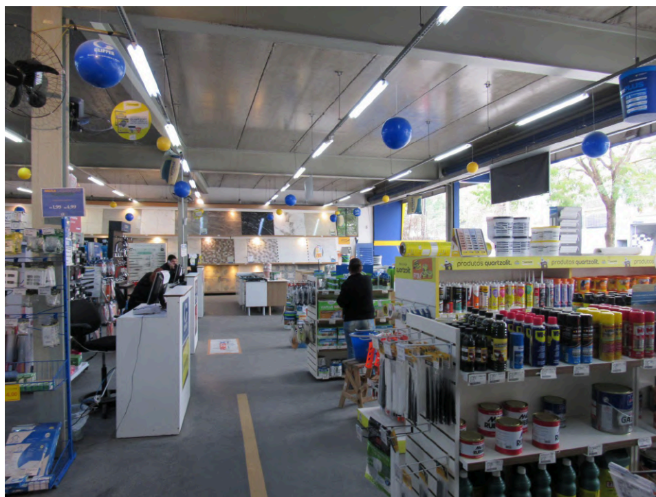
Salão de vendas.