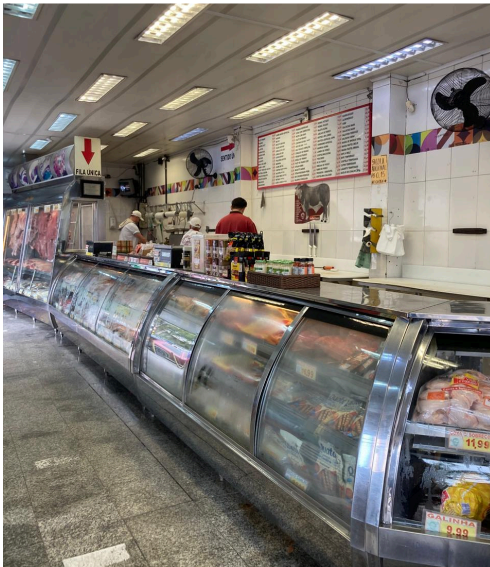
Ambiente interno da Casa de Carnes São José. Foto: Nicole S. S. Macedo (2025).