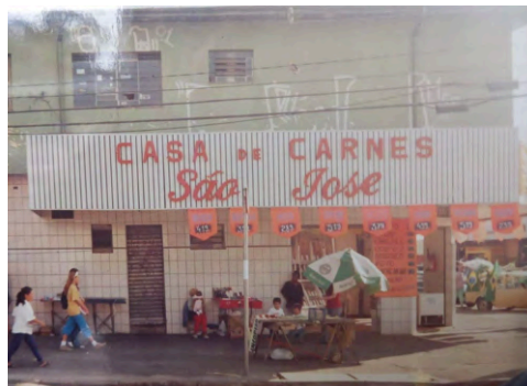
Fotografias do interior e da fachada da Casa de Carnes São José, possivelmente da década de 1990. 266