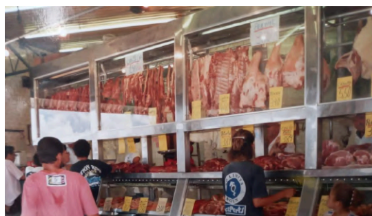
Fotografias do interior da Casa de Carnes São José, possivelmente da década de 1990. 267