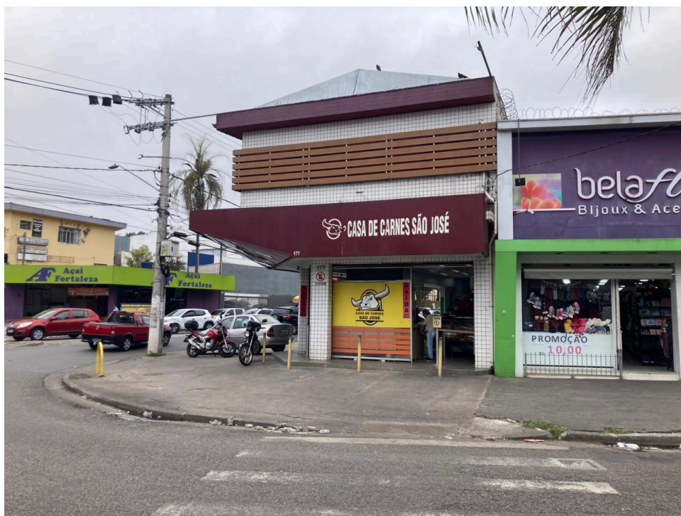
Fachada à Avenida Carlos Oberhuber, na qual se dá a saída dos clientes.