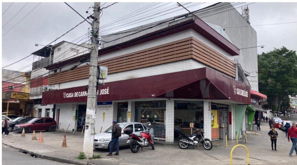
Fachadas da Casa de Carnes Vila São José: mais à esquerda voltada à Rua Rubem Souto de Araújo e mais à direita para a Avenida Carlos Oberhuber.

modificaram as feições da Casa de Carnes São José, mas seu papel no desenvolvimento e na memória do bairro permanece ao longo das décadas.