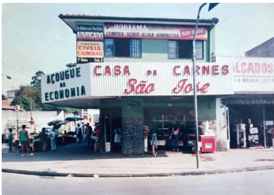
Fotografia antiga da Casa de Carnes São José.