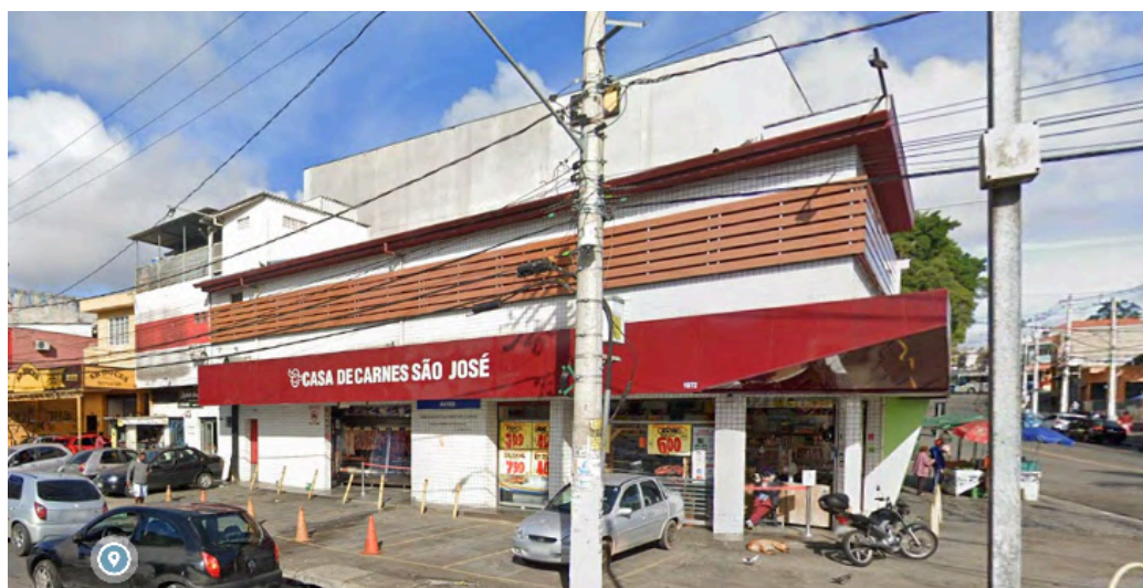
Fachada da Casa de Carnes São José.