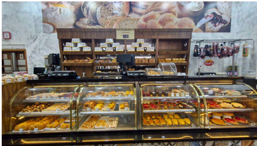
Área dos fundos.