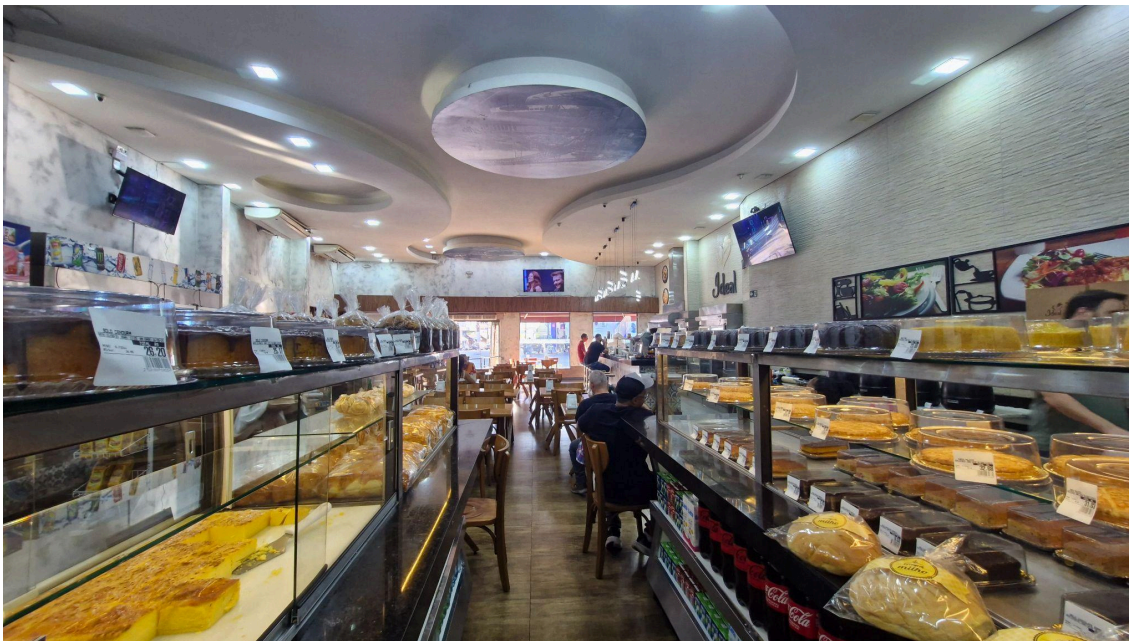
Visão do fundo da padaria para a entrada.