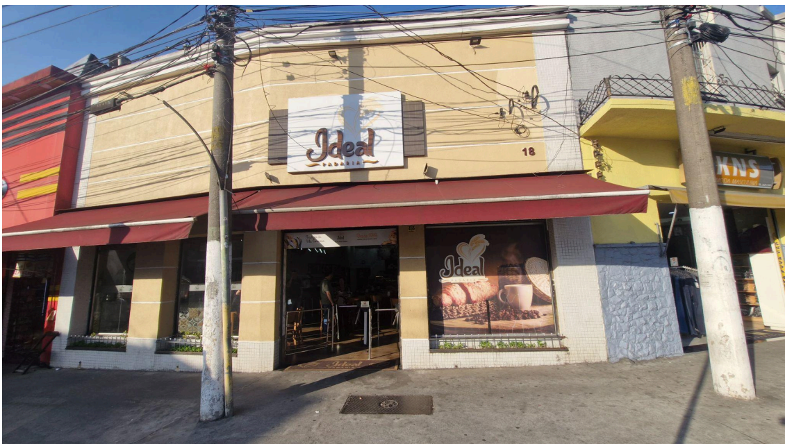
Fachada da padaria.

O estabelecimento é bem amplo e contínuo no que diz respeito às áreas comuns ao cliente, de modo que as únicas divisórias são os balcões de atendimento, como caixa, produção rápida e padaria, e as prateleiras com pães, doces, refrigerantes e bolos. O restante do ambiente conta a disposição de mesas e cadeiras de madeira para atender o público. A parte superior das paredes, conta, de forma distinta, com alguns quadros sobre alimentos, ares condicionados e televisões. Para a entrada e saída é necessário passar por duas catracas, mas não há liberação por comanda ou algo do tipo.