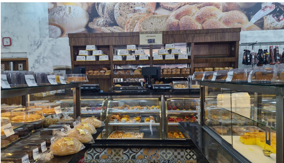
Corredor central da padaria.