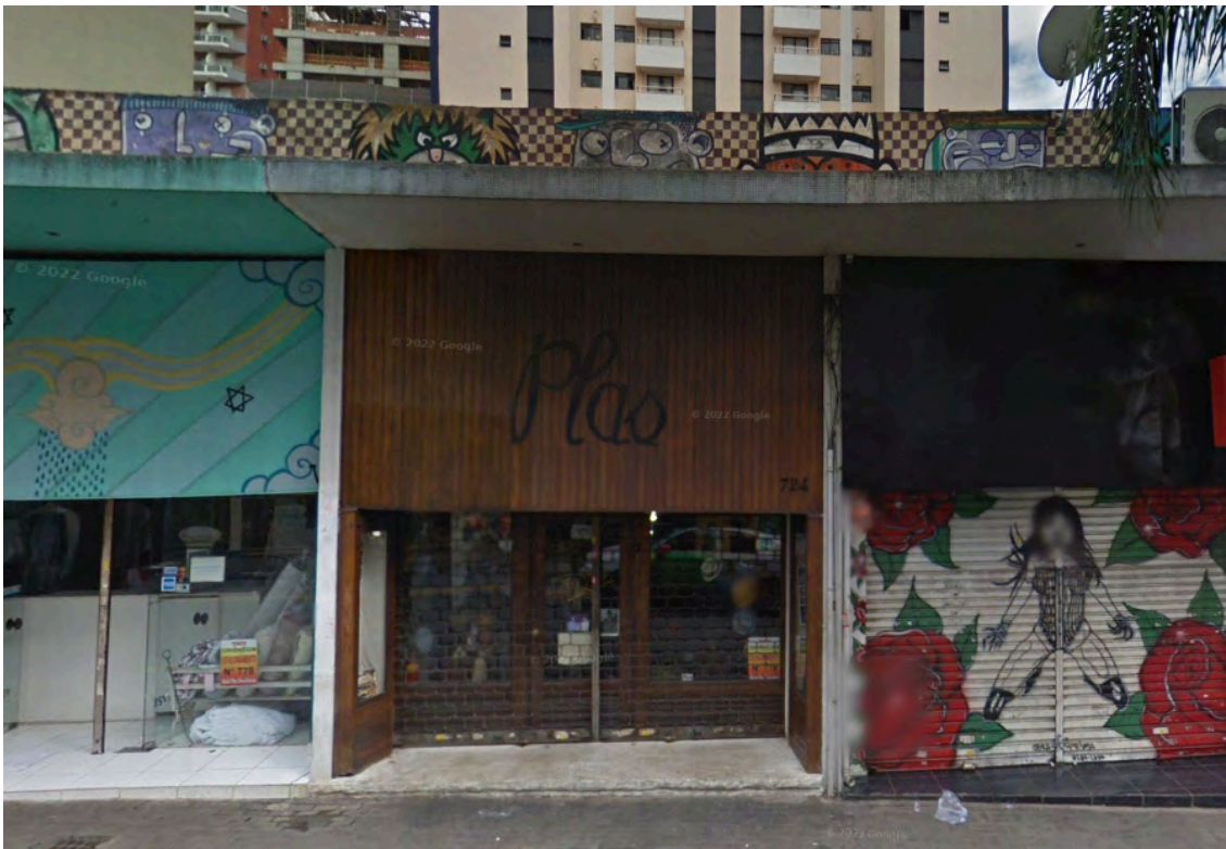
Fachada da Antiga Loja Plas, em seu tradicional endereço na Rua Augusta, em 2010.