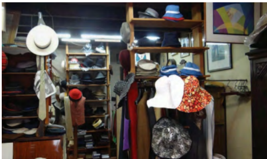
Interior da Antiga Loja Plas, em seu tradicional endereço na Rua Augusta.