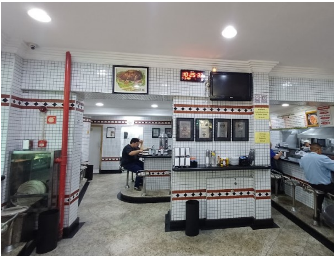
Figs. 10 e 11: Interior do Estadão atualmente. Foto: Marcelo Leite, 04/03/2026.

Segundo Bruno Zonta, no ano de 1975 ocorreu a primeira reforma e ampliação do estabelecimento, quando foi adquirido o imóvel vizinho, à época ocupado por outro comércio. O mesmo ocorreu em 1987 (figs. 12 a 18) e em 2002, quando o Estadão assumiu o tamanho e a decoração atuais. No final de 2025, o restaurante começou a utilizar para servir seus lanches e refeições um guardanapo que remete aos tradicionais azulejos do salão da lanchonete, com capacidade para cerca de quarenta pessoas sentadas. Em dias de maior movimento, com pessoas em pé no salão ou na parte externa do Estadão , a capacidade total de clientes pode chegar a cem pessoas.