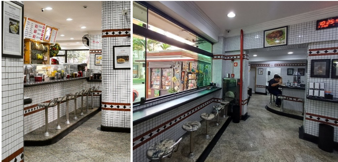
Figs. 8 e 9: Interior do Estádio atualmente.