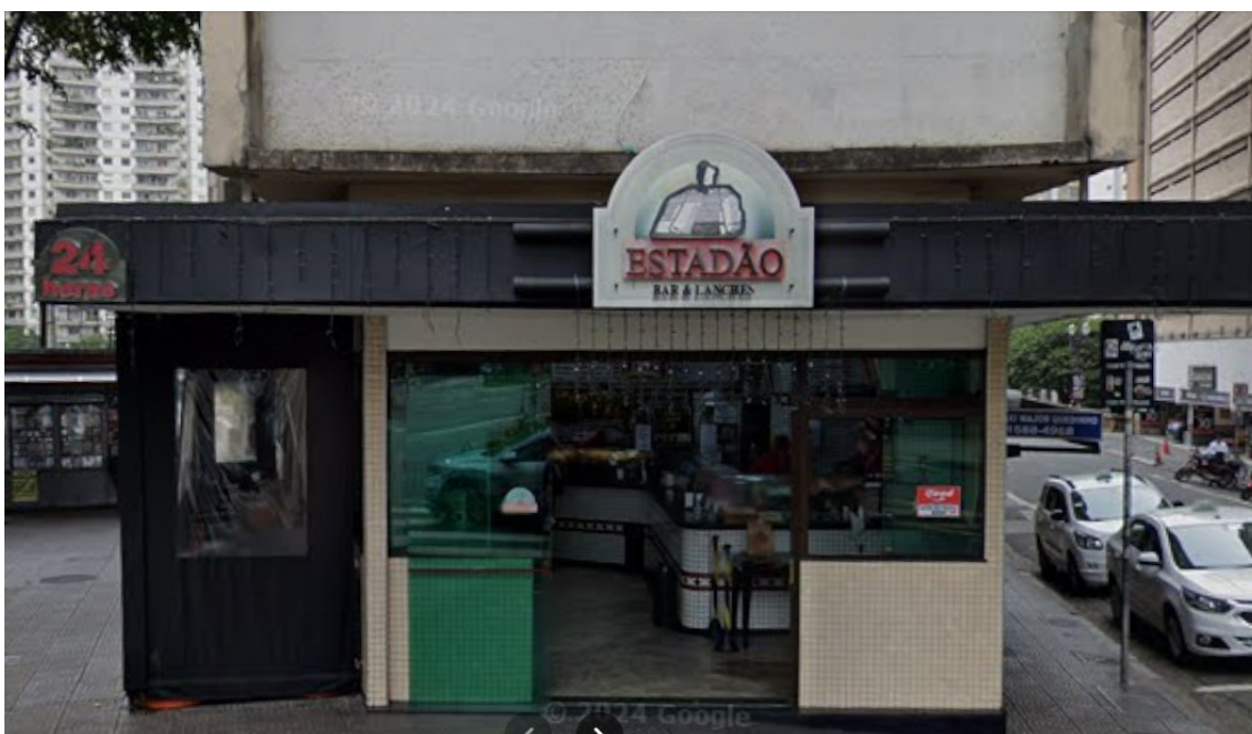
Fachada do Estadão Bar & Lanches. Fonte: Google Maps. Acesso em: 16 jan. 2026.