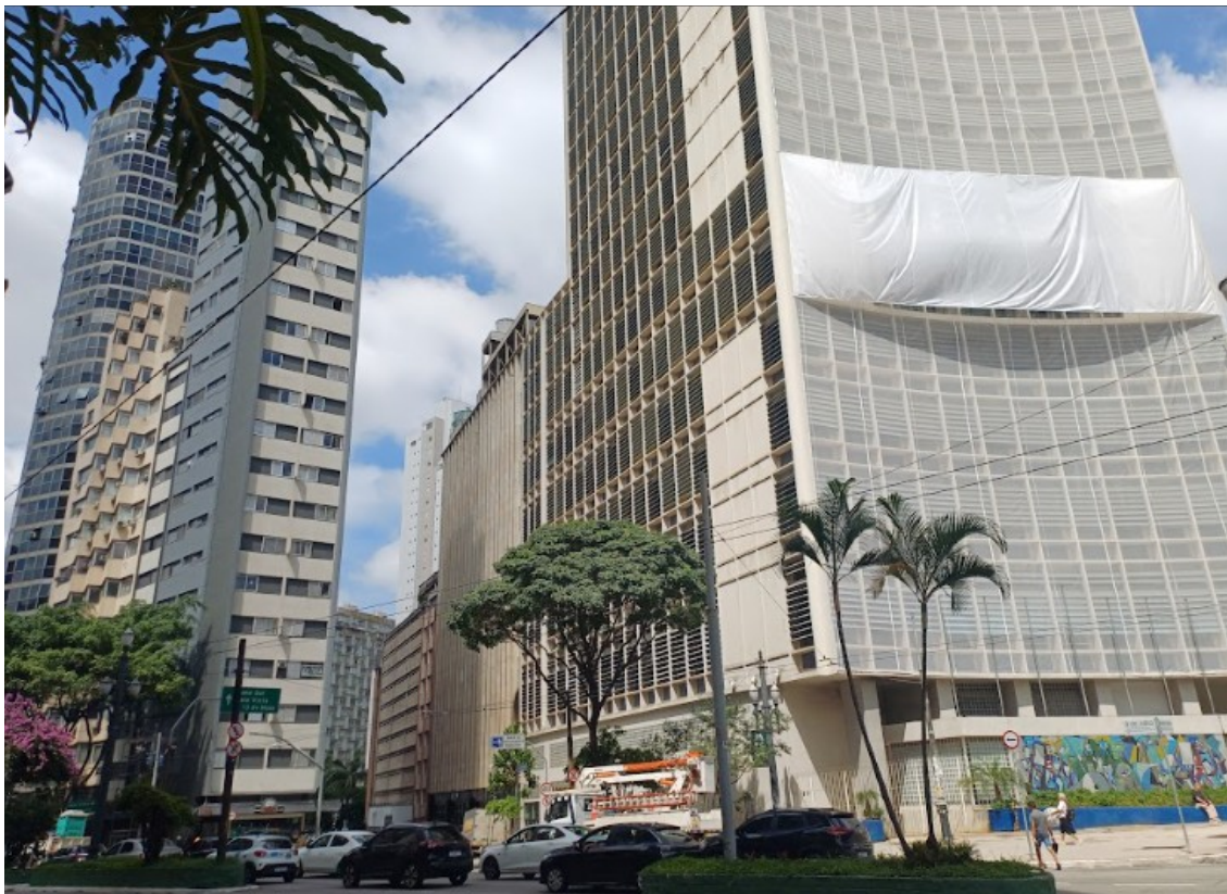
Edifício do Estádio Bar & Lanches (à esq.) e antiga sede do jornal Estádio (à dir.).

muitos jornalistas no espaço, que vinham para cá finalizar e encadernar suas pautas, manualmente, todas as madrugadas” (TODOS PELO CENTRO, 2023, s/p).