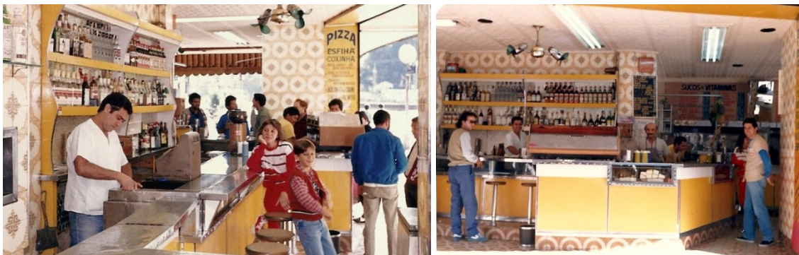
Figs. 12 e 13: Interior do Estádio , possivelmente em junho 1987.