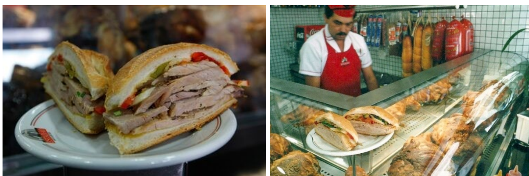
Fig. 4: O famoso sanduíche de pernil do Estadão.

Ainda conforme o seu site oficial, “tão famoso quanto saboroso, o sanduíche de pernil [fig. 4] é o carro chefe do Bar & Lanches Estadão [...] é, com toda certeza, o item mais procurado no dia a dia do Estadão . São mais de 30 peças de pernil consumidas por dia, sendo que cada uma delas pesa em média entre 7 kg e 8 kg [fig. 5]”. A carne é preparada em um “molho feito com cebola, tomate e pimentão”.