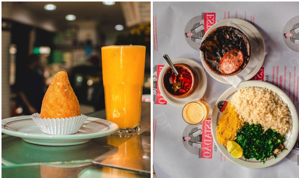
Fig. 6: cozinha e suco de laranja do Estadão . Fig. 7: feijoada do Estadão .

podem desfrutar de uma cartela de sucos, vitaminas, drinks e cervejas geladas, que complementam a experiência gastronômica” (TODOS PELO CENTRO, 2023, s/p).