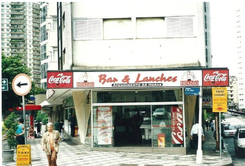
Figs. 16 a 18: Interior e exterior do Estadão , provavelmente nos anos 1990.