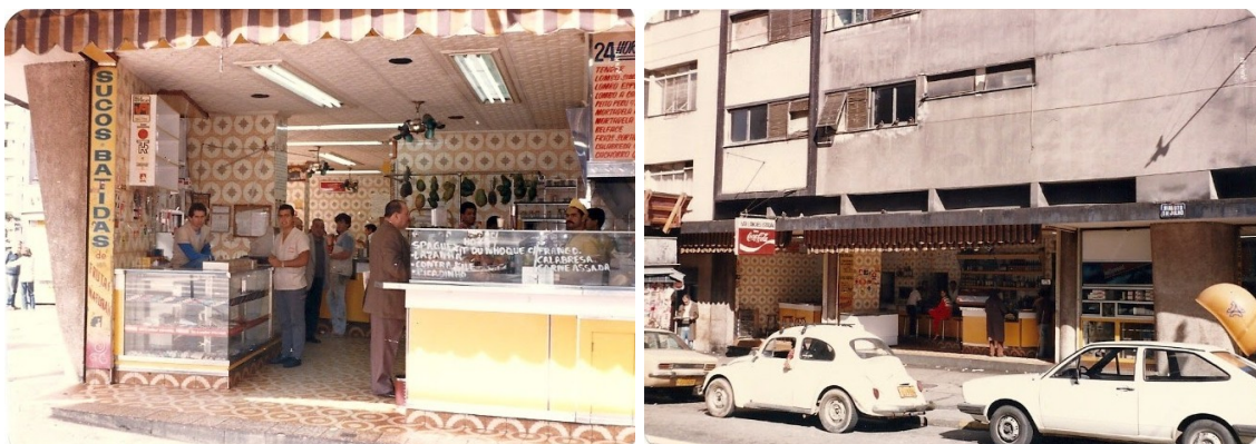
Figs. 14 e 15: Interior e exterior do Estádio , possivelmente em junho 1987.