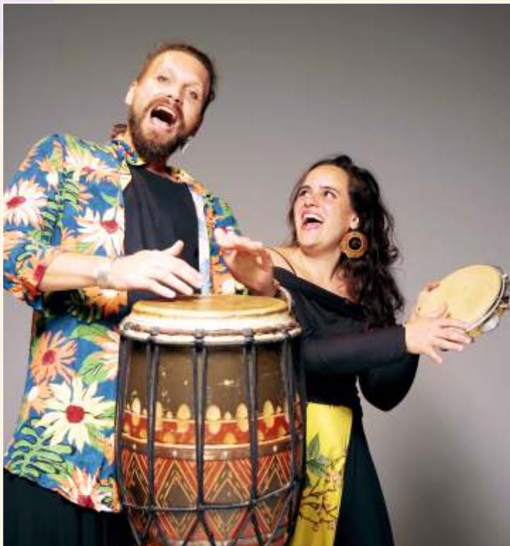
O Boi que Dançou com as Estrelas