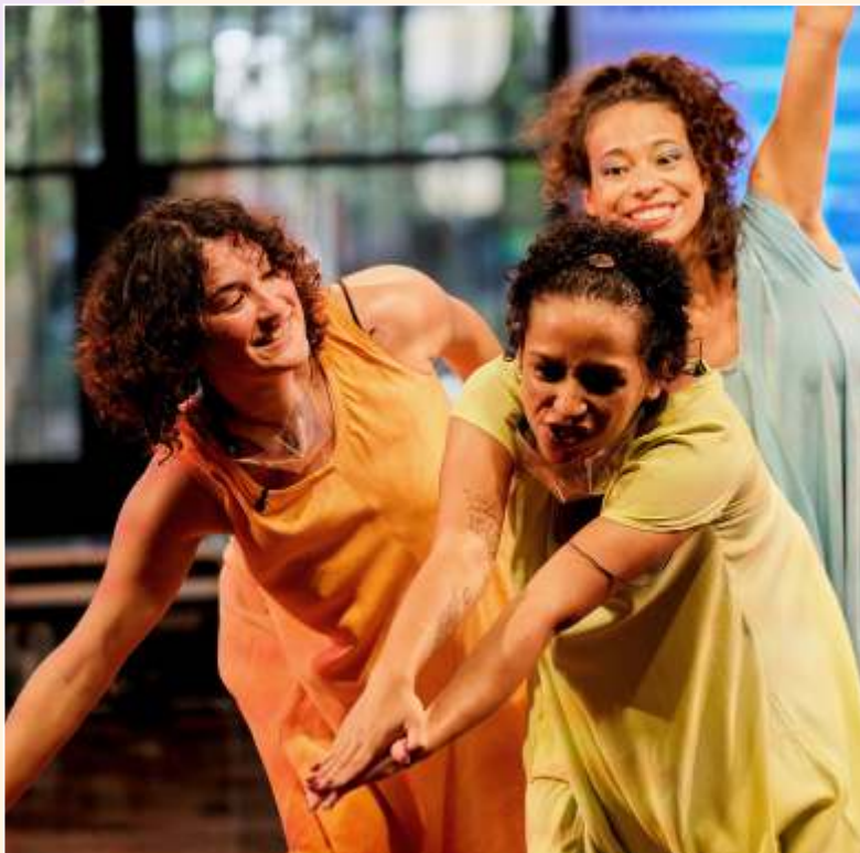
Histórias de Bumbá