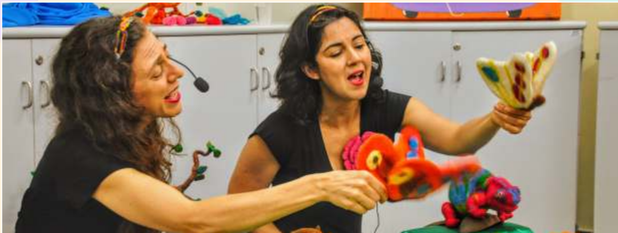
Viagem na Floresta