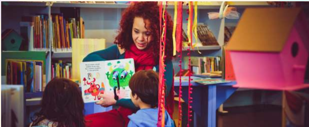
Cia. Passarinho Contou