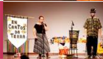
CONTAÇÃO DE HISTÓRIAS O boi que dançou com as estrelas Cia. Encantos da Terra