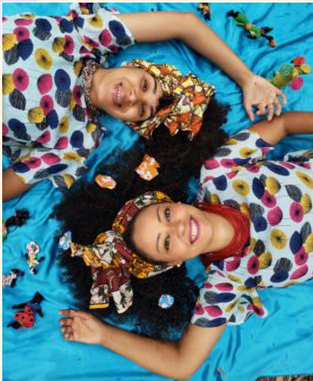
Nas Águas de Nanã