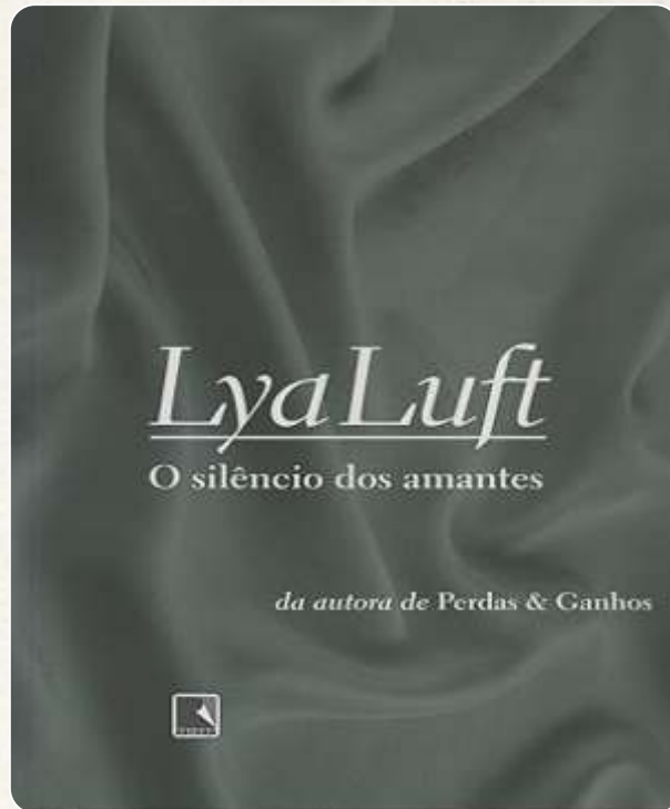
O Silêncio dos Amantes

https://bibliotecacircula.prefeitura.sp.gov.br/pesquisa/resulta.do.jsf#ini&sort=relevancia&e_autor=Lya+Luft&page=1