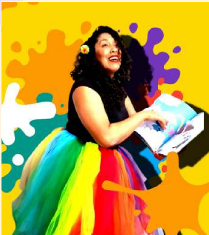
Peixe que Dorme, a Poluição leva!!