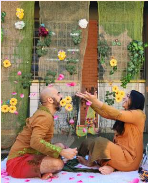
O Jardim dos Bebês