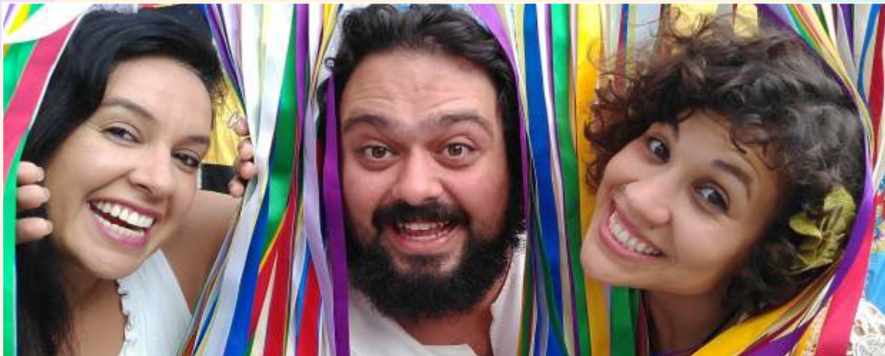
Para que Serve um Livro?