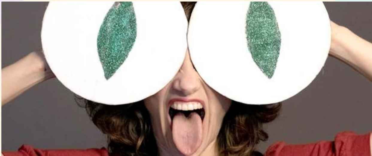
Cia. Pé do Ouvido