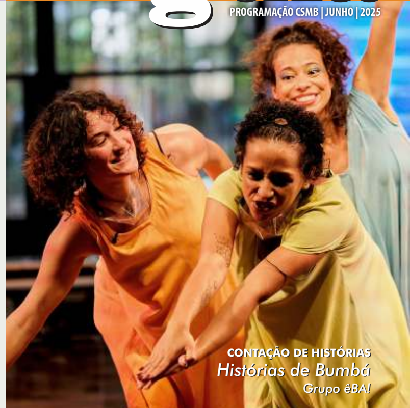
CONTAÇÃO DE HISTÓRIAS Histórias de Bumbá Grupo éBA!