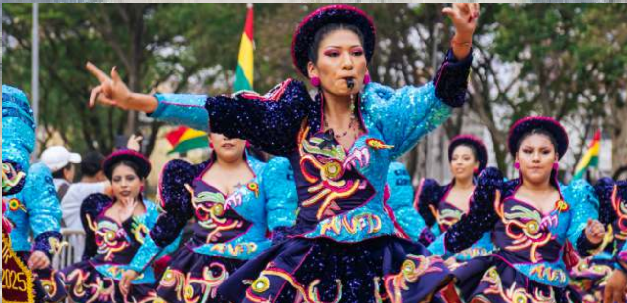
Cortejo: Cores e Sons do Bicentenário da Bolívia