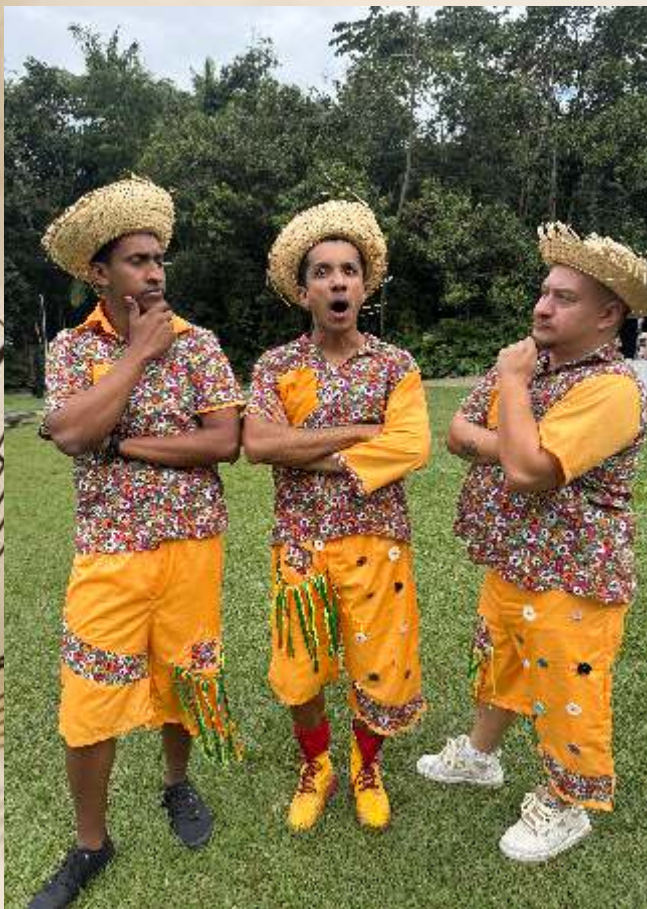
Dominguinhos e o legado de Luiz Gonzaga para Crianças