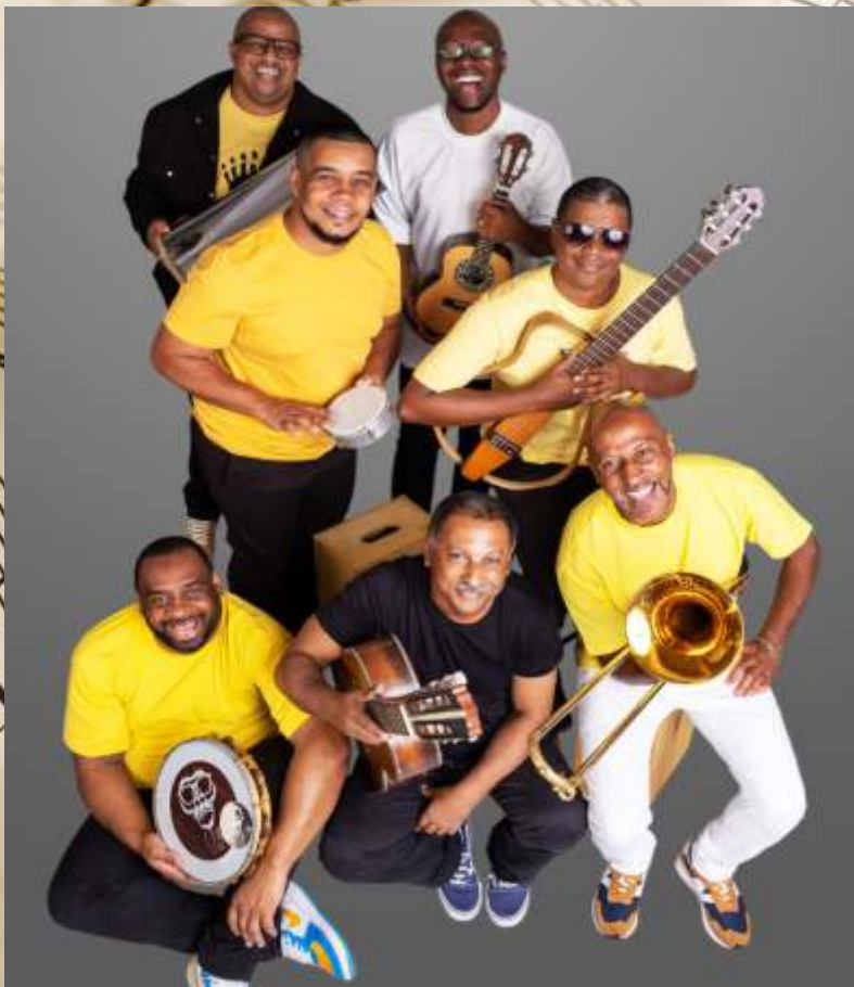
Samba e Mania da Gente