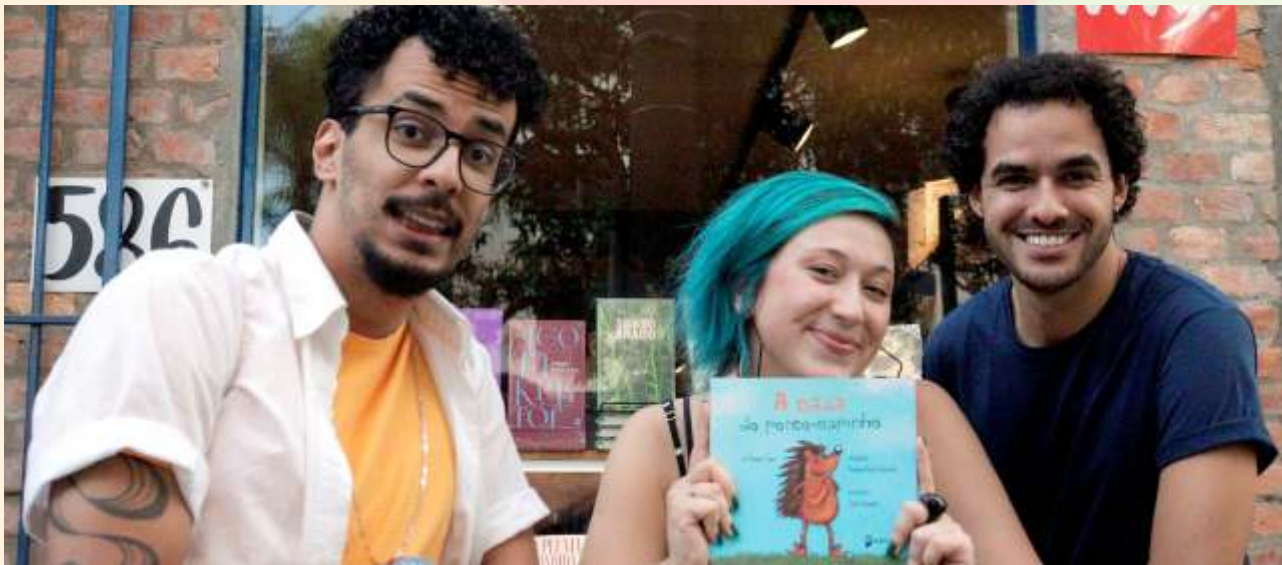
A Casa do Porco-Espinho