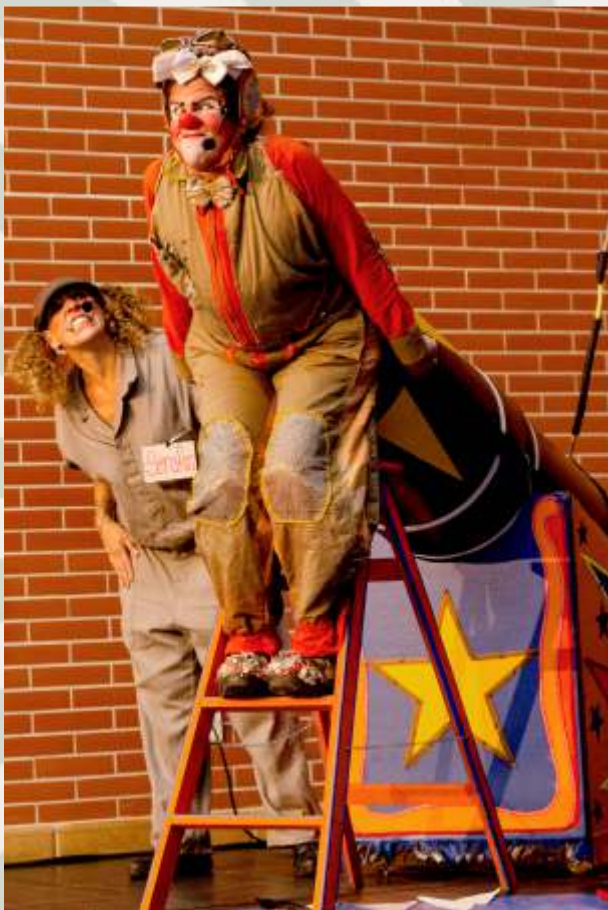
A Mulher Bala