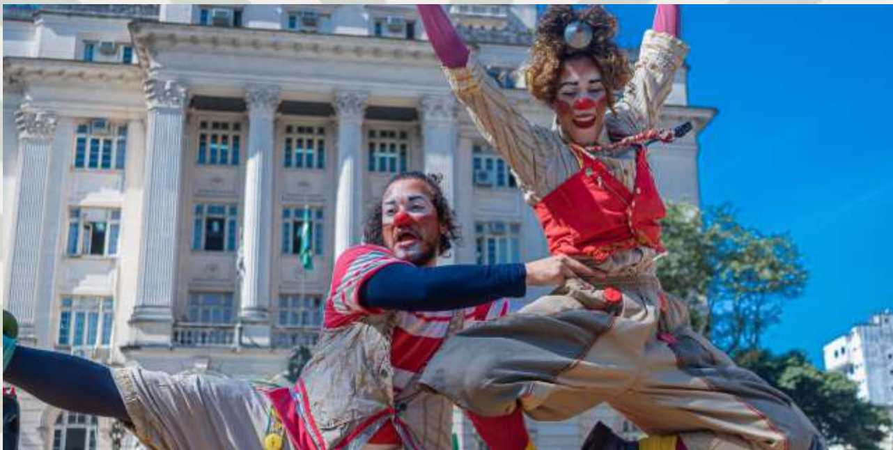
A Trombeta Apocalíptica