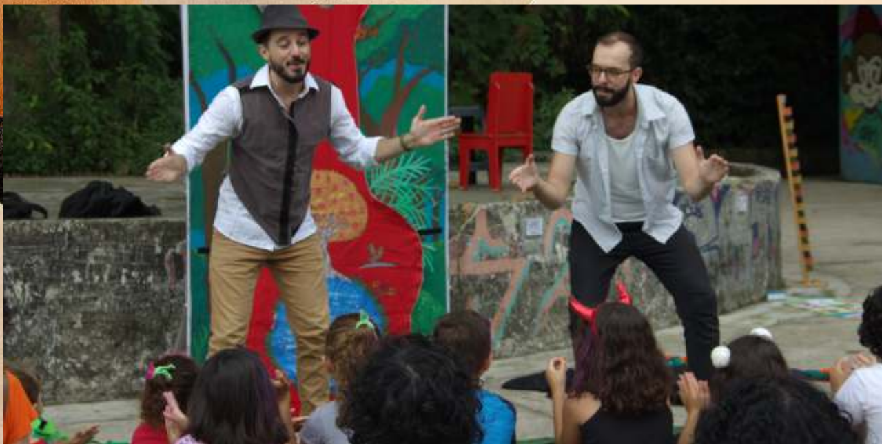
Vila Arte do Brincar