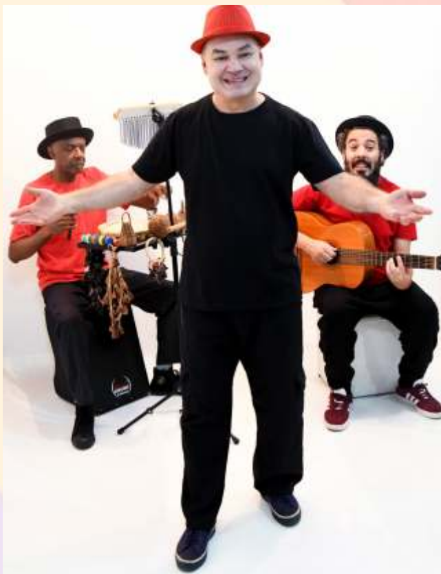
Contos de Natal