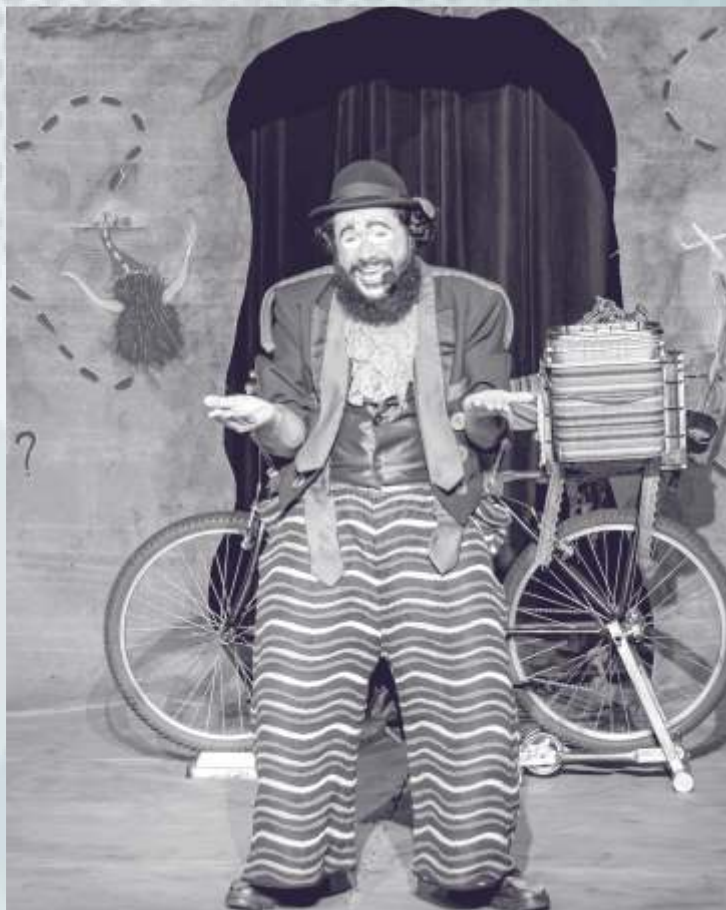
A Viagem do Jiló

Jiló está de malas prontas e bike equipada rumo a investigar a “tal fake news” de que a maior festa do Brasil, o carnaval de Olinda, não existe mais. Logo no início do trajeto ele ganha como parceiro um Cão Caramelo, aparentemente comum, mas que vai se revelando pouco a pouco muito importante para tornar essa viagem mais diversa, leve e, claro, divertida! O espetáculo é uma grande homenagem a identidade plural brasileira, mesclando o circo tradicional com números clássicos, explorando uma musicalidade original e técnicas do teatro de animação e bonecos, que dão vida à personagens inimagináveis.