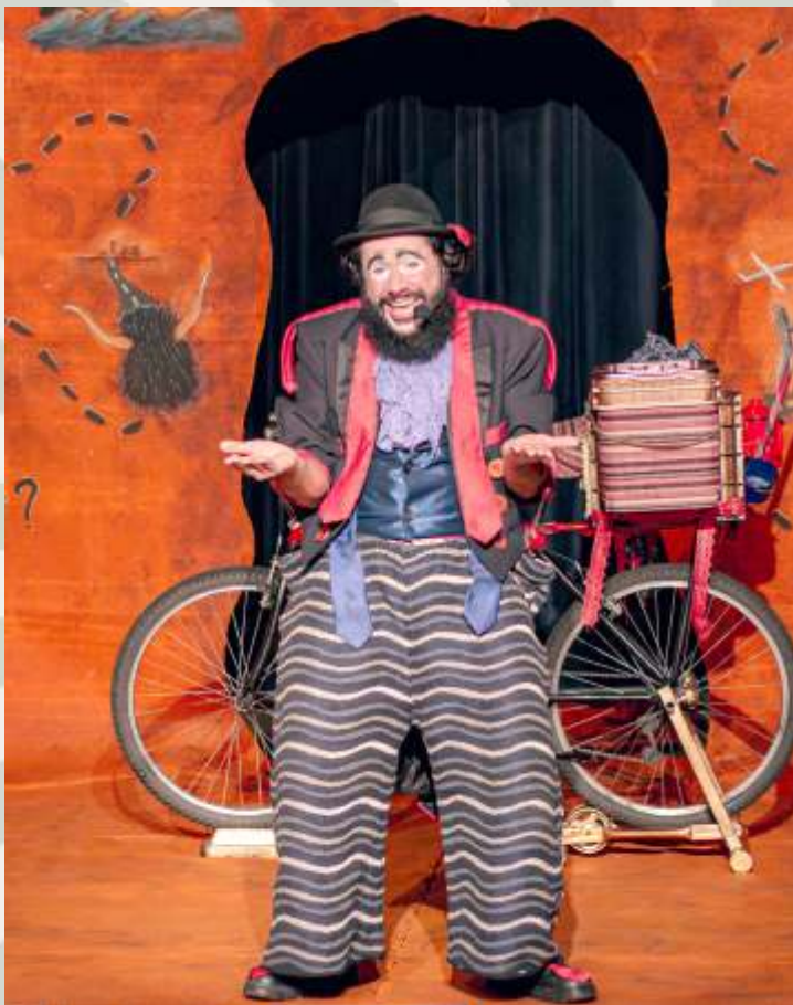
A Viagem do Jiló