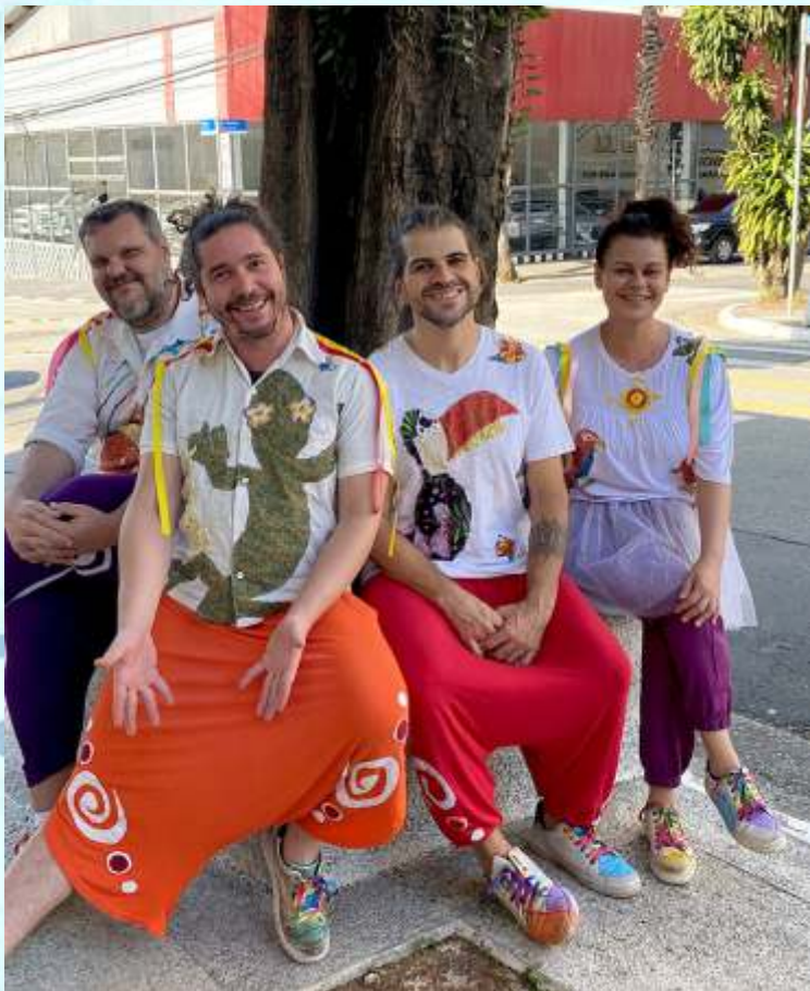
Micaretinha Rocambolé - A festa na floresta