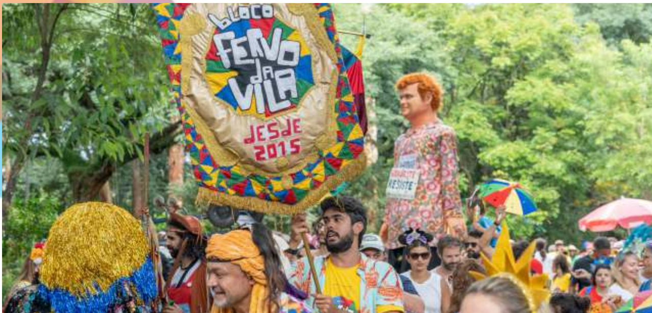
Bloco Frevo da Vila