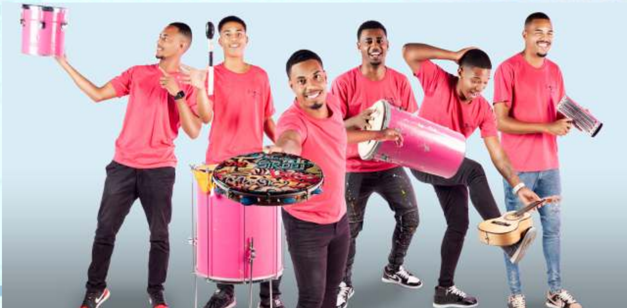
Roda de Samba