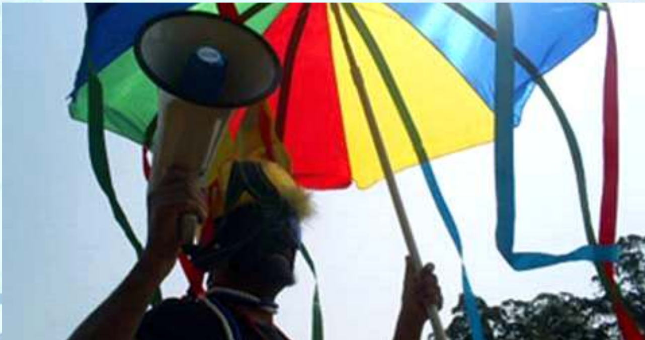
Folia Pede Passagem