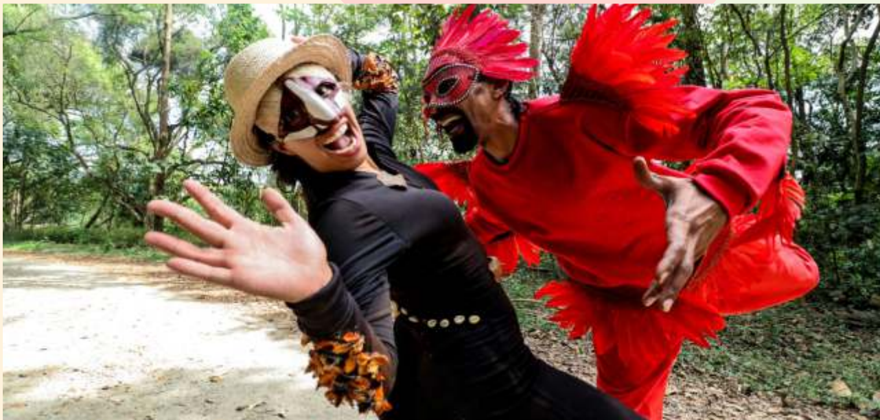
No Mangue tem Frevo