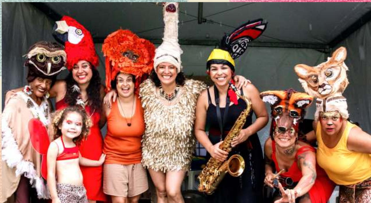
A Sussuarana na Roda com a Bicharada