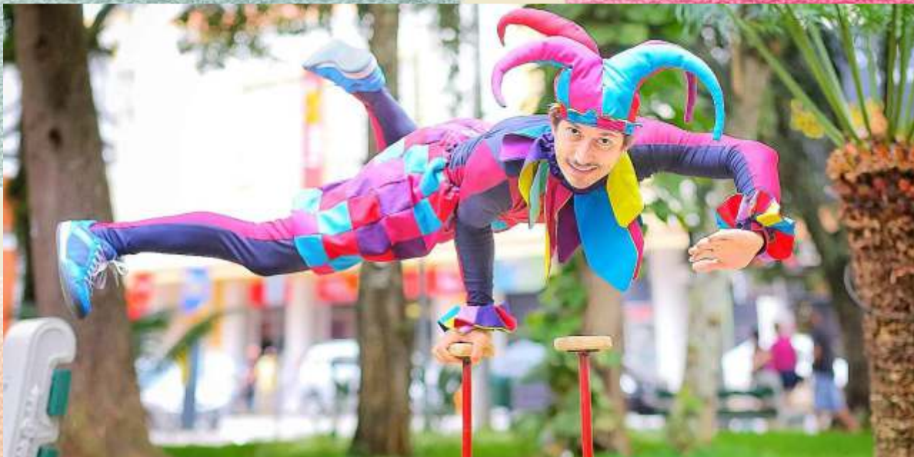
Circo e Folia: Memórias de Carnaval