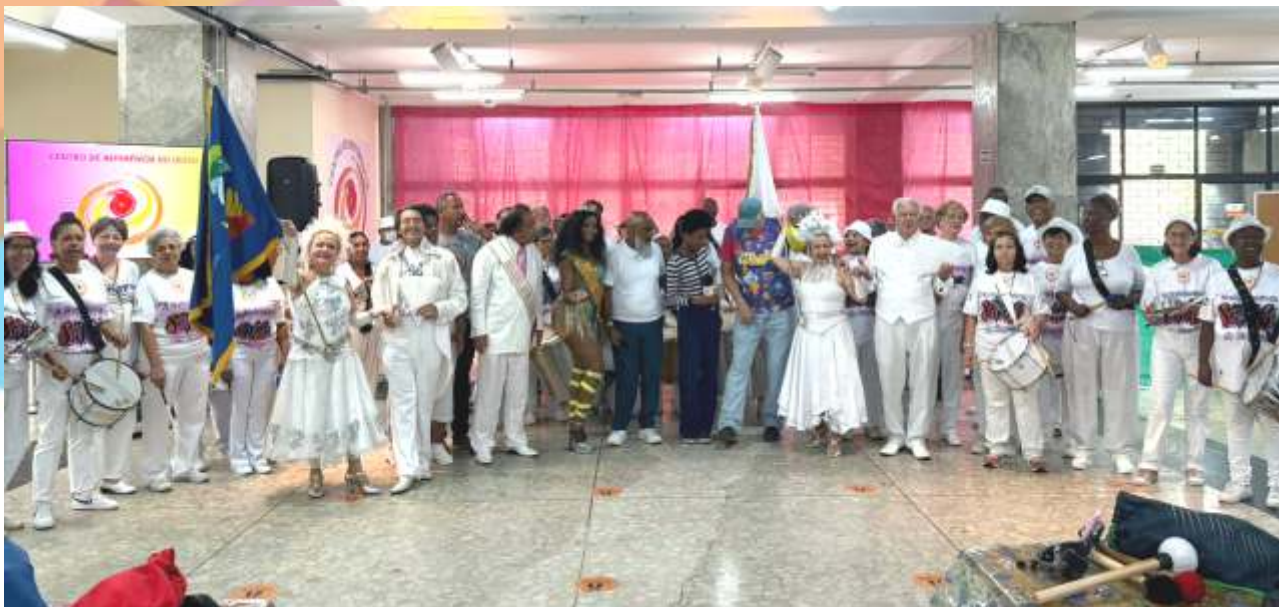
Bloco Unidos da Melhor Idade