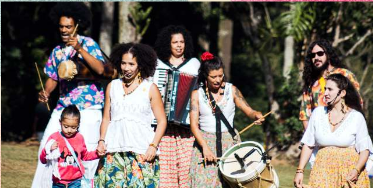
Movimento Vem Brincar Cacuriá