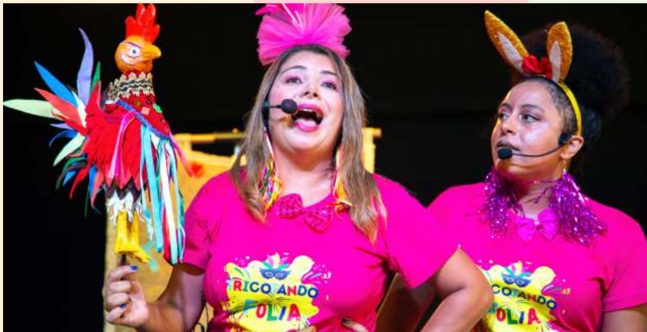
Tricotando Contos de Carnaval