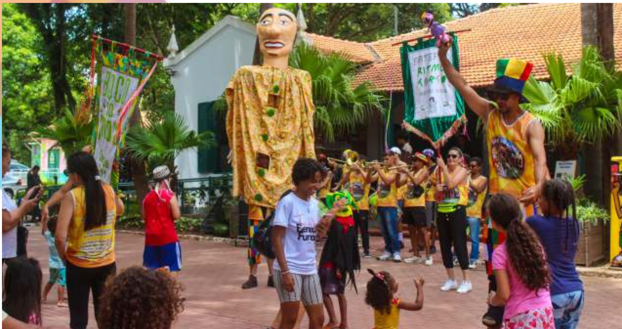
Jatobazinhos para crianças