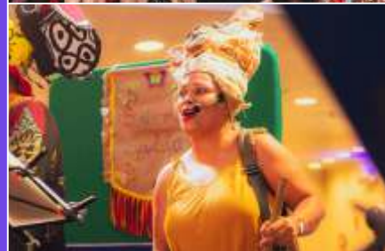
A Sussuarana na Roda com a Bicharana