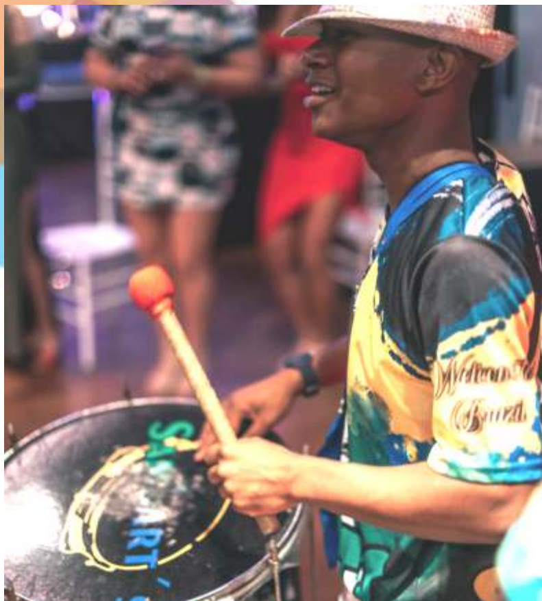
Bloco de Carnaval Sambart's