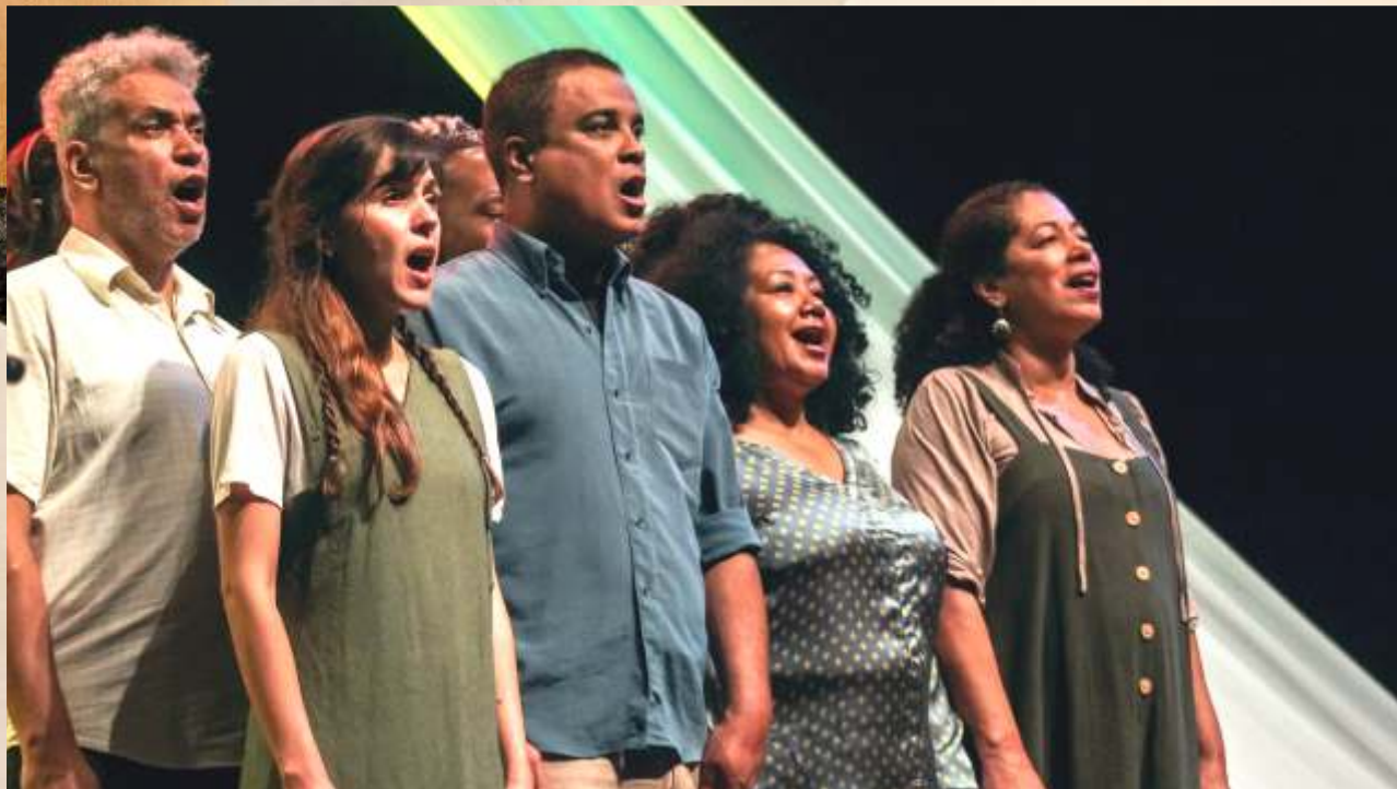
Samba de Todas as Bossas