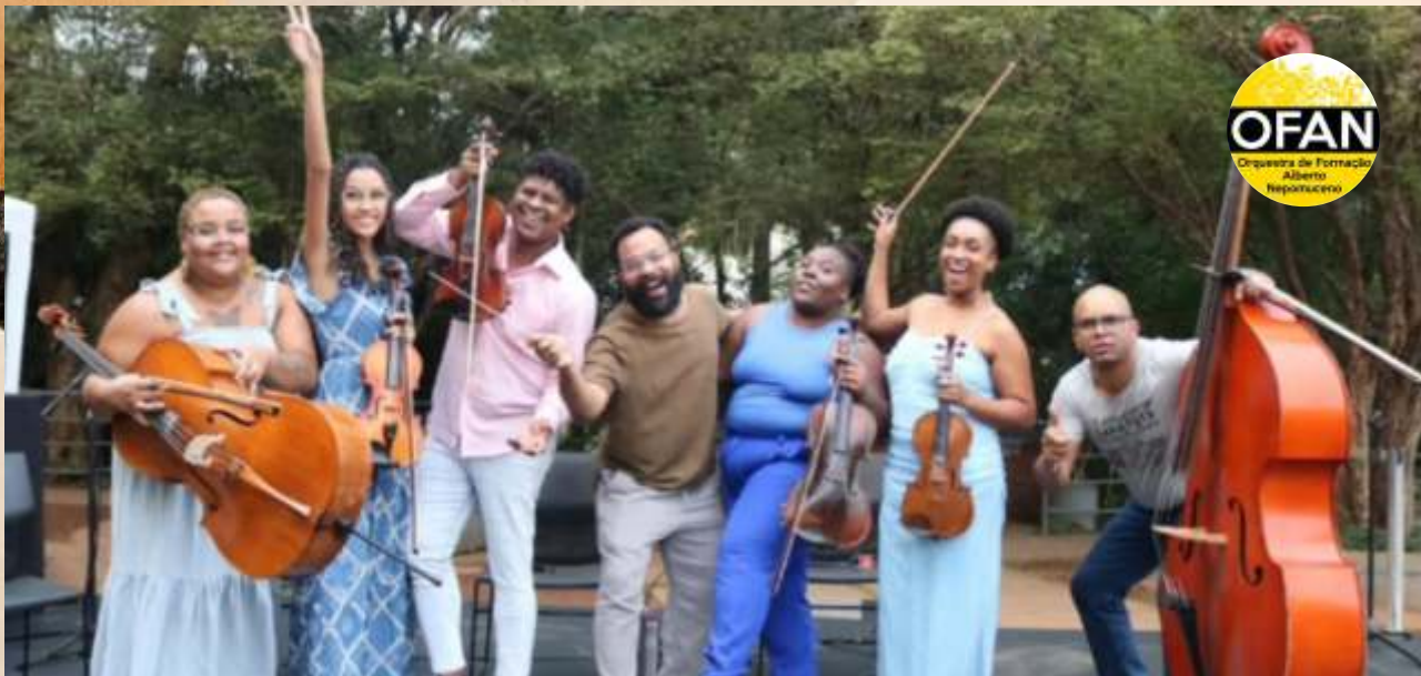
Brincando de Orquestra