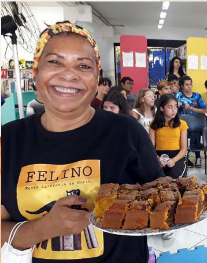
Sarau Memórias, Chá, Bolo e Poesia