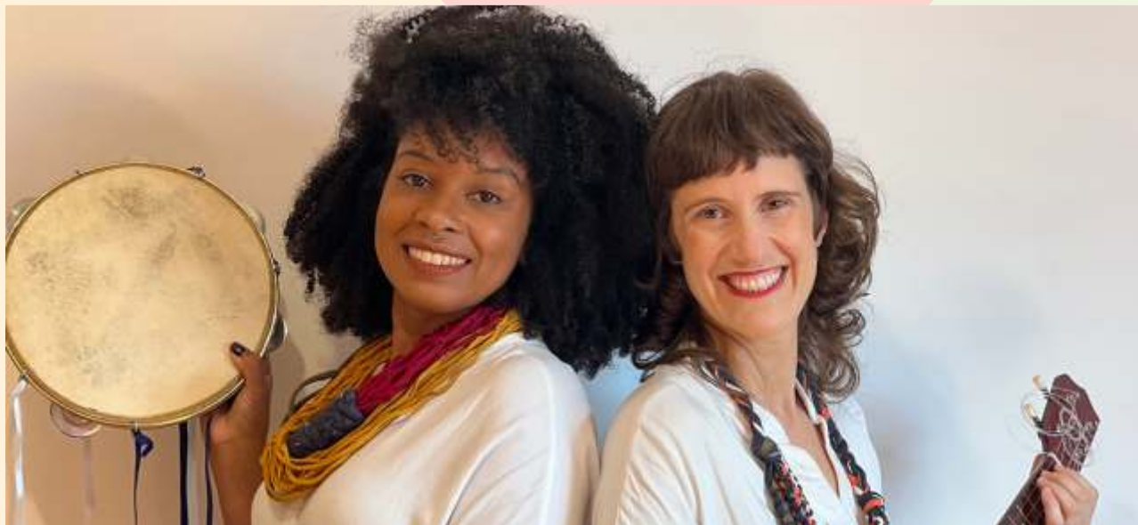
Contos e Encantarias Africanas