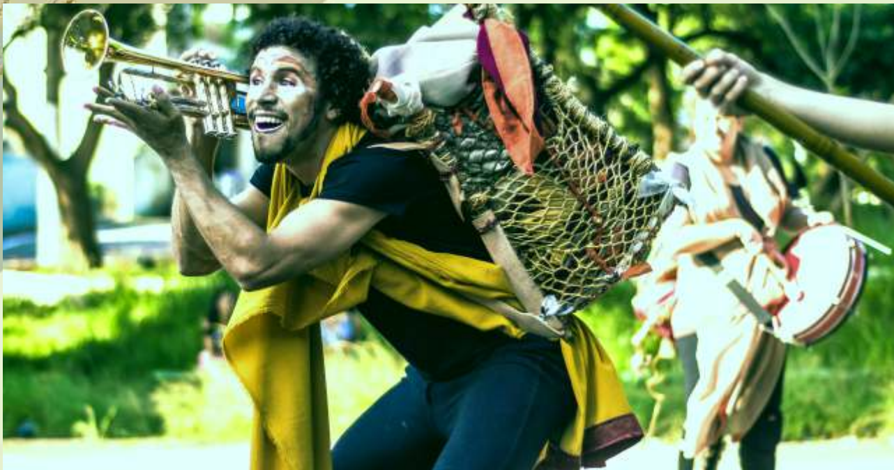
Pelas Ordens do Rei Que Pede Socorro