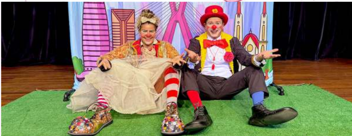
Um Aniversariante Inusitado