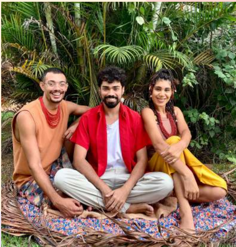
Afrografias e Memórias: Contando São Paulo