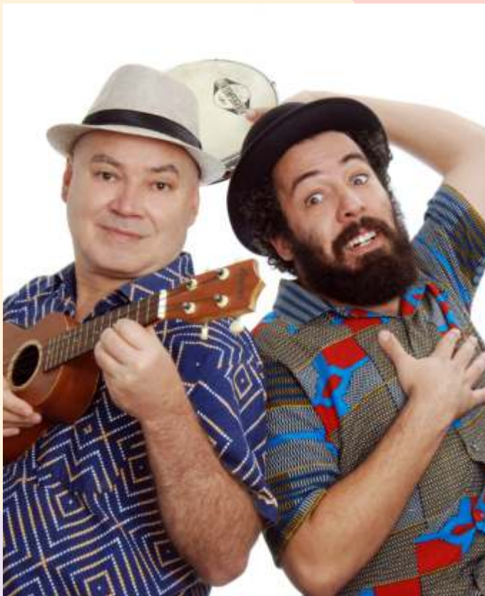
Fantasma da São Paulo Antiga