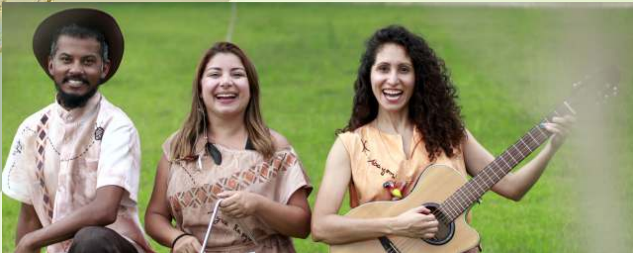
Voando nas Memórias