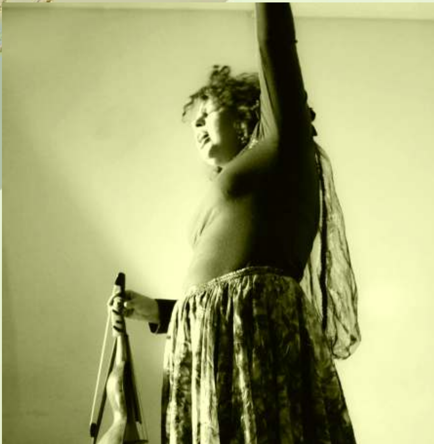
O Encantamento da Rabeca