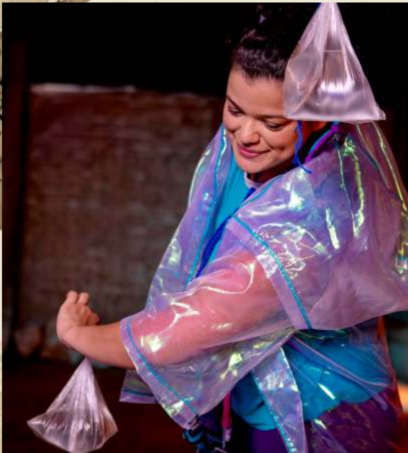
Breve Dança para um Rio