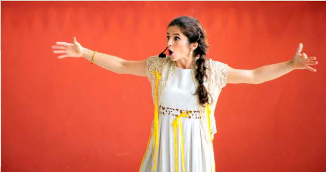
Histórias de Boca