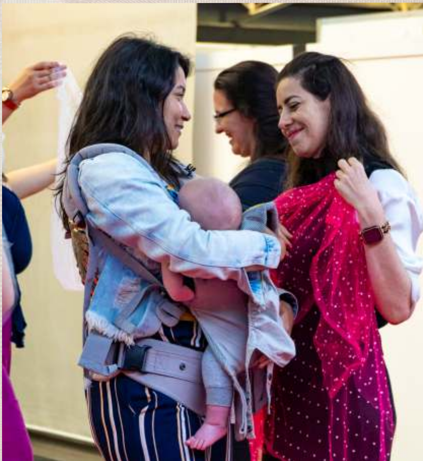
Dança Materna para famílias e bebês