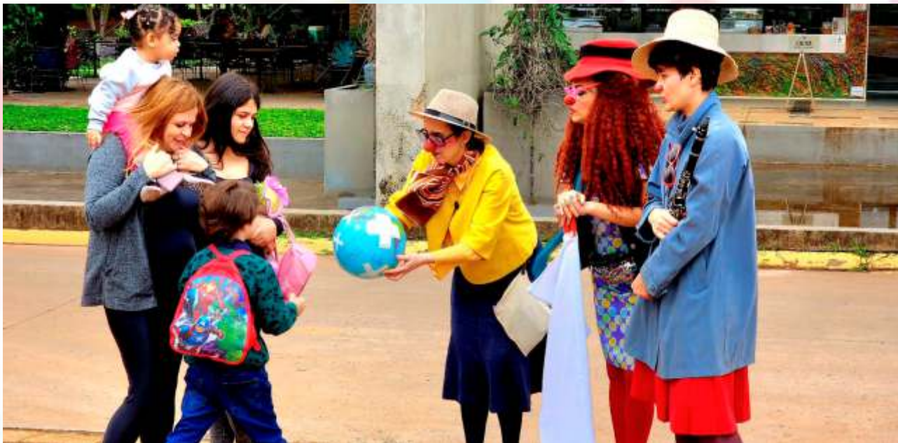
Missão: O Mundo Caiu!