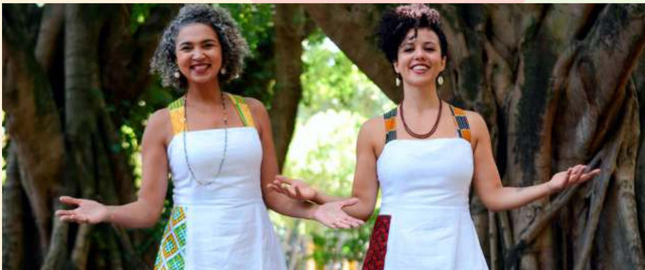
Dikeledi e as Voltas que o Mundo dá