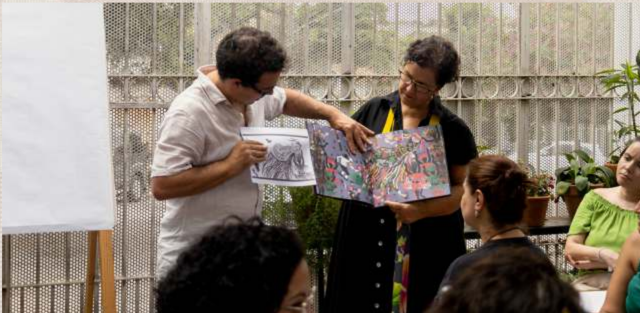
Narrativas Brasileiras, uma viagem pelos biomas