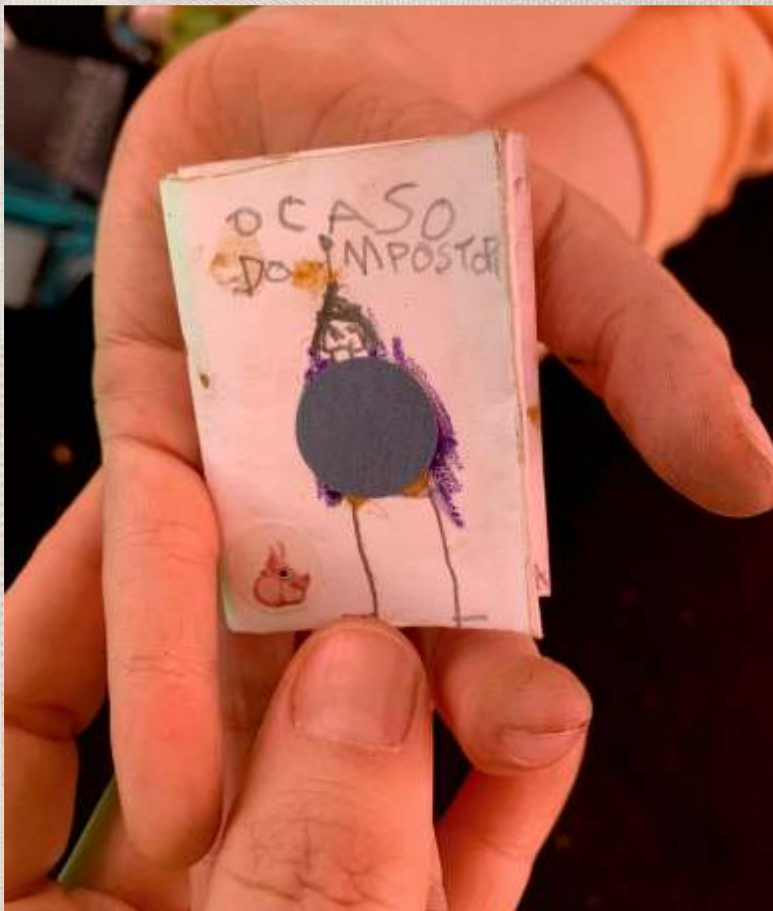
Uma História Conta Outra