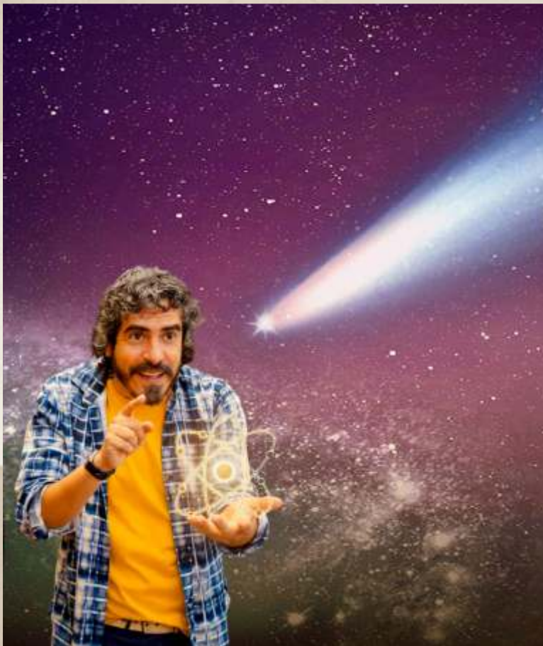
Ciência em Histórias