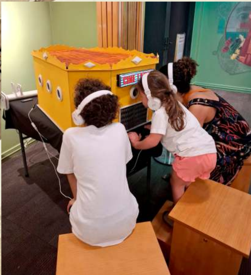
Cine Lambe - O Vento lá fora