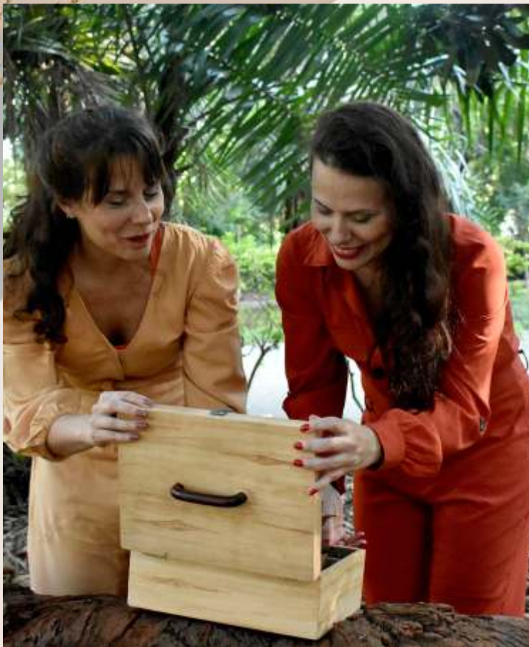
Entre Sopros de Palavras e Miudezas