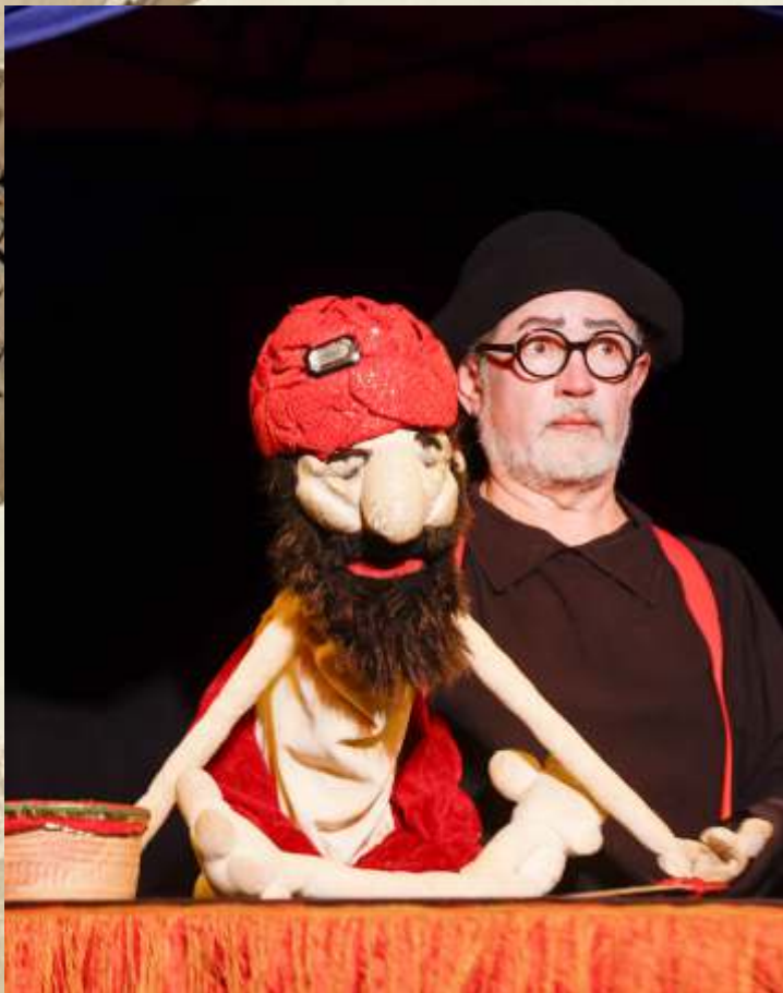
Circus - A Nova Tournée