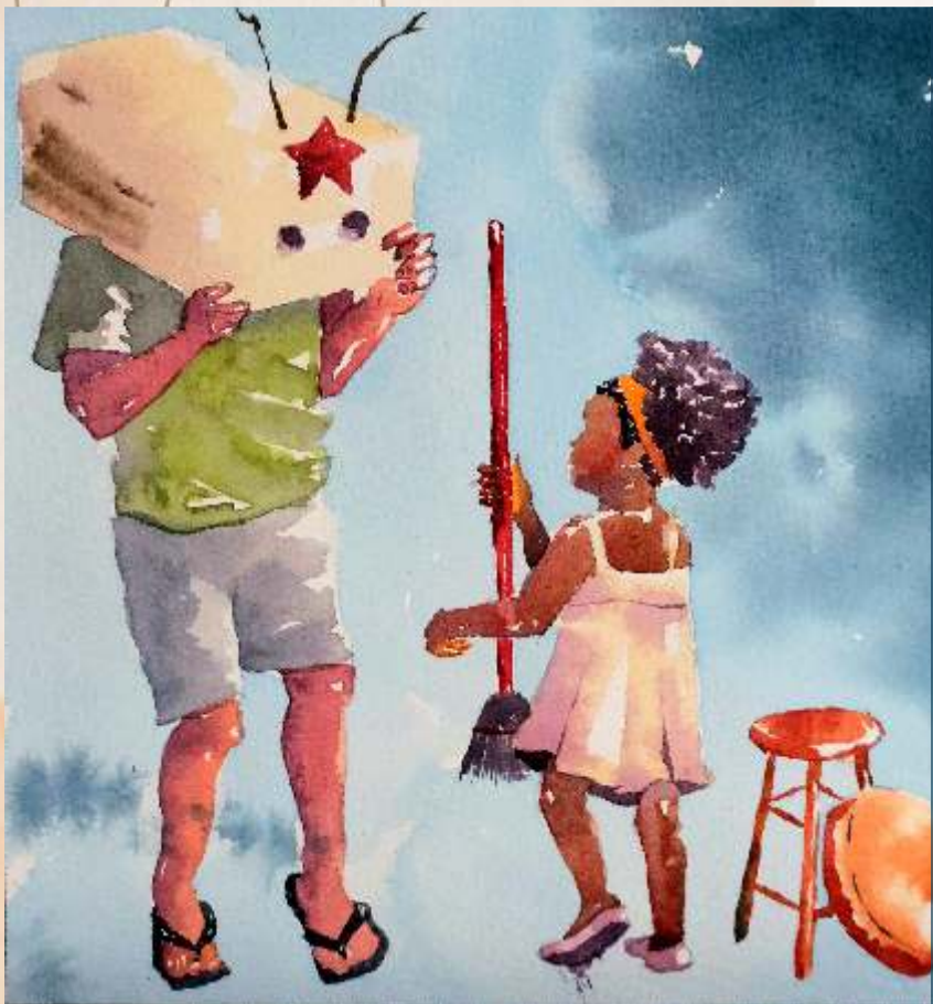
livro Brilho da Noite