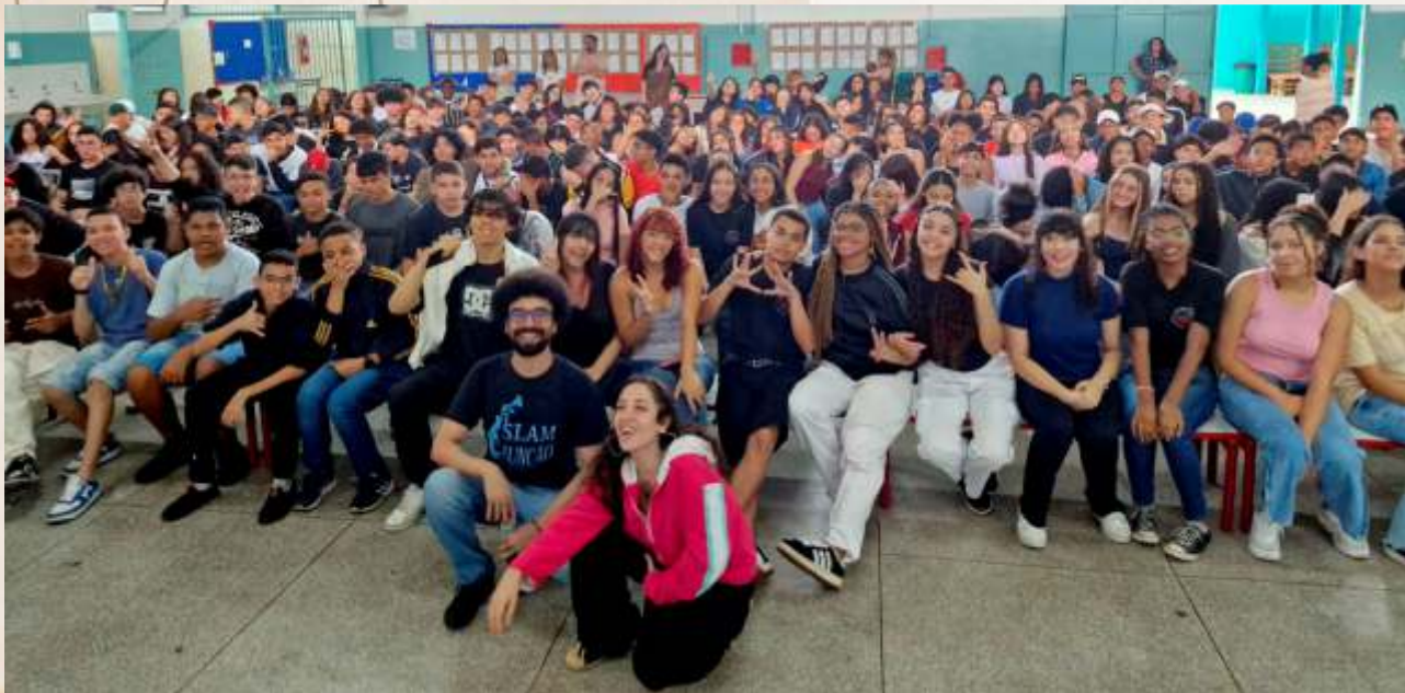
Sarau em Trânsito