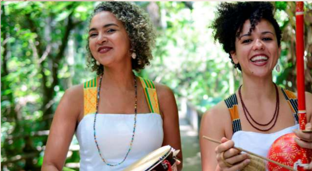
Brincando, Contando e Criando Bonecas Abayomis