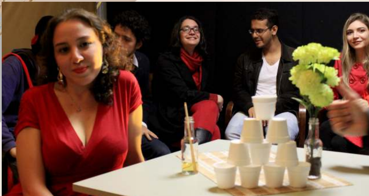
Um Olhar aos Mundos da Magia