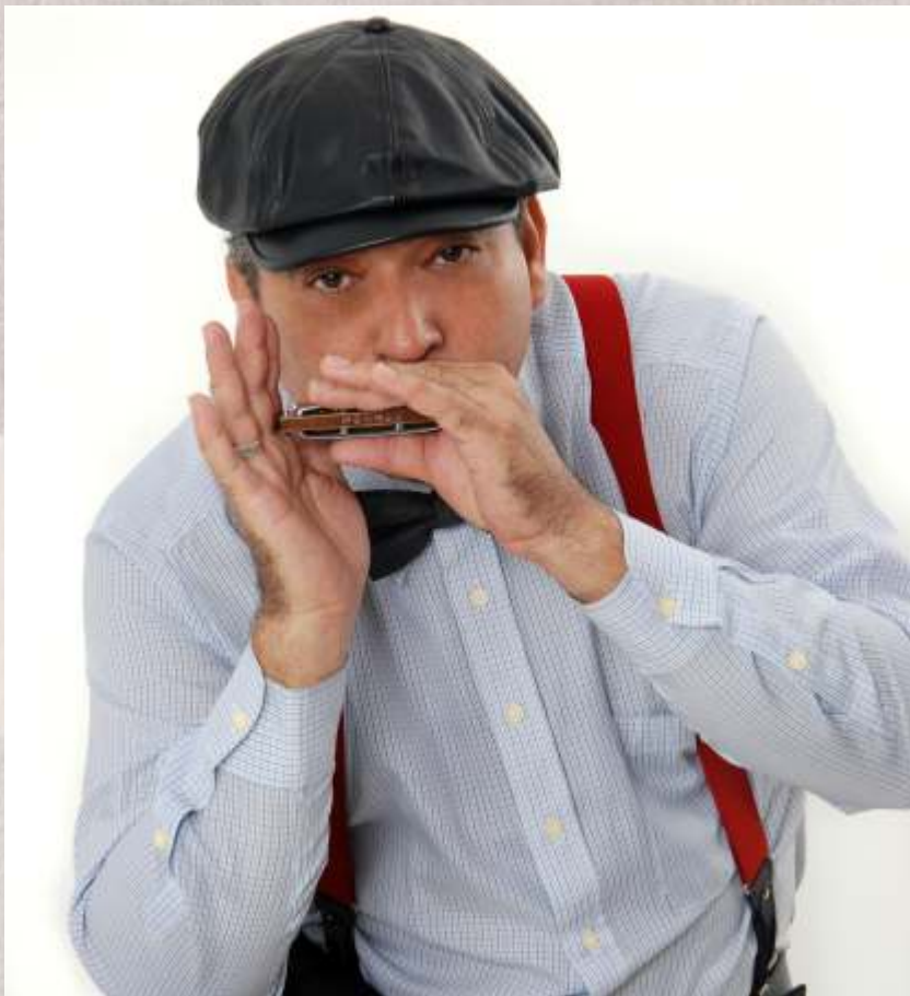
Leone da Gaita