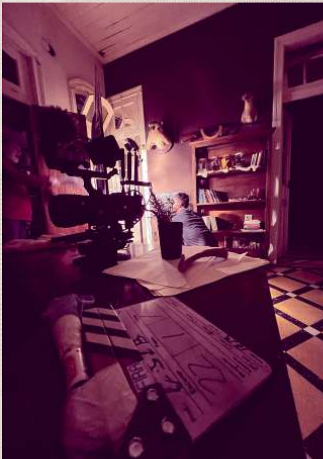
Audiovisual de Baixo Orçamento