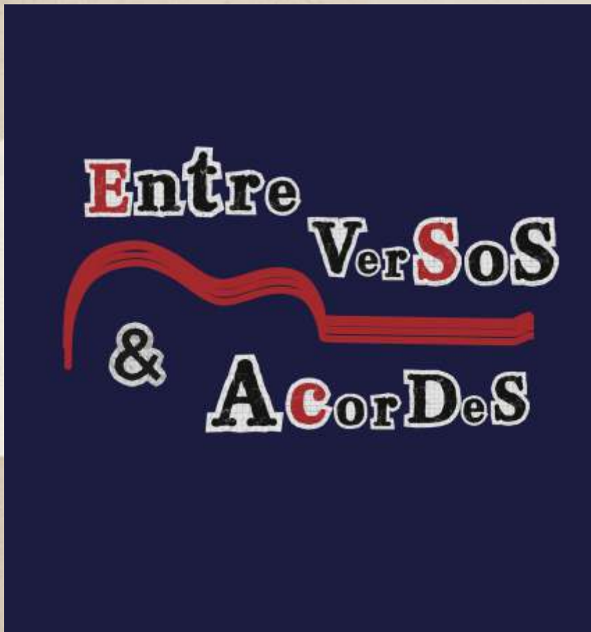
Entre Versos e Acordes