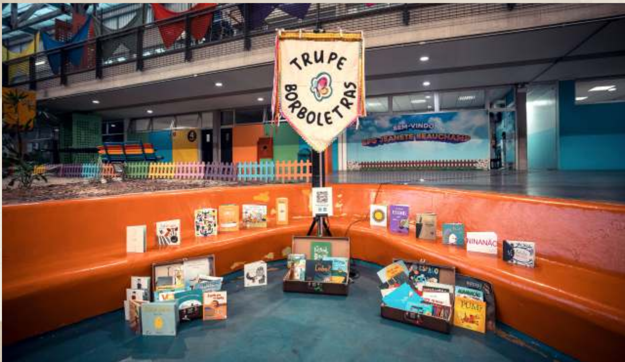
Literatura na Calçada