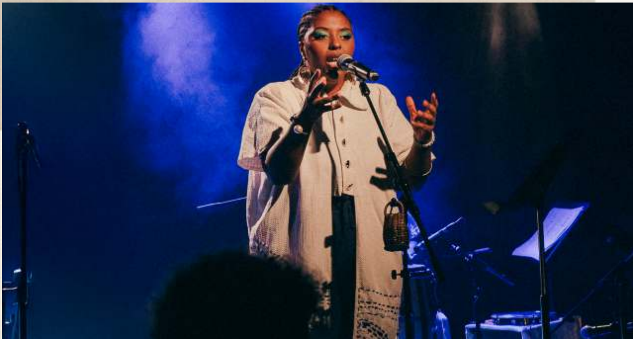
Barco: do naufrágio ao mergulho

Barco: do naufrágio ao mergulho [ou poemas de iniciação] O livro do naufrágio ao mergulho ou poemas de iniciação, convida, não aleatoriamente, seus leitores à uma imersão. Barco é a materialização disso. Um show poético-musical que convida o público a navegar nas águas e poesias de Luz Ribeiro.