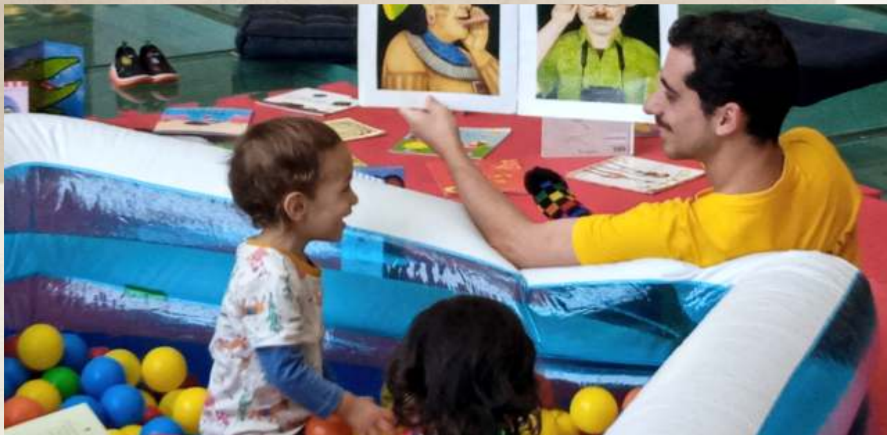
Banho de Livros