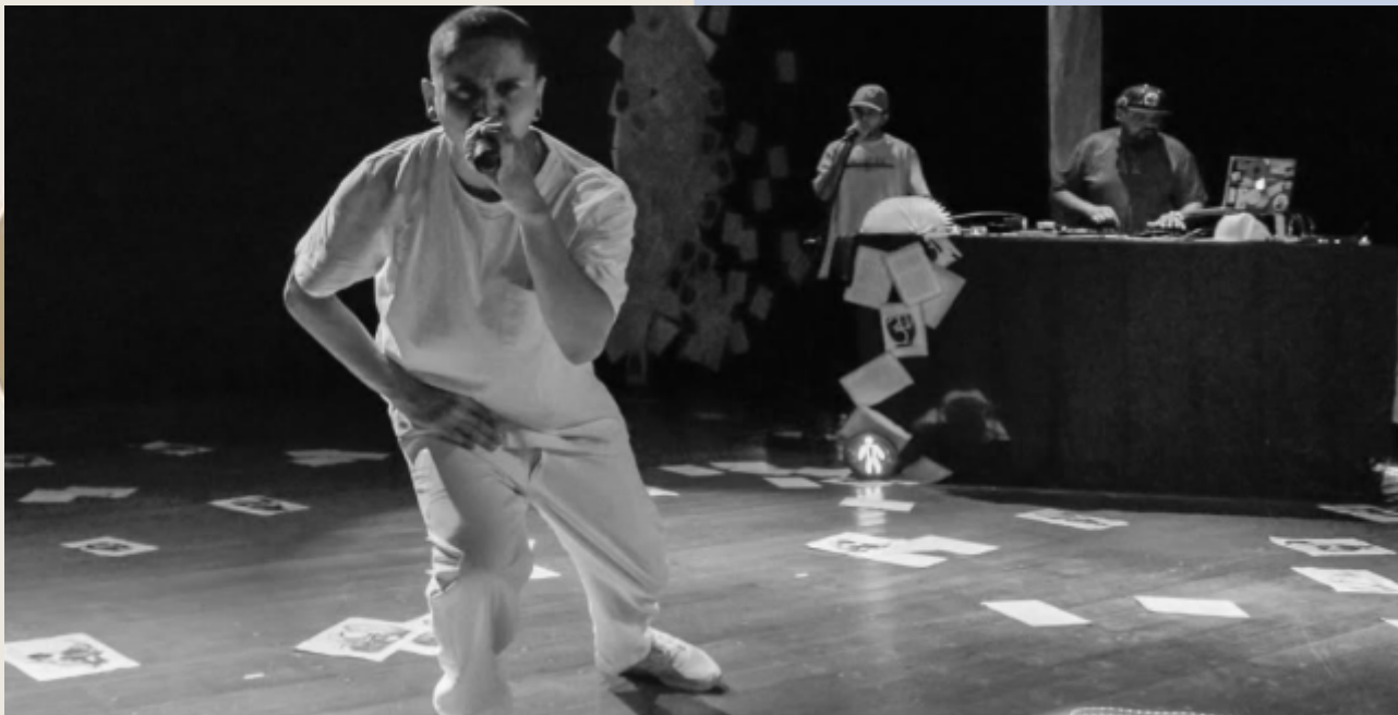
Literatura em Rap