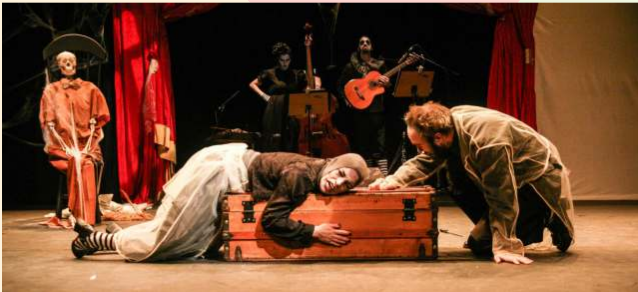
Mulheres do Brasil