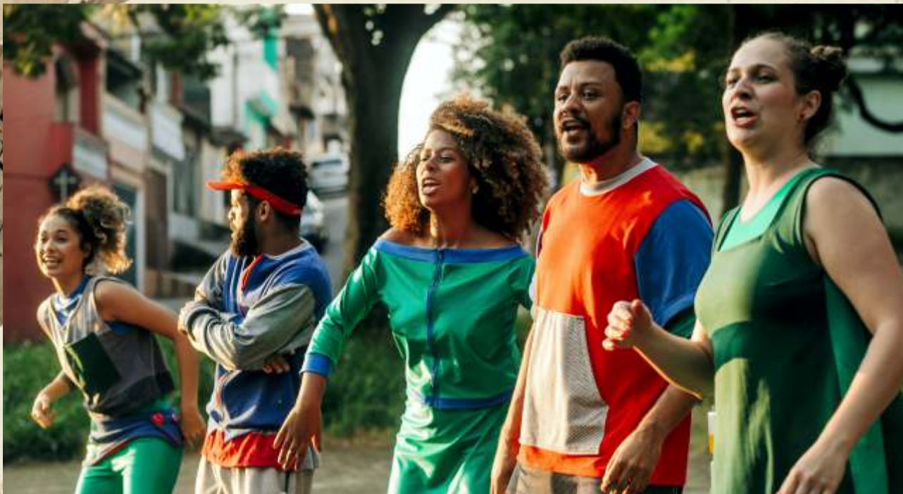
Ladeira das Crianças