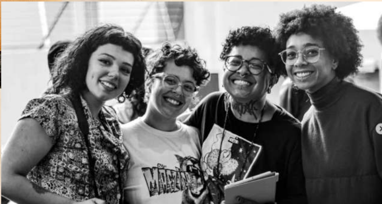
Sarau Autonomia Materna