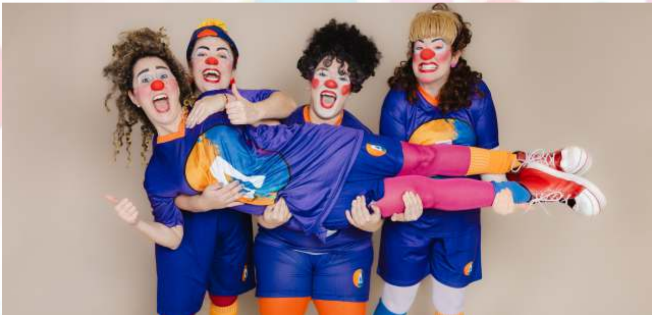
Futebol de Palhaças