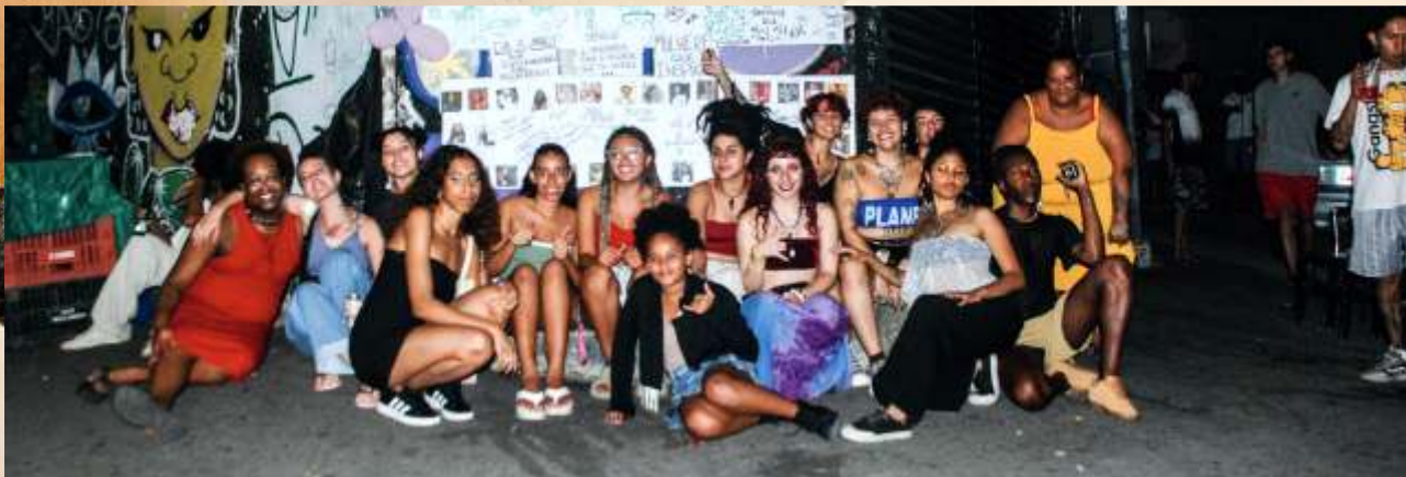
Sarau do DIM