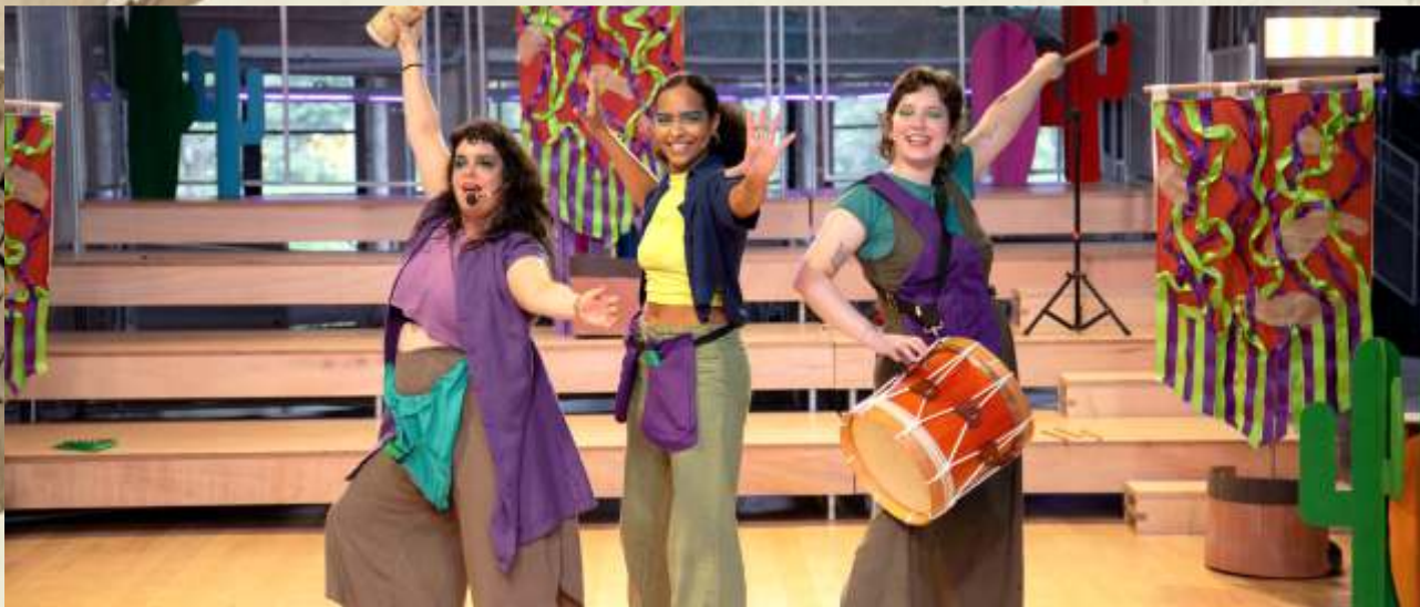
Cacto Lá e Cacto Cá