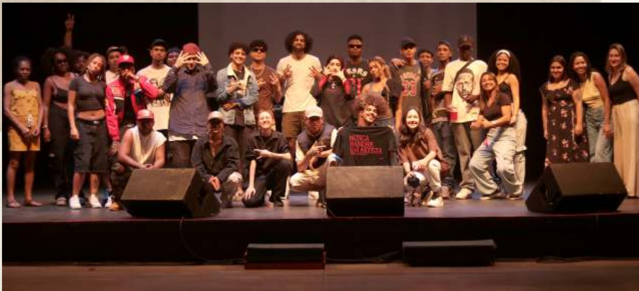
O Real Movimento