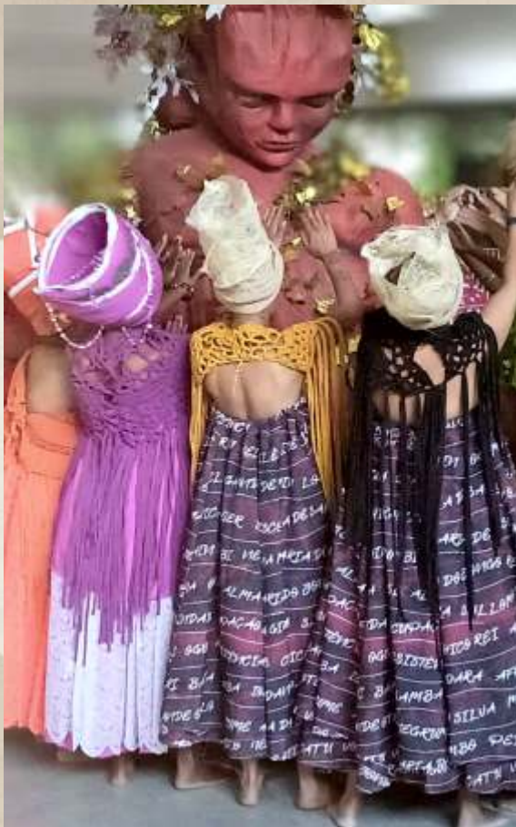
Negras Mulheres e Mães