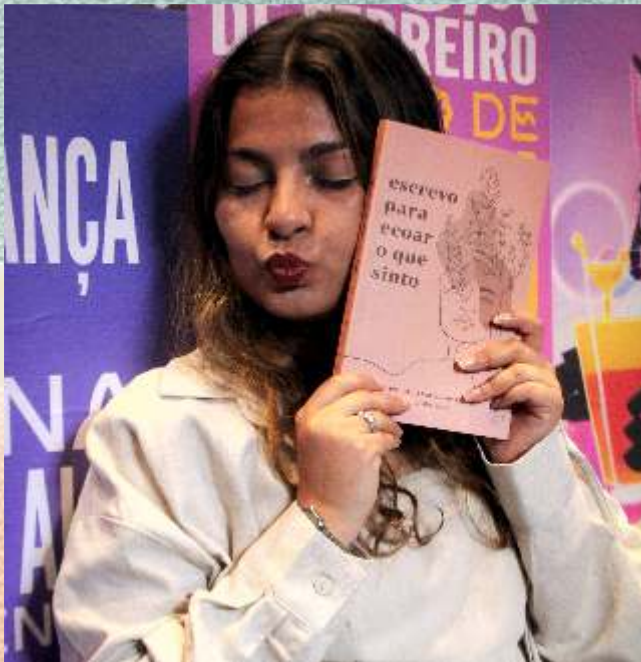
Mel com poesia