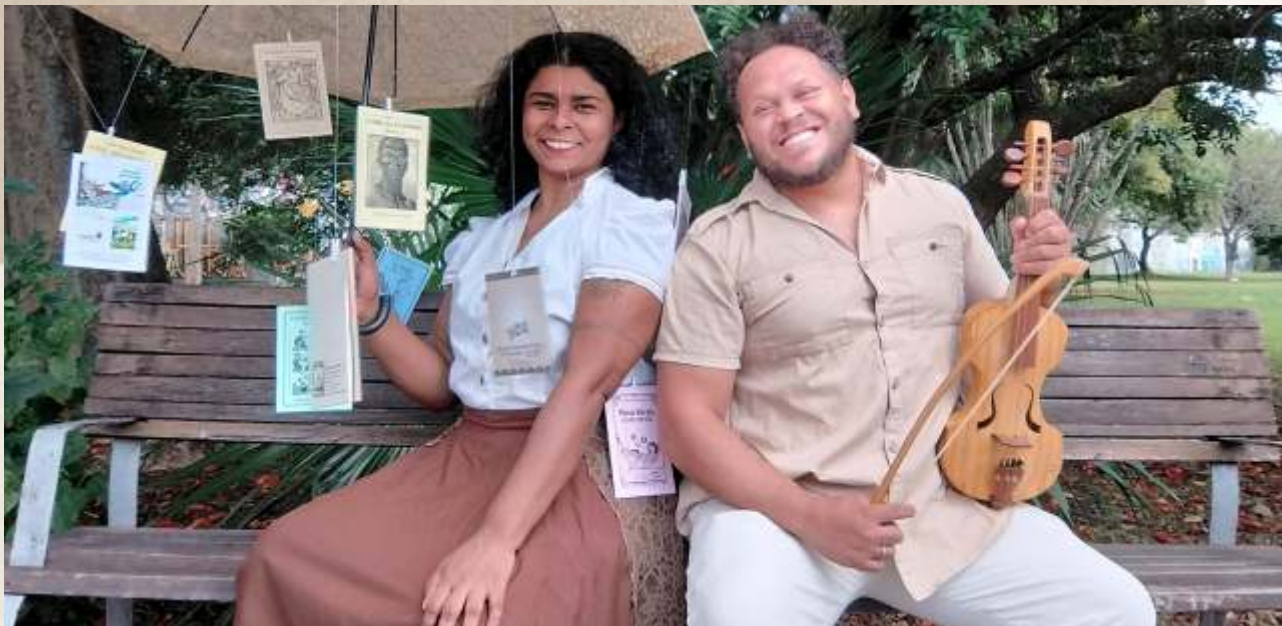
Nossas Histórias Escritas em Cordéis