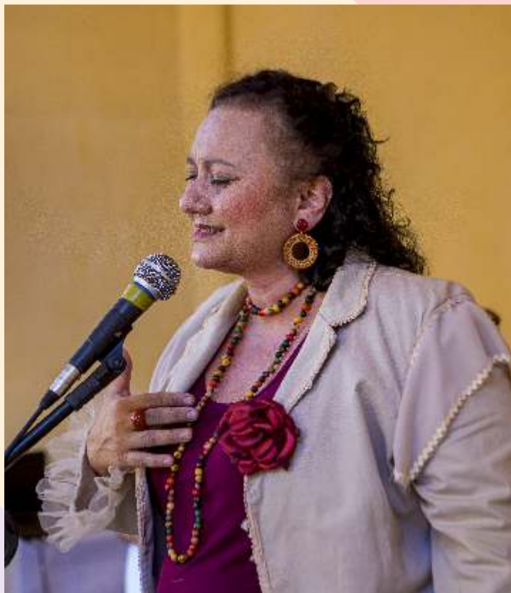
Mulheres que sabem seu lugar no mundo