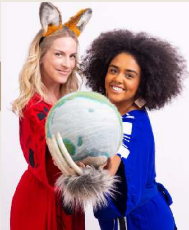
Planeta Oca - Show na biblioteca