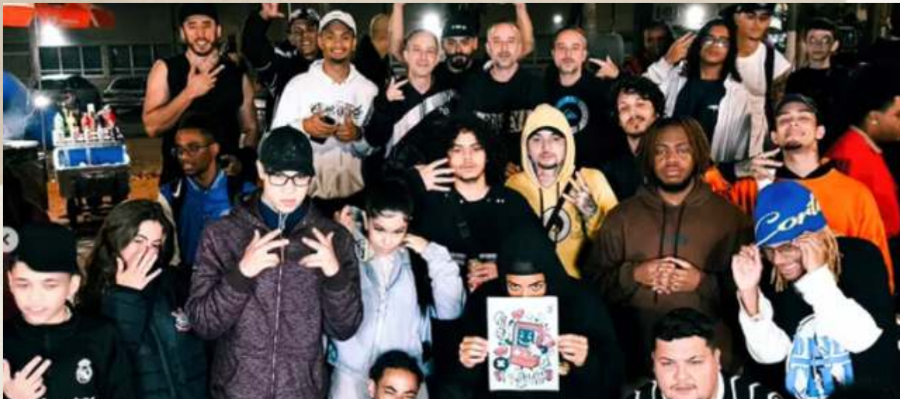
Versos em Movimento