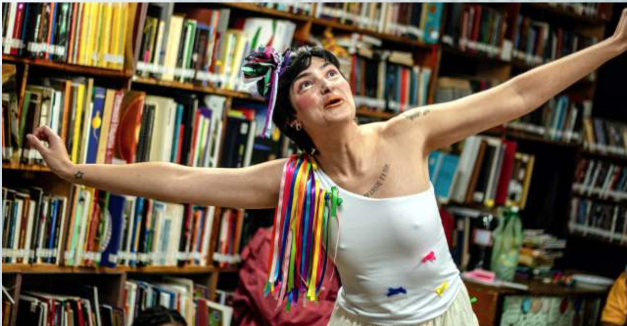
Vem Festá - um espetáculo de brincar