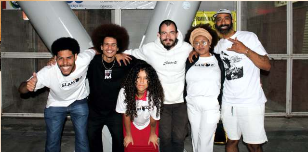
O Sarau do Slam OZ