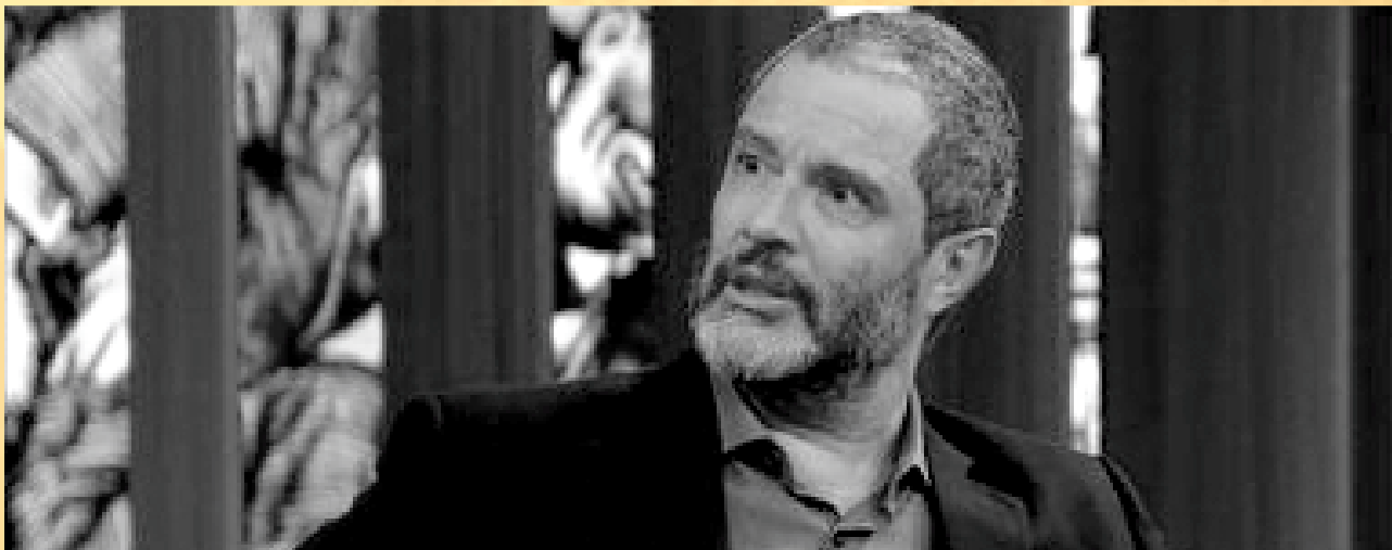
Por trás dos Quadrinhos

Dia 18 de março às 15h | Duração: 60 minutos