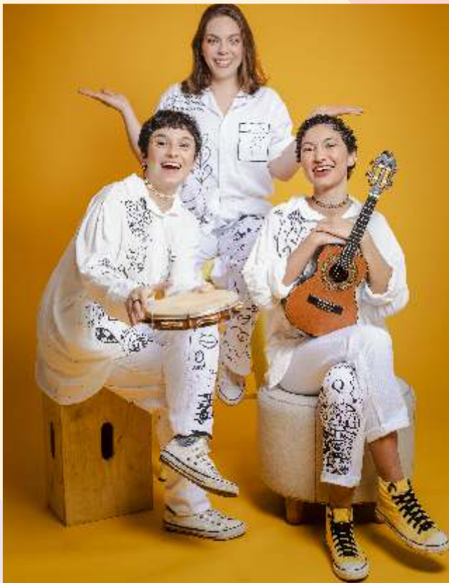
Você sabe quem é ela?