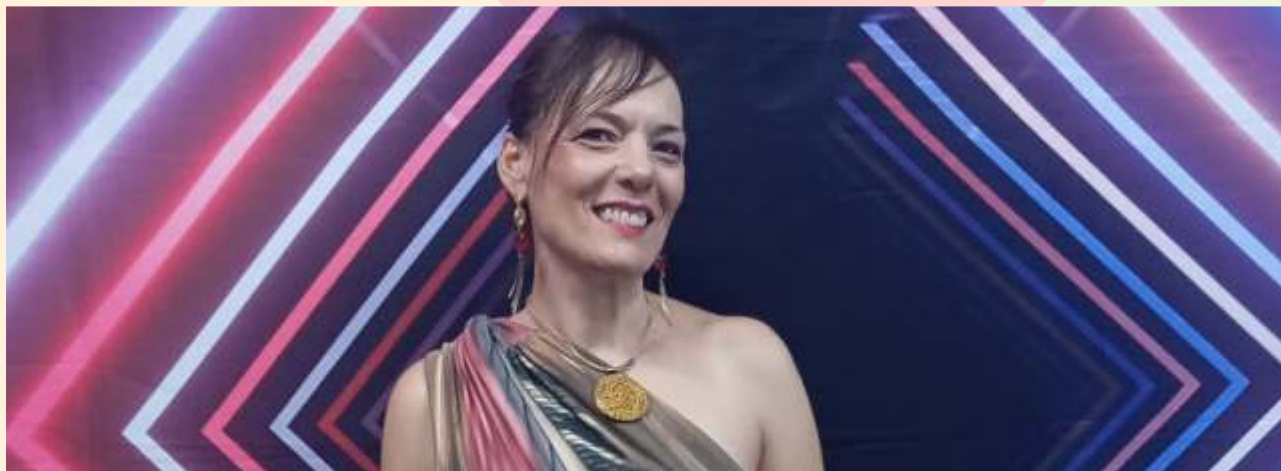
O Sapo e a Lua