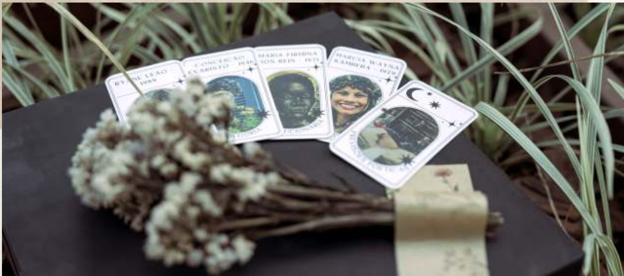
Tarot das Escritoras