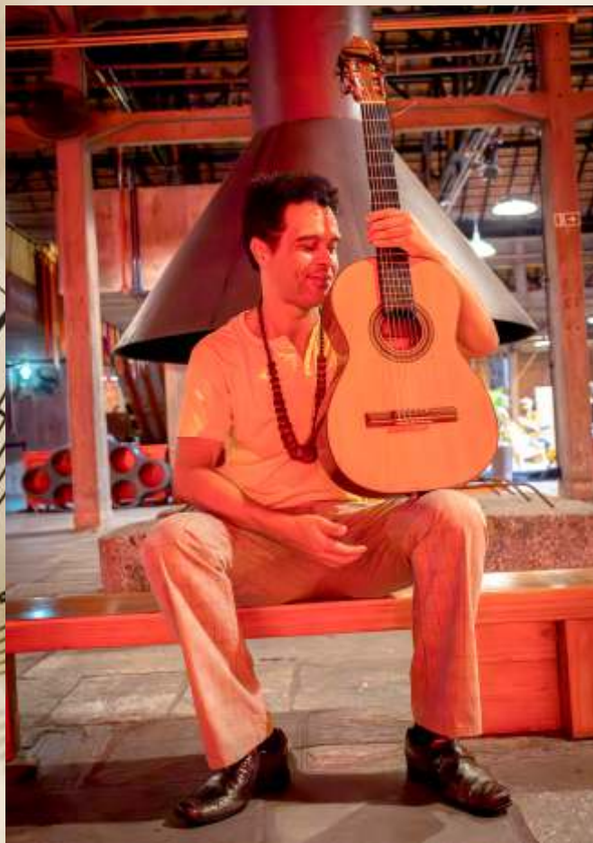
Os Livros e as Canções