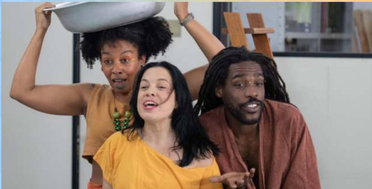
Contadeiras & seus Canteiros