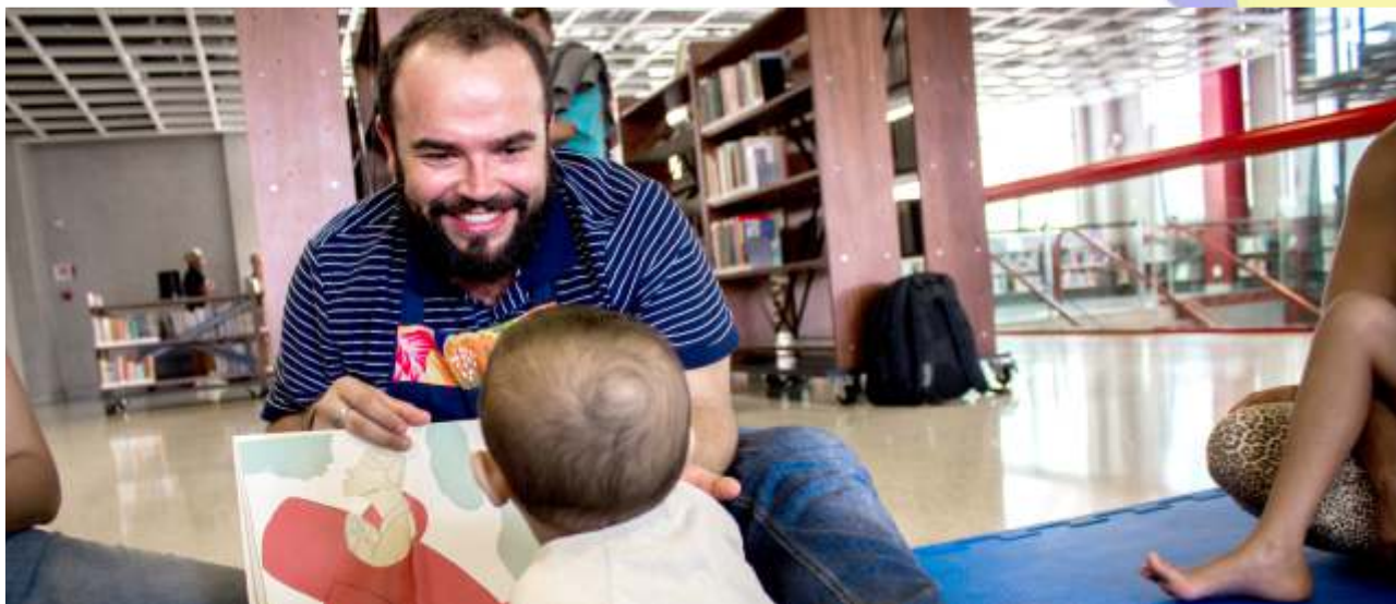
Engatinhando com as Histórias