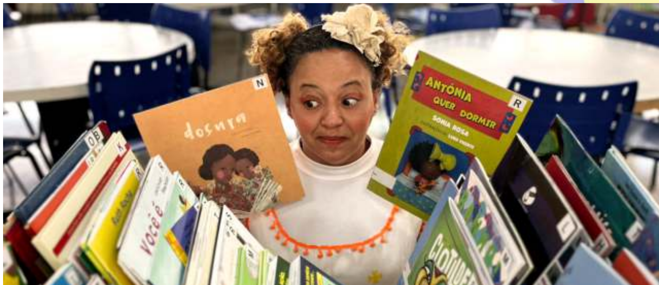
Do Conto ao Livro