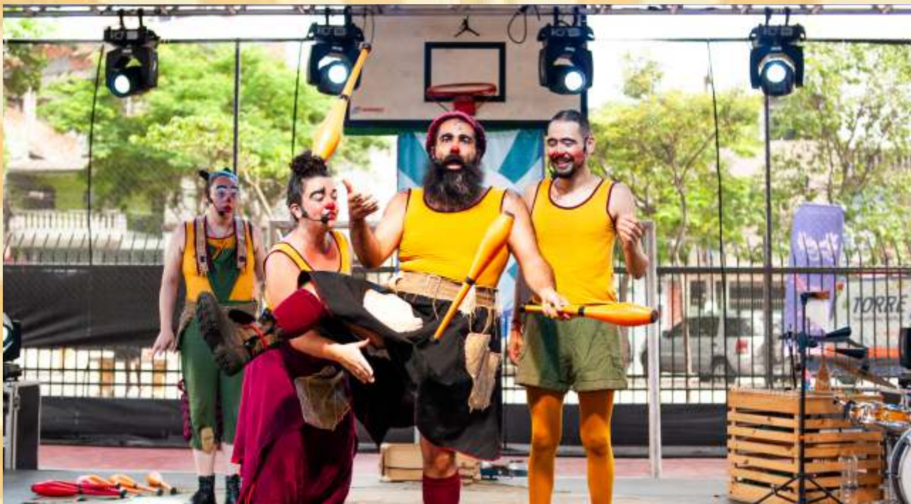
O Incrível Número Final