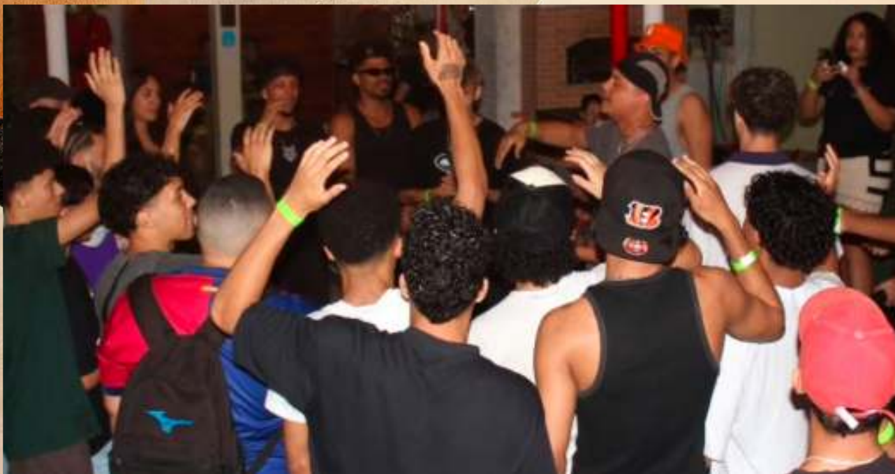
Batalha da Grove