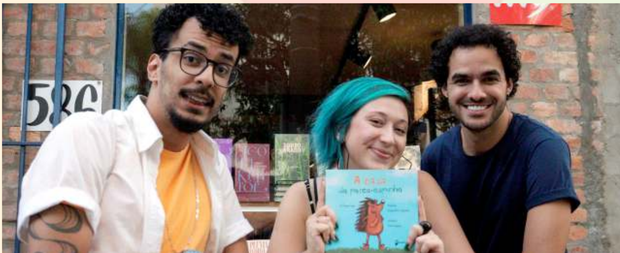
A Casa do Porco-Espinho