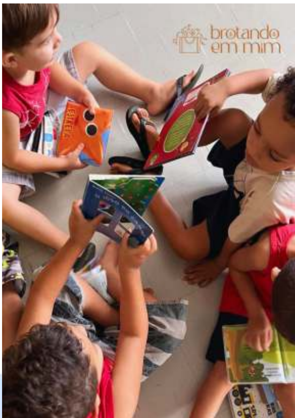
Lendo pra Gente Miúda