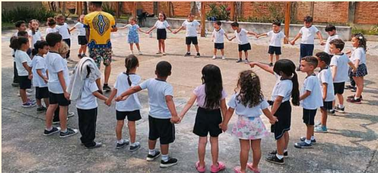
Brincadeiras da África