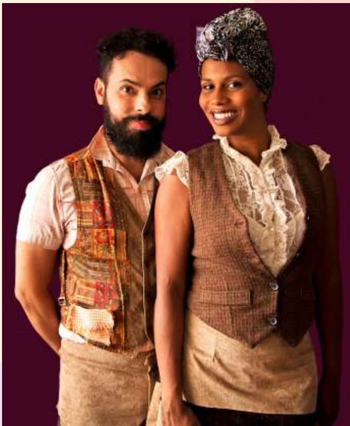
Pequenas Notáveis - Carolina de Jesus