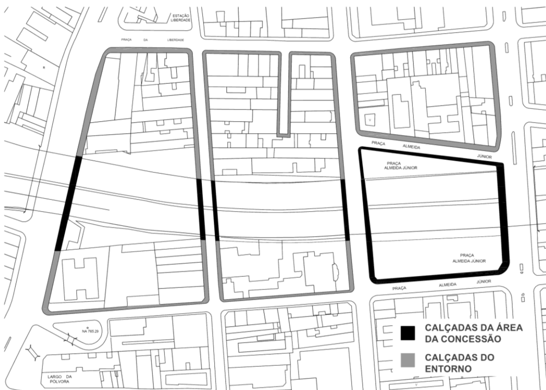
Figura 1 - Perímetro das CALÇADAS DO ENTORNO

Elaboração: São Paulo Parcerias.