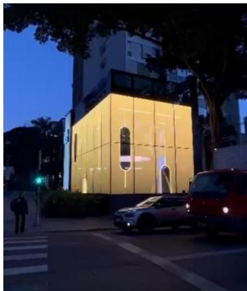
Vista da esquina com LEDGLASS em funcionamento. 10/06/2025