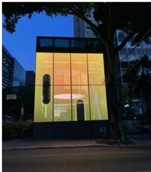
Vista do LEDGLASS na Rua Tabapuã. 10/06/2025