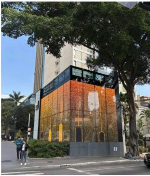
Vista da esquina com LEDGLASS em funcionamento. 10/07/2025