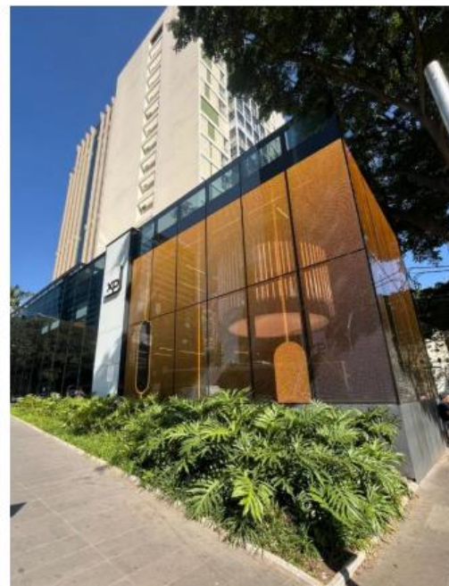
Vista do LEDGLASS em funcionamento.