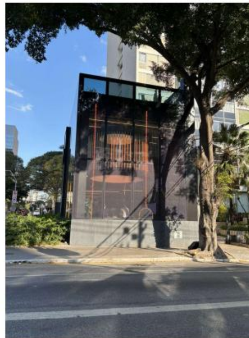
Vista do LEDGLASS na Rua Tabapuã. 22/07/2025