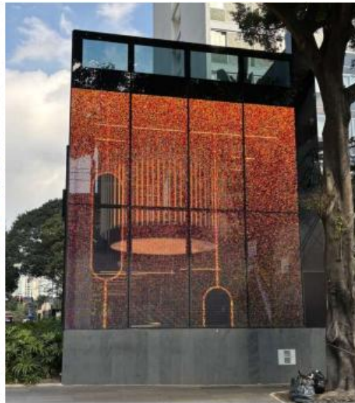
Vista do LEDGLASS na Rua Tabapuã. 10/07/2025