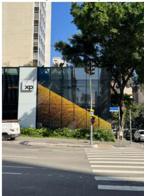
Vista do LEDGLASS na Av. Brigadeiro Faria Lima.