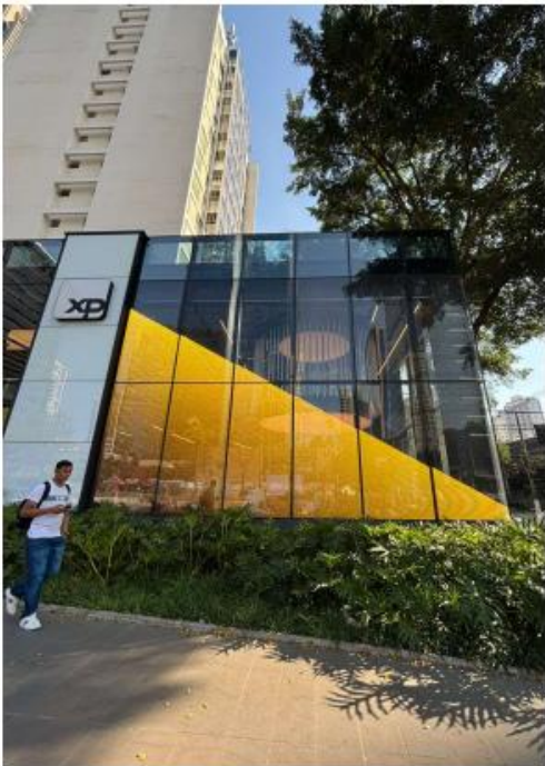
Vista do LEDGLASS na Av. Brigadeiro Faria Lima. 22/07/2025