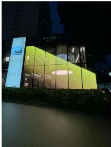
Vista da esquina com LEDGLASS em funcionamento. 05/08/2025