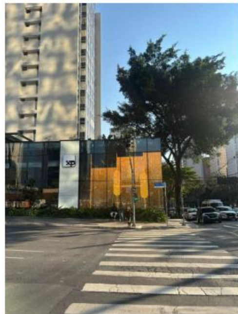
Vista do LEDGLASS na Av. Brigadeiro Faria Lima. 12/08/2025