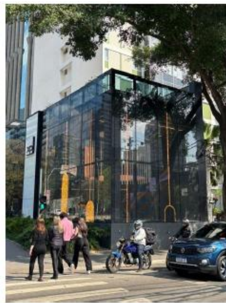
Vista do LEDGLASS na Av. Brigadeiro Faria Lima 27/08/2025