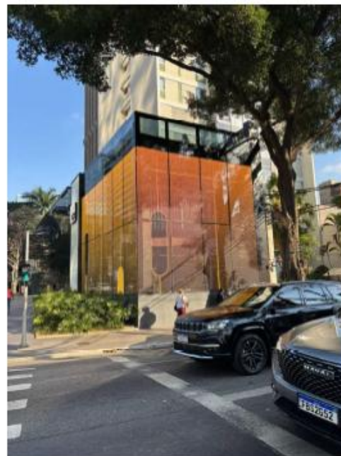
Vista do LEDGLASS em funcionamento. 12/08/2025