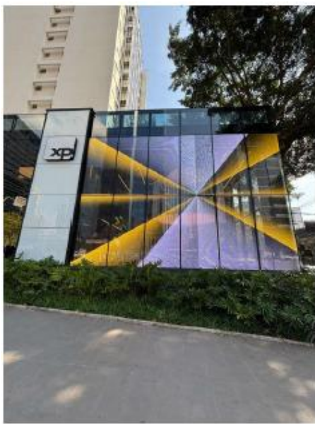
Vista do LEDGLASS esquina Rua Tabapuã 27/08/2025