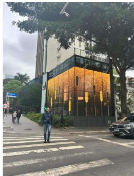
Vista do LEDGLASS na Rua Tabapuã 25/09/2025