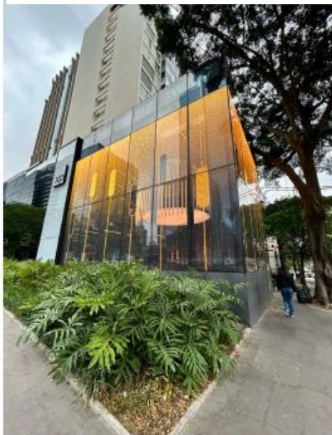
Vista do LEDGLASS na Av. Brigadeiro Faria Lima. 25/09/2025