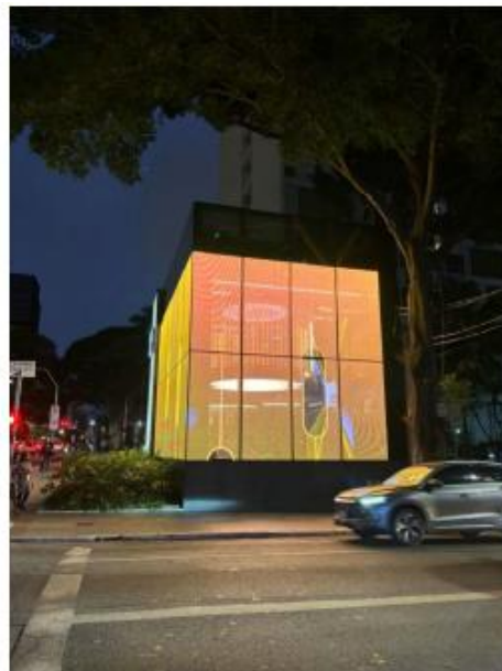
Vista do LEDGLASS na Rua Tabapuã 05/08/2025