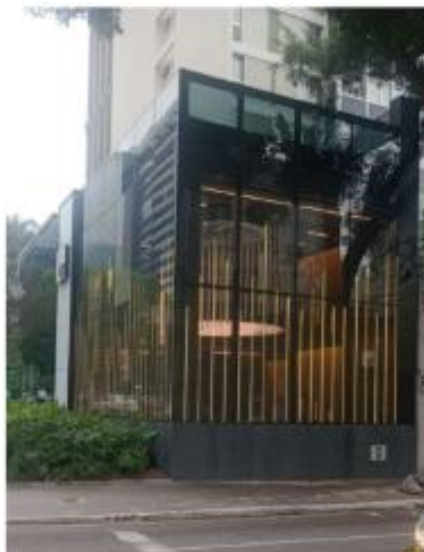
Vista do LEDGLASS na Av. Brigadeiro Faria Lima 02/10/2025