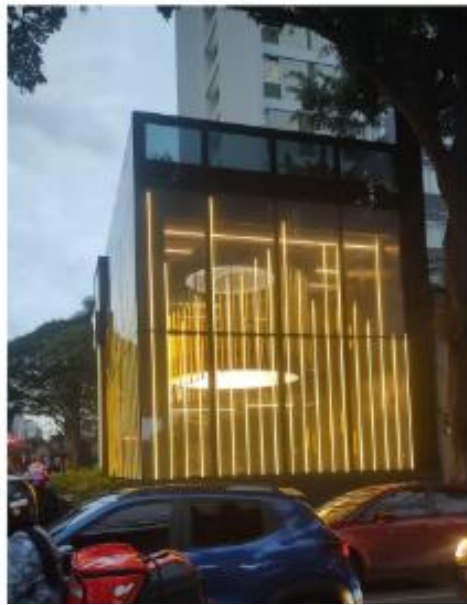
Vista do LEDGLASS em funcionamento. 06/11/2025