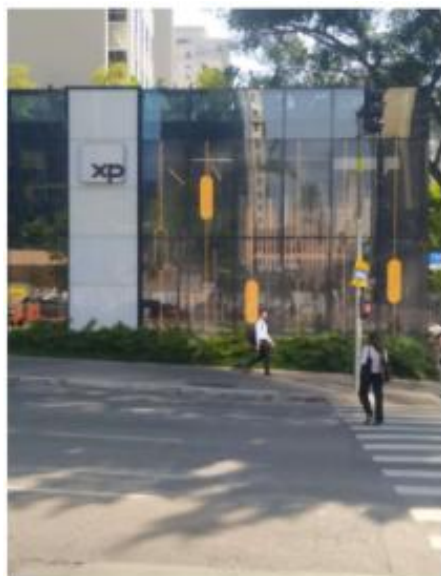
Vista do LEDGLASS na Av. Brigadeiro Faria Lima. 16/10/2025