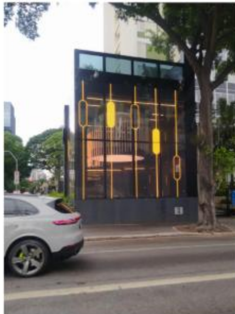
Vista do LEDGLASS na esquina da Rua Tabapuã 13/11/2025