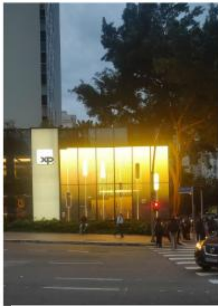
Vista do LEDGLASS na Av. Brigadeiro Faria Lima. 06/11/2025