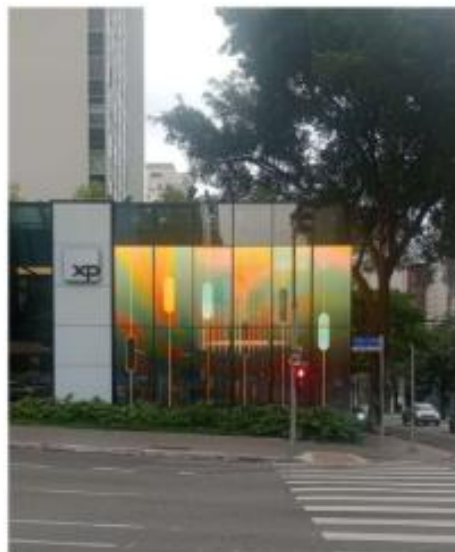
Vista do LEDGLASS esquina Rua Tabapuã 02/10/2025