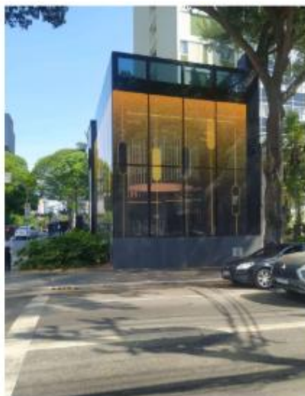
Vista do LEDGLASS na Rua Tabapuã 16/10/2025