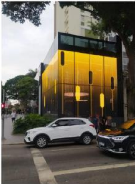
Vista do LEDGLASS na esquina da Rua Tabapuã 13/11/2025