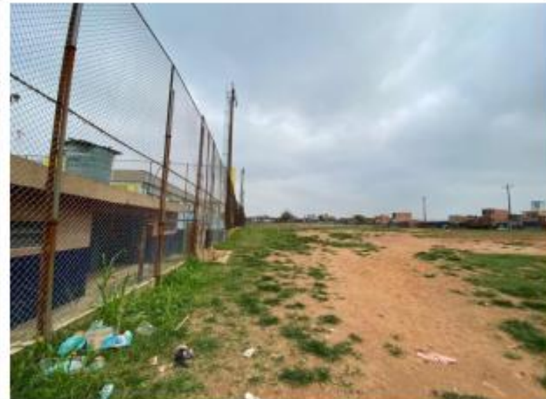
FOTO 05 - CAMPO