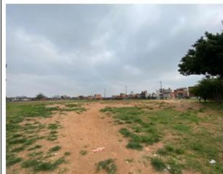
FOTO 08 - ALAMBRADO