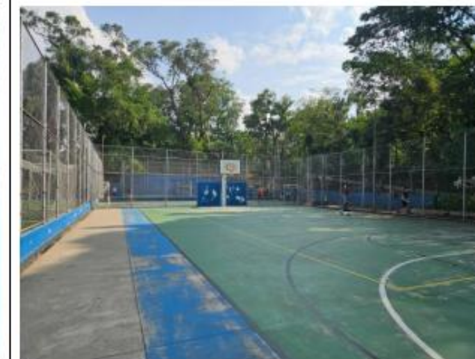
FOTO 08 – QUADRA POLIESPORTIVA