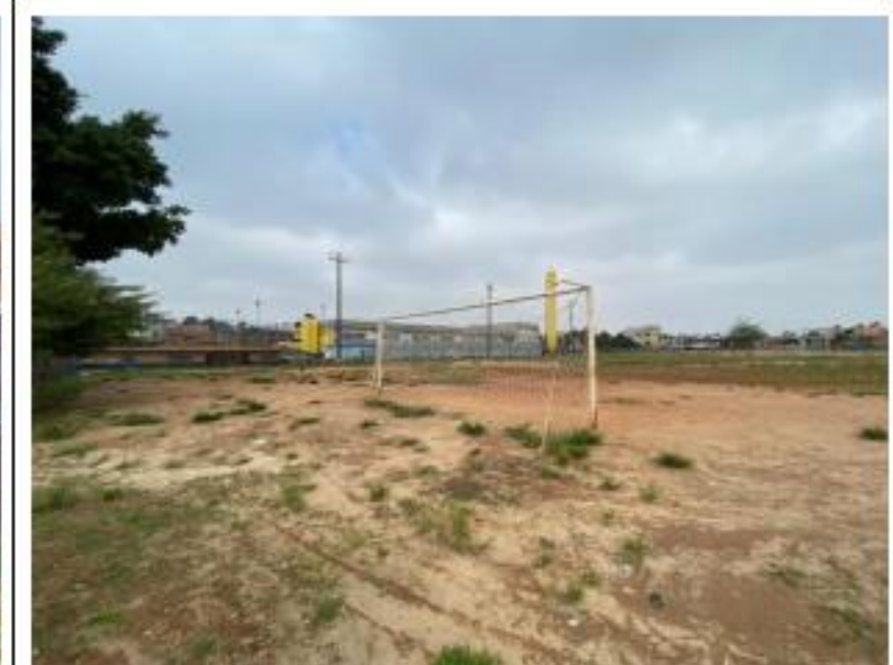
FOTO 09 - ALAMBRADO