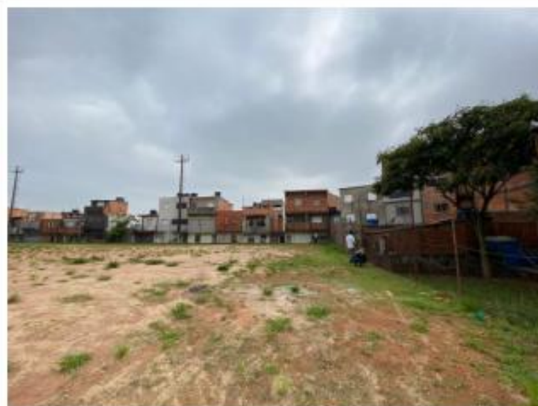
FOTO 10 - ALAMBRADO