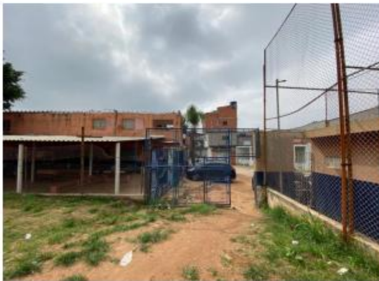
FOTO 02 - ALAMBRADO