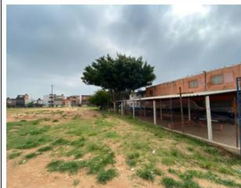
FOTO 06 - CAMPO