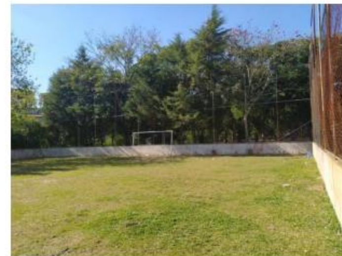
FOTO 17- CAMPO