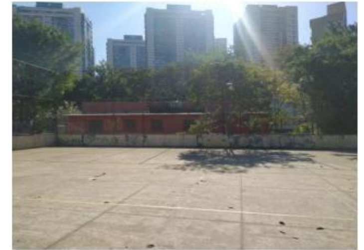
FOTO 16 - QUADRA