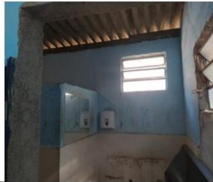
FOTO 2 - BANHEIRO