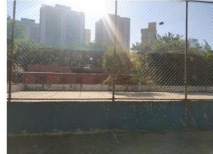
FOTO 15- ALAMBRADO