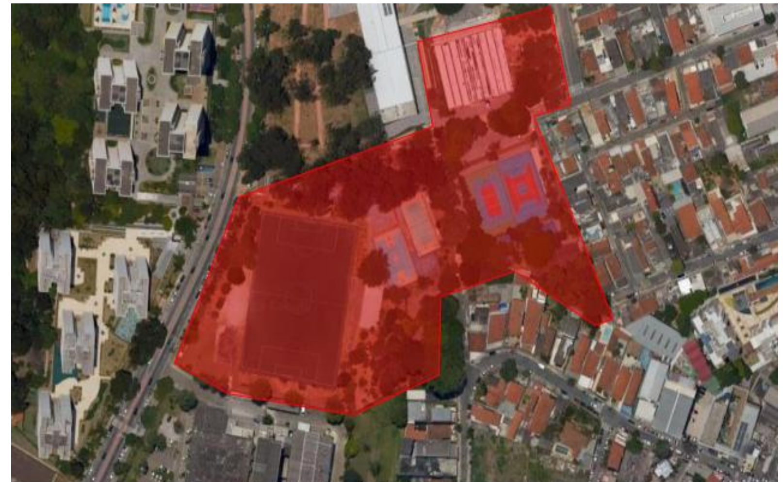
Figura 1 – Localização CEE Freguesia do Ó