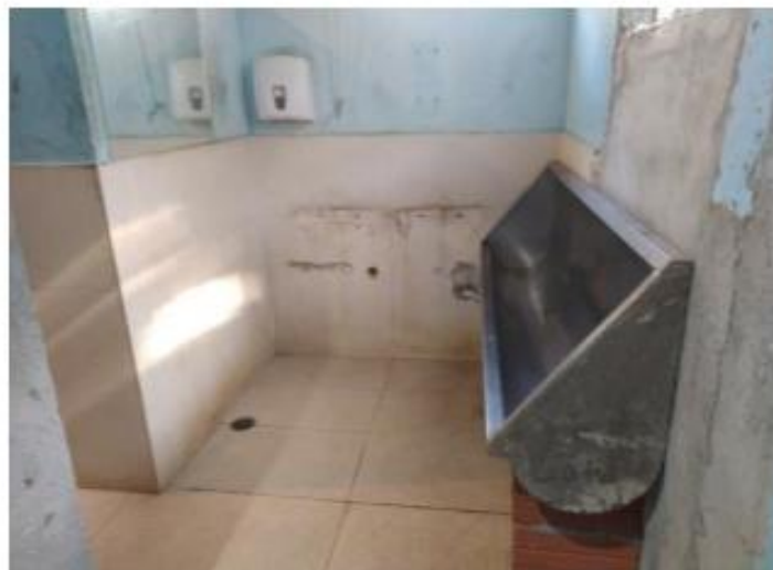
FOTO 3 - BANHEIRO