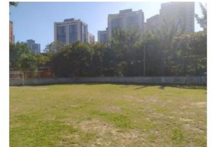
FOTO 18- CAMPO