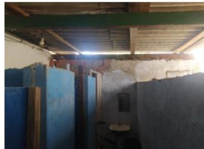
FOTO 4 - VESTIÁRIO