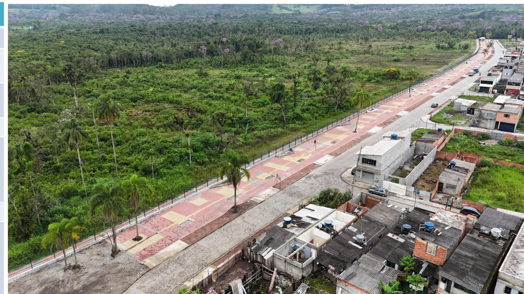
Vargem Grande Abr./2026.