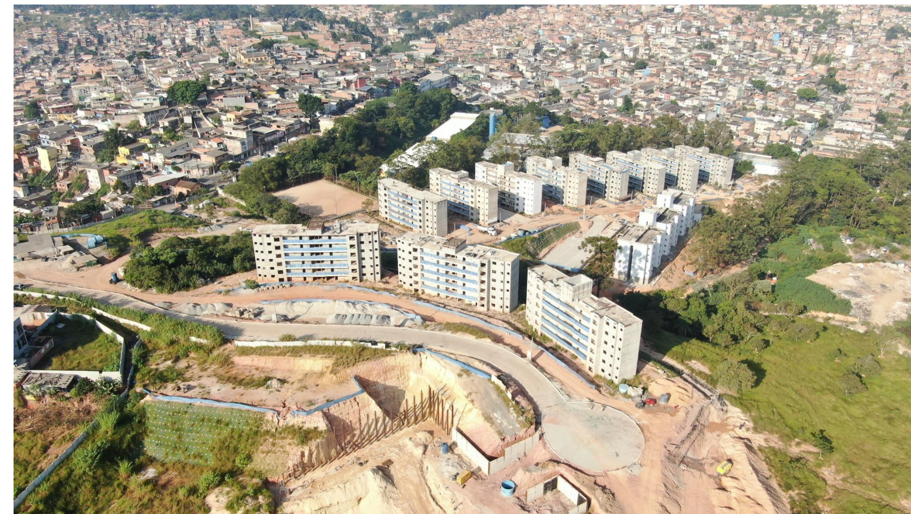
Obra em andamento de provisão habitacional. Vila do Sol – Jd. Ângela. Abr./2026.