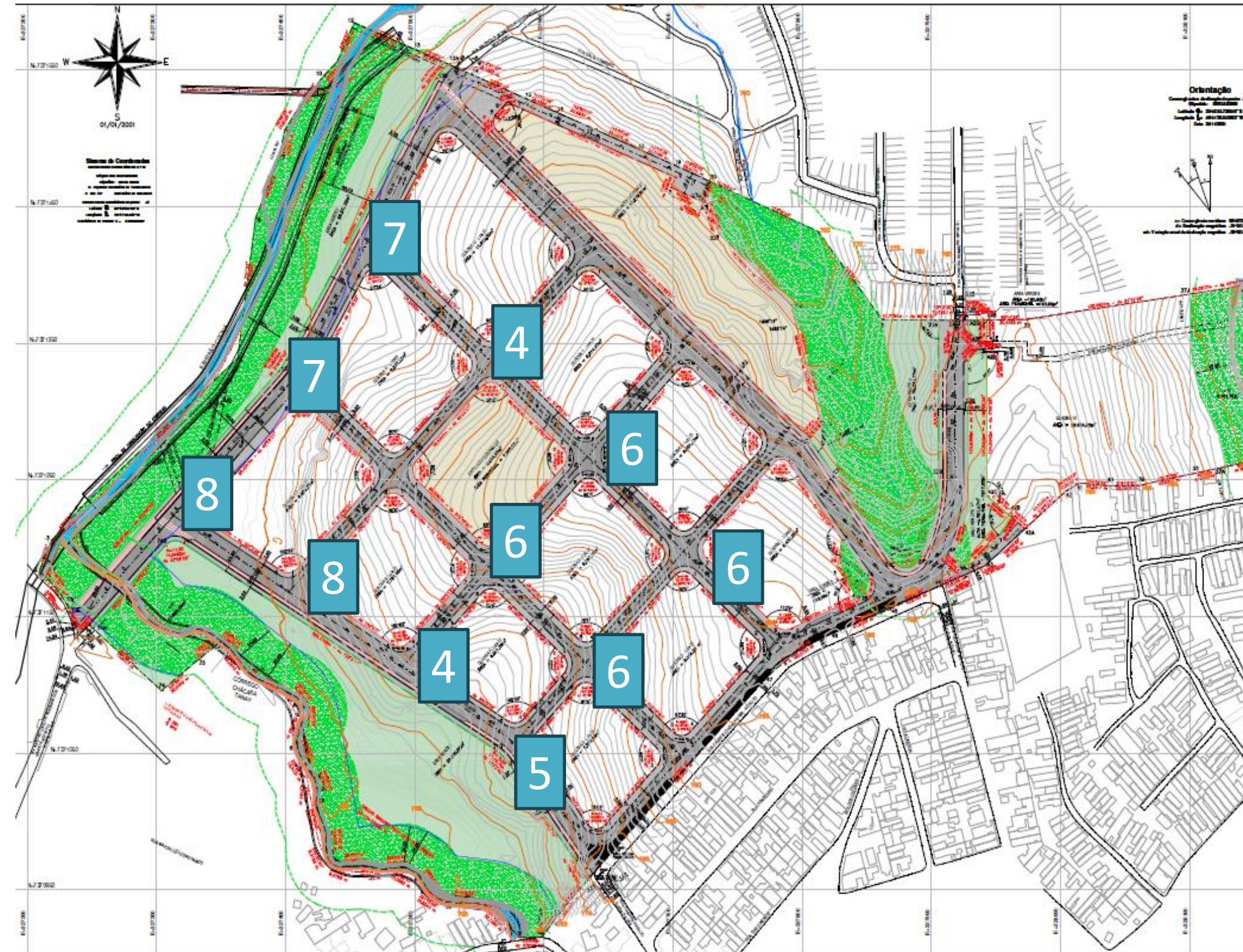
CH Novo Brasil. Obras de UHs e construção de infraestrutura pública. Lotes 4, 5, 6, 7 e 8.