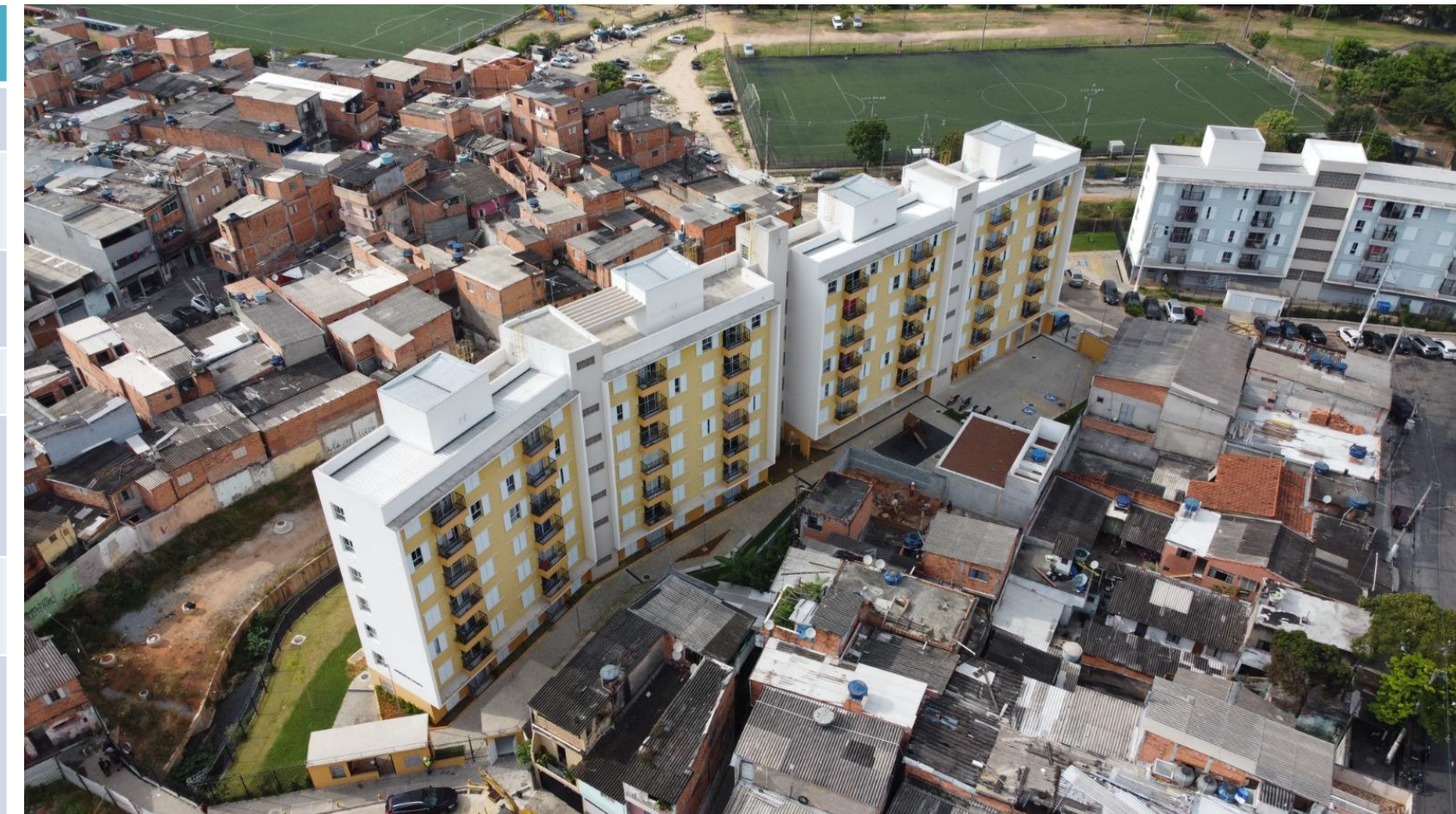
Cidade Julia (Guaicuri). Abr./2026