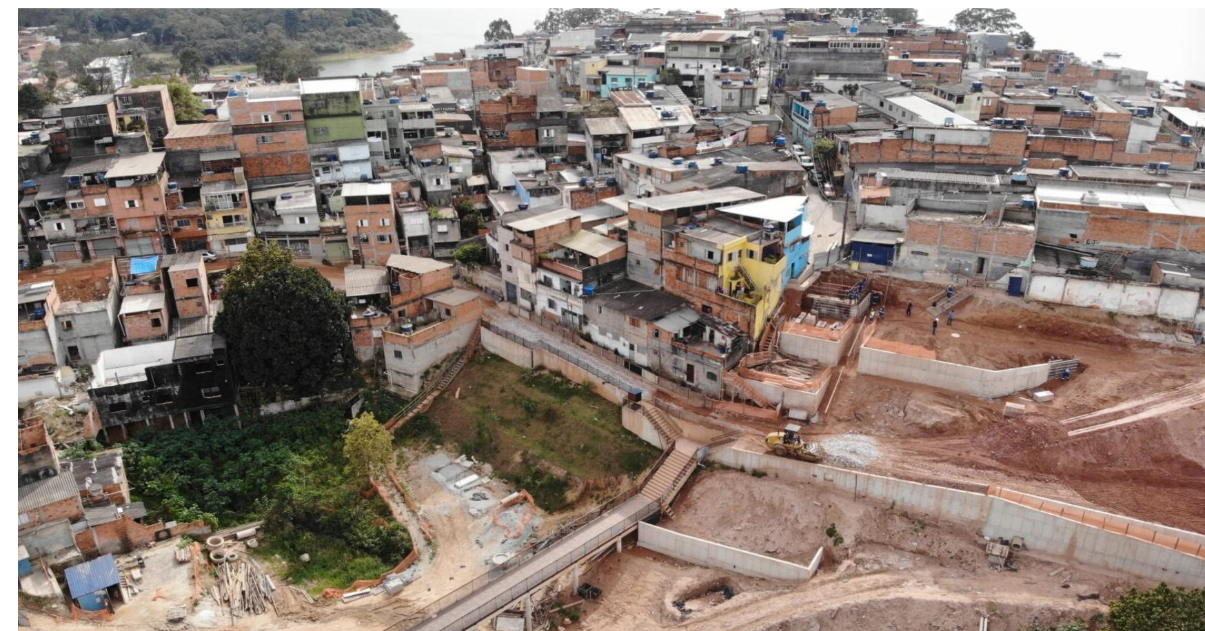
Cantinho do Céu - etapa 5 - frente 3 Abr./2026.