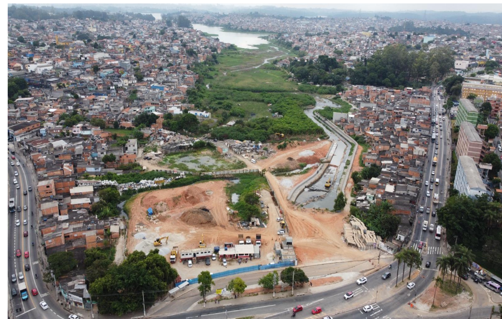
Bola Branca – Nova Grajaú II Abr./2026.