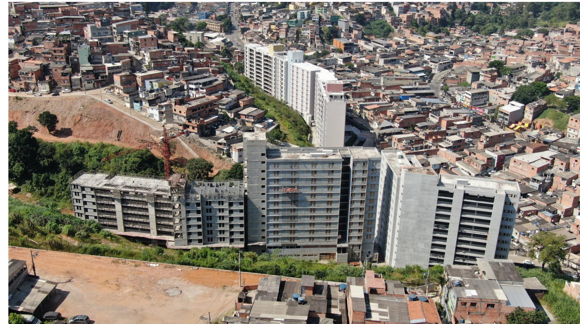
Provisões e urbanização – Boulevard da Paz. Abr./2026