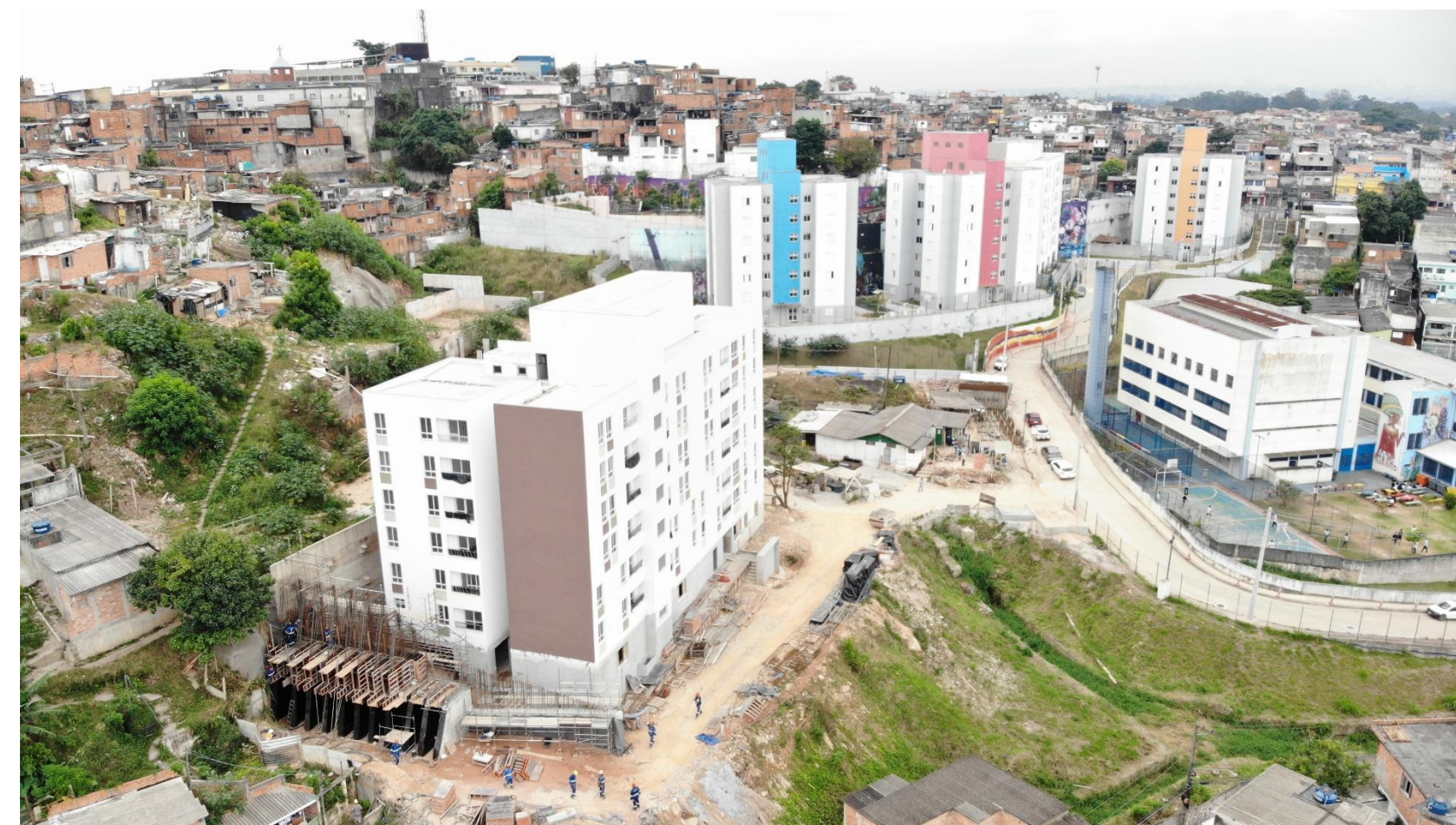
Alto da Alegria. Unidades habitacionais. Abr./2026.