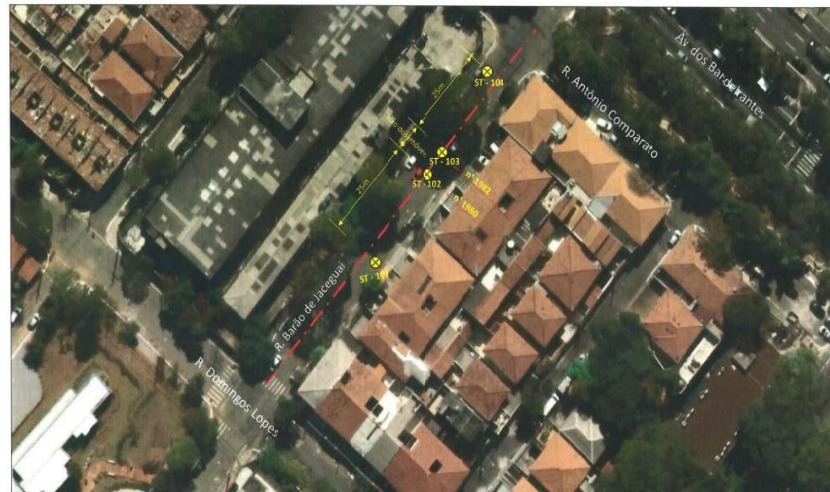
Rua Barão de Jaceguai